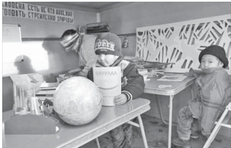
Весь мир на глобусе