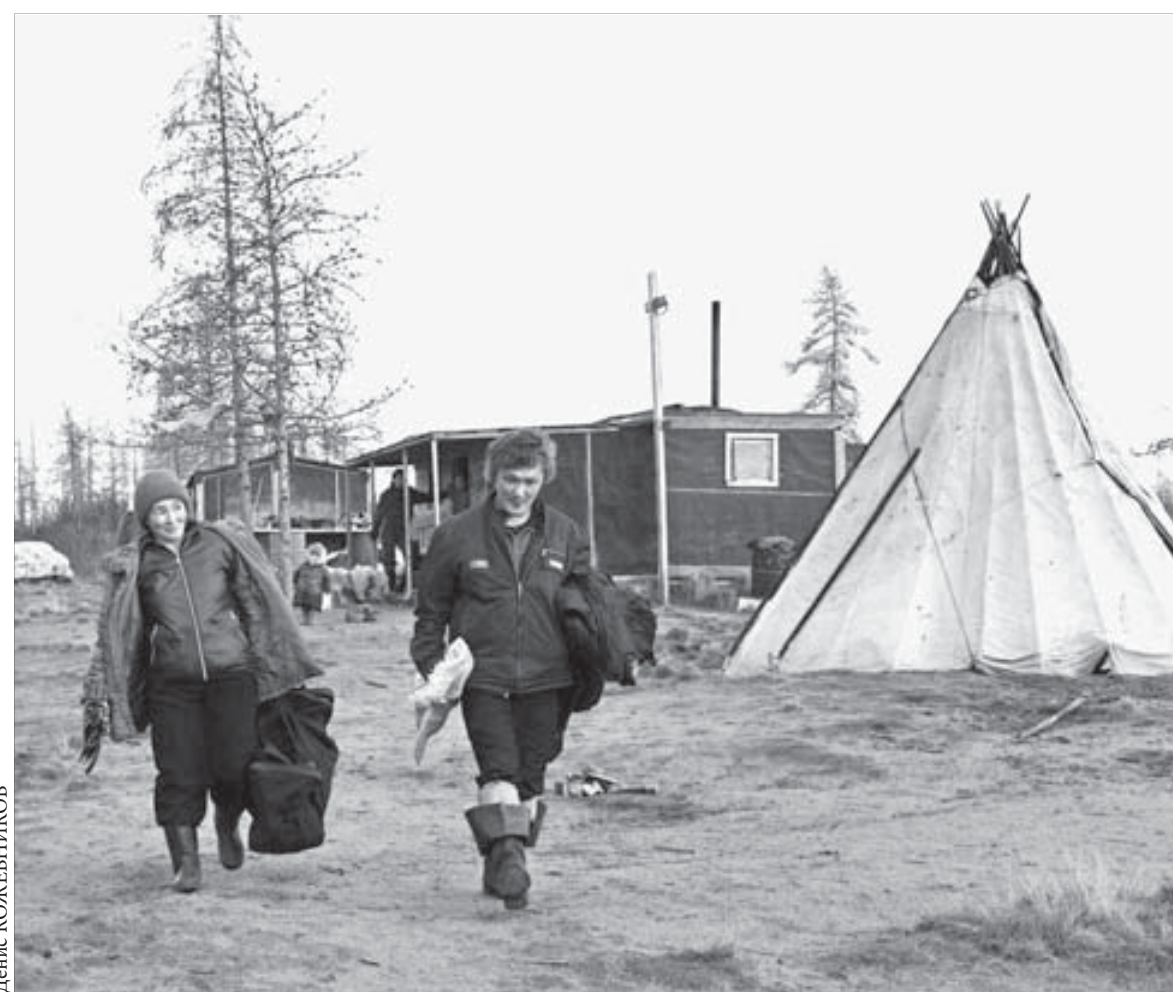
Крепкая семья Найвоседо