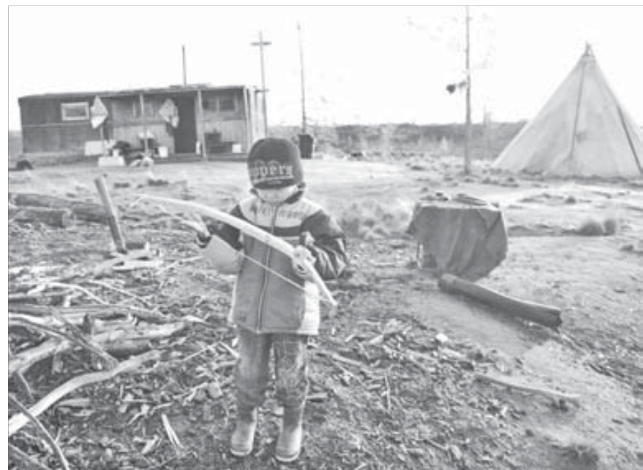
Мой дом – мое кочевье