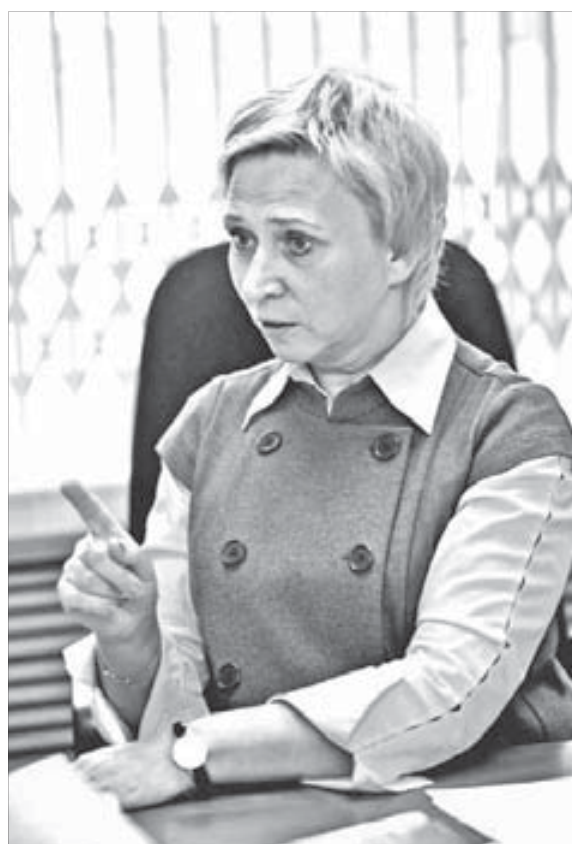
На любые вопросы можно получить ответ

– А если человек уехал, например, в Абакан или Назарово, не оформив удостоверение? – Он может вернуться, зарегистрироваться по месту пребывания и оформить этот статус. Когда