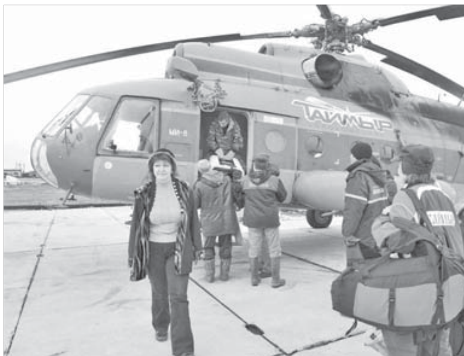
В школу на вертолете