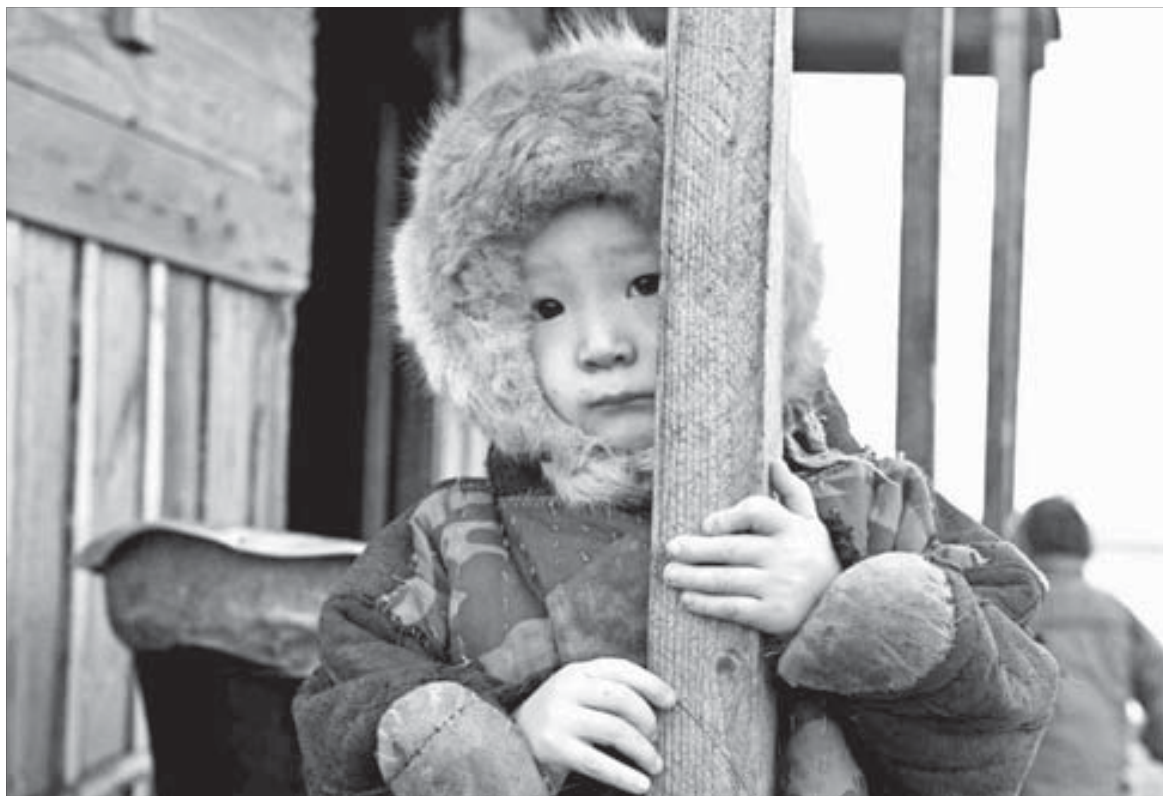
Новое поколение таймырцев