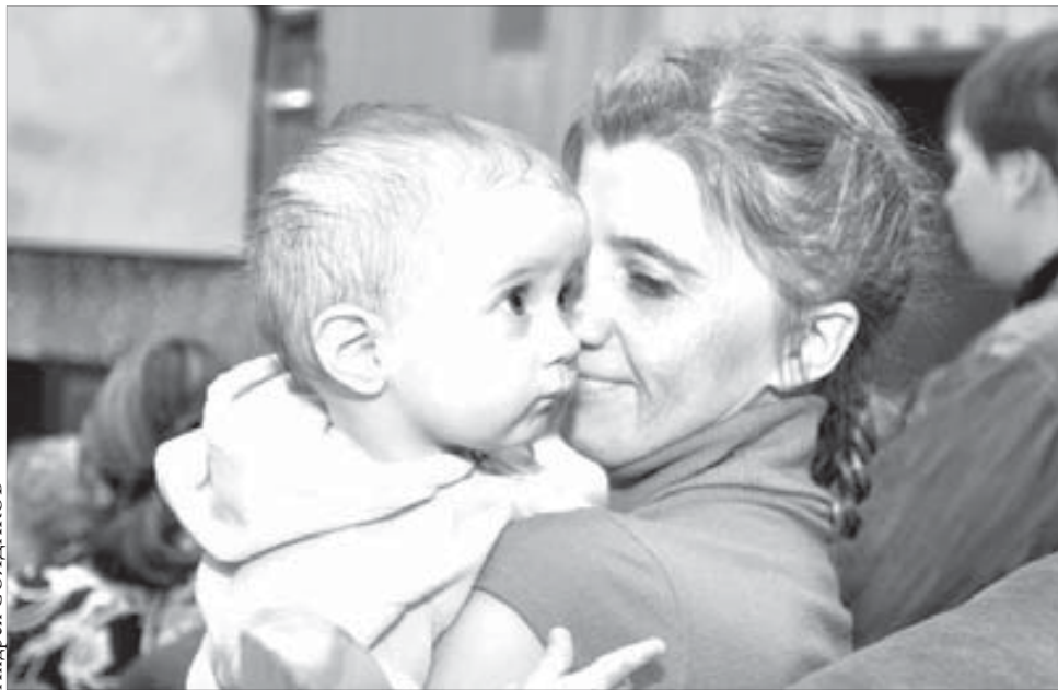
Первый раз на флешмоб

и автобусы, доставившие в ГЦК жительниц Талнаха и Кайеркана. Между ними лавировали, пробираясь к входу, мамы с детшками в колясках или на руках. В фойе центра культуры установили пеленальные столики, чтобы удобно было раздеть младенцев.