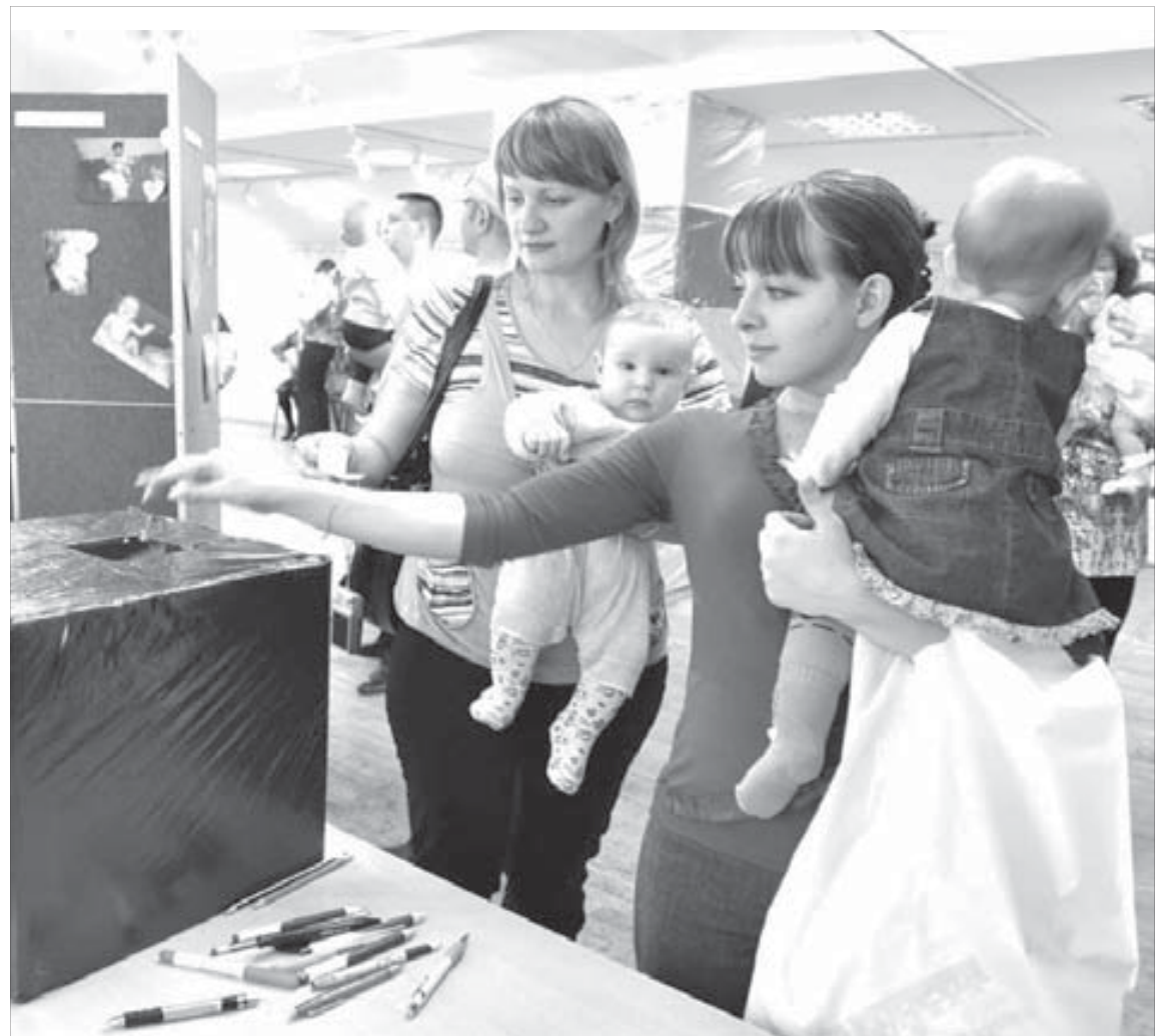
Мамы голосовали за лучшие фотографии