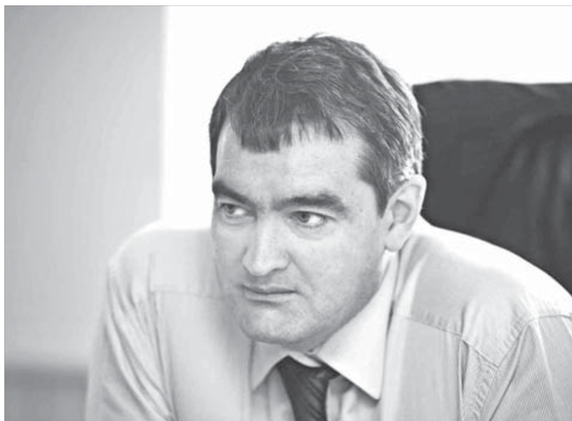
“Обеспечение безопасности – наша первоочередная задача”

– В этом году новой техникой больше не закупили. Но сейчас вводится в эксплуатацию новый комплекс очистных сооружений. Для аэропорта проходимость 600 человек в час этот вопрос насущный. Установлена новая, блочно-модульная котельная с 3-кратным резервированием взамен старых, с 50-х годов работавших пароходных котлов. Новый водозабор, фильтрационная станция – все соответствует современным требованиям очистки.