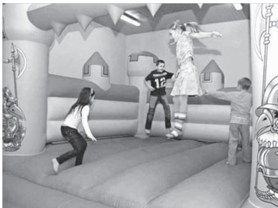
О развлечениях в игровом комплексе маленьким норильчанам скоро придется забыть