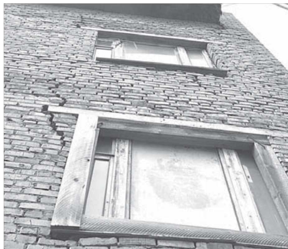
Трещина на фасаде вспомогательного корпуса по Комсомольской, 1