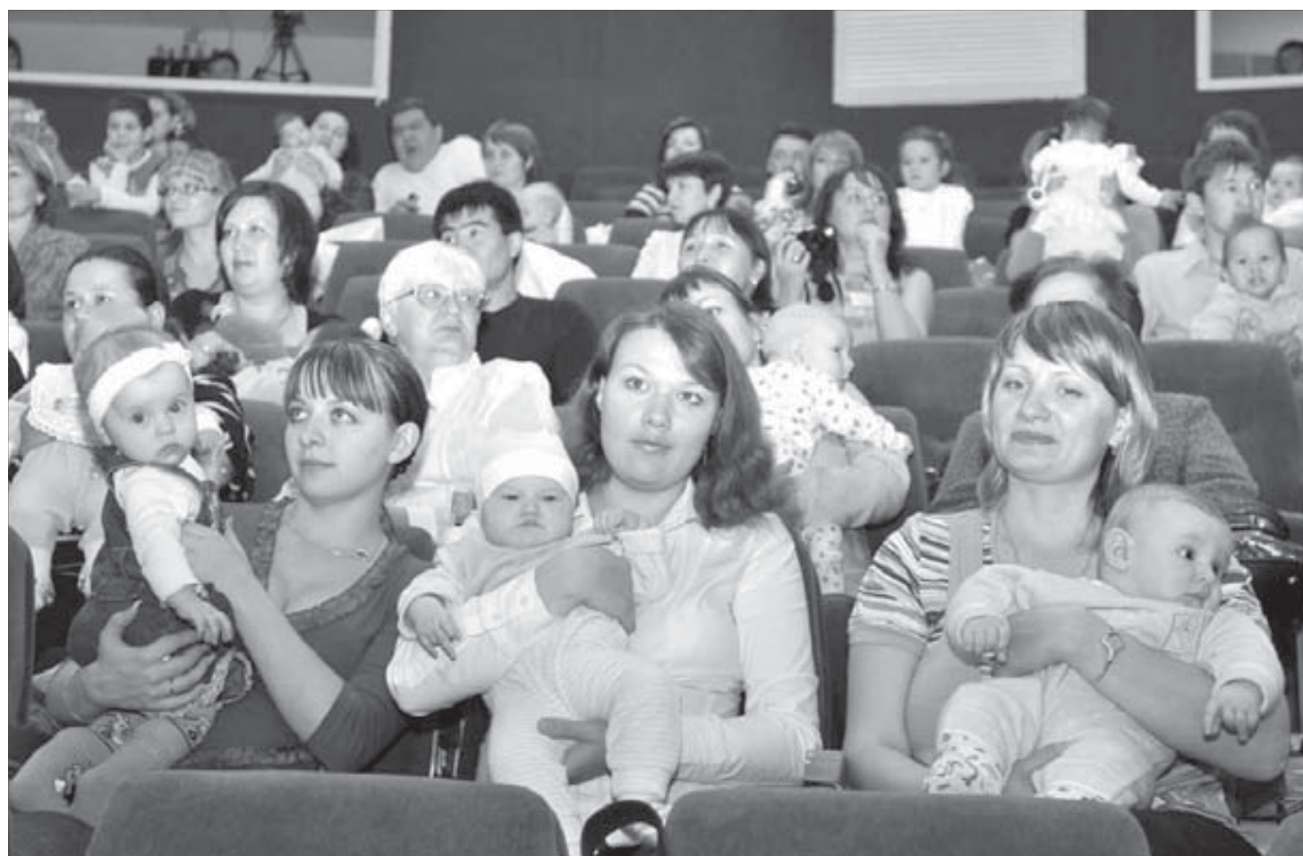
Зрительный зал ГЦК был почти полон