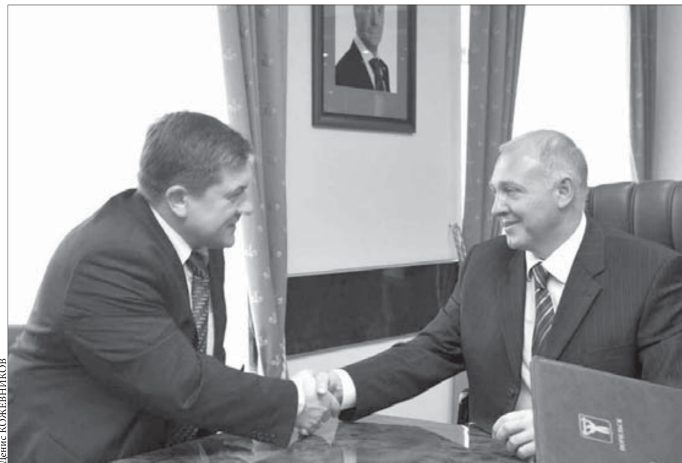
Договор скрепили рукопожатием

Вчера состоялась первая в этом сезоне сессия городского совета. Первым в повестке дня обсуждался вопрос о назначении на должность главы администрации города Норильска по итогам конкурса.