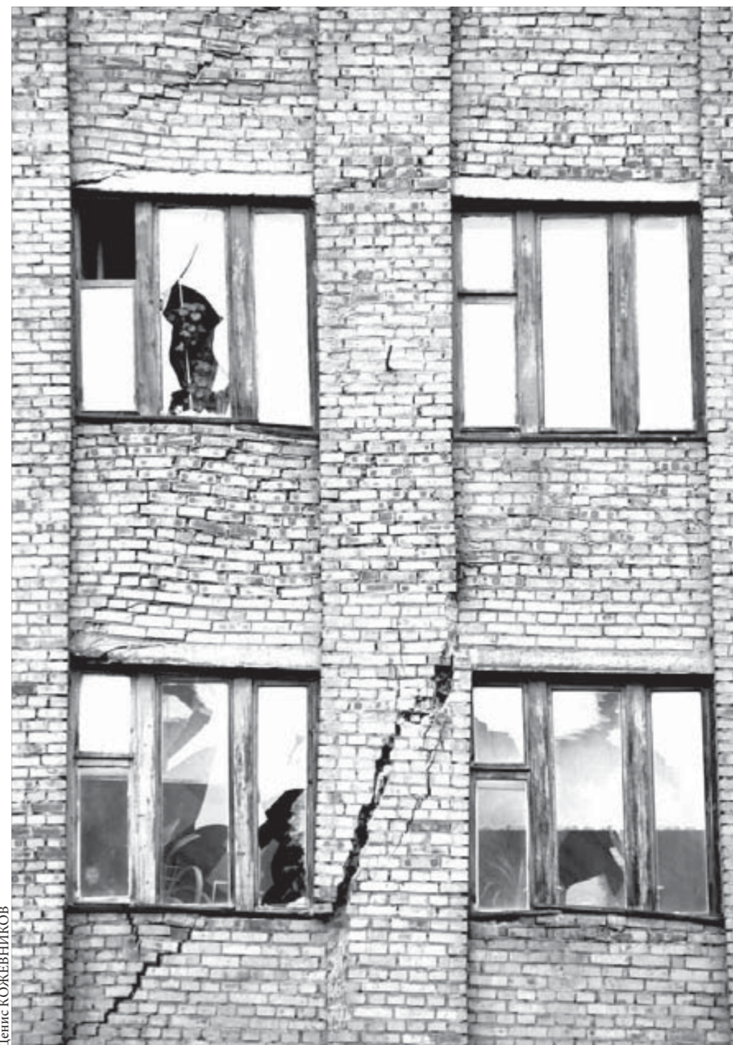
Шок — это по-нашему