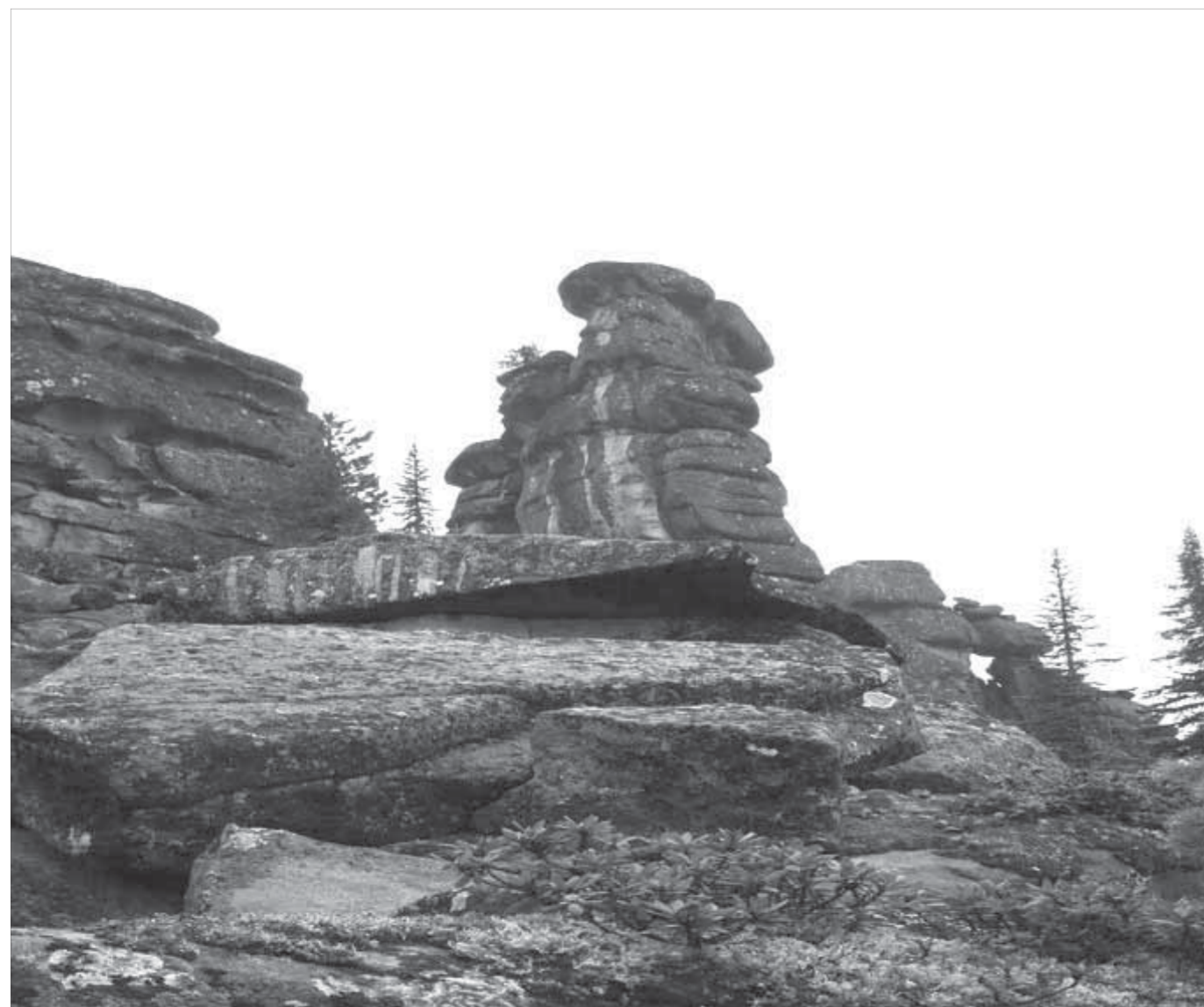
В Каменном городе

Большинство населения, живущего к западу от Урала, искренне считает, что азиатская часть страны дика и пустыня, при этом москвичи, отправляя нам разные грузы, частенько уточняют: “Норильск — это где? В Азии?” Или: “Какая у вас станция железной дороги?”