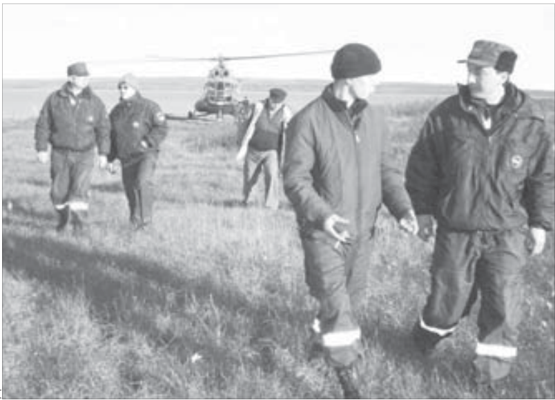
Спасатели обследовали каждый километр предполагаемого маршрута катера