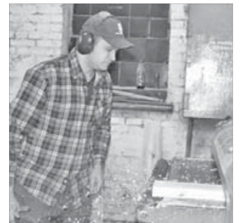
В модельном цехе шумно

Если возникают какие-то проблемы, решаем их сообща. Бывает модель трудная,