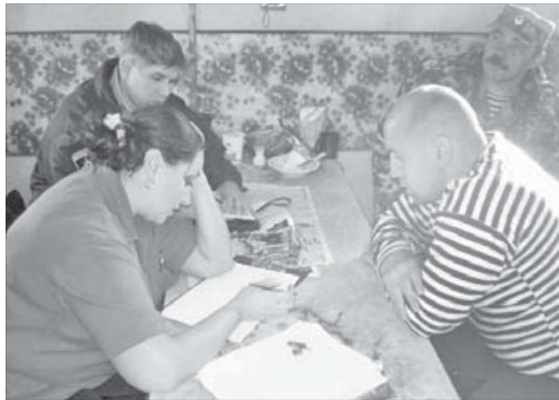
Комиссия выяснит, почему катер вышел в шторм