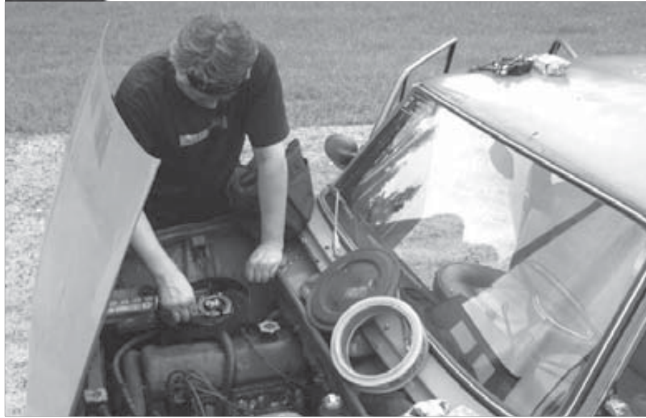
Поломки в дороге встречаются. Хорошо, если можно их быстро исправить

Если бы старенькая “копейка” – ВАЗ-21011, выручавшая меня в отпусках не первый год, не сломалась нынешним летом, едва отъехав от гаража, эти заметки об опыте аренды легкового автомобиля на материке вряд ли были бы написаны. Но случилось то, что случилось. Под капотом часто затарахтело, а на приборной панели зажглась красная лампочка давления масла. Съехал на обочину и заглянул под капот. Выводы были огорчительны.