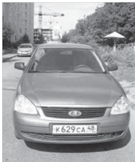
Флагман «АвтоВАЗа» – «Приора» – хорошего впечатления не произвела

Если за сорок лет отечественный автопром эволюционировал от «копейки» до «Приоры», то гордиться российским автоконструкторам совершенно нечем. От машины я, мягко говоря, не в восторге. Отвратительное качество внутренней отделки, дребезжащий дешевый пластик, в салоне множество непродуманного и попросту глупого. Например, в отсеке для очков над зеркалом заднего вида в салоне очки стандартных размеров просто не входят. И такое пренебрежение к водителю видишь во всем. Электростеклоподъемники у «Приоры» срабатывают через раз, а электрический привод регулировки действует только на зеркале со стороны пассажира. Освещение в салоне не работает. Взял бы я ее, если бы имел время для тщательного осмотра? Думаю, да. Ведь выбора за эту цену нет.