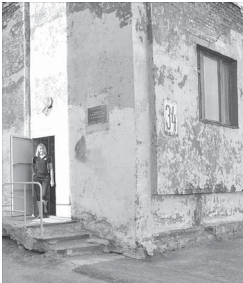
Детсад покрасят следующим летом