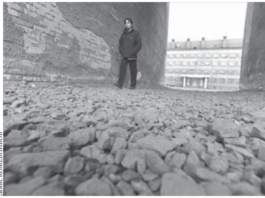
Щебень – не помеха школьникам