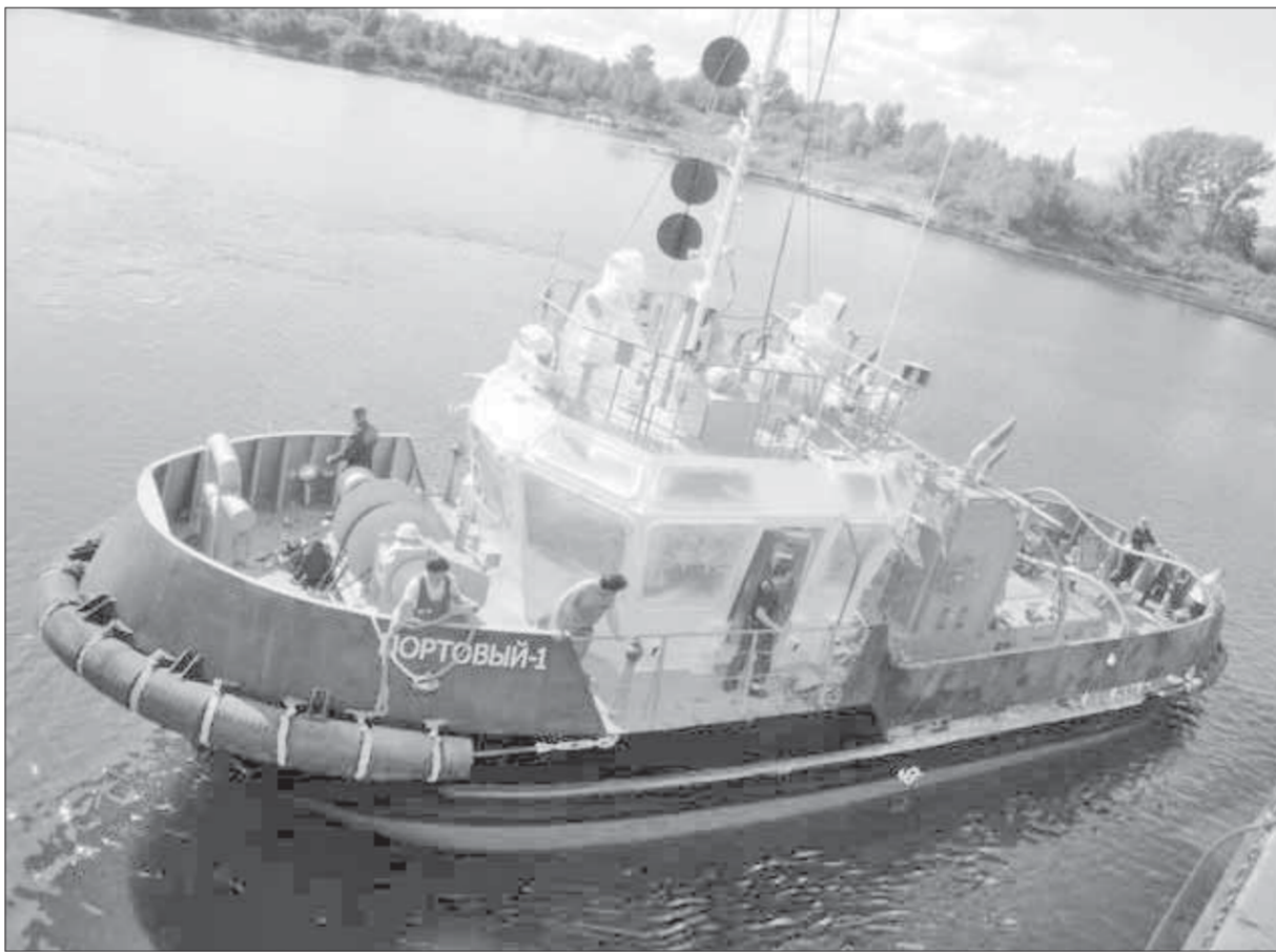
Ледокольный буксир нового поколения пополнил речной флот «Норильска»

В последние годы для речных перевозок, как правило, строят самоходные сухогрузные и нефтеналивные суда, а также самоходные баржи. При этом существующий флот речных буксиров и толкачей продолжает неуклонно стареть. На начало 2008 года количество таких судов с классом Российского речного регистра возрастало до 10 лет составляло всего 55 единиц, от 10 до