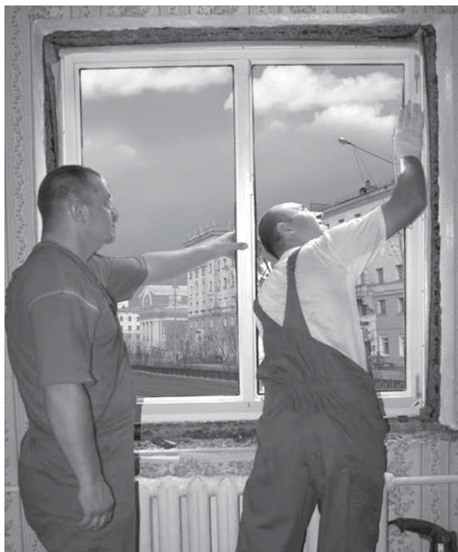
Дело мастера боится

Ремонтировать квартиру я вовсе не собиралась, мне нужны были только новые окна, о чем, кстати, предупреждала сотрудников выбранной фирмы. А вот они меня не предупредили о масштабах разрушений. По-хорошему, мне нужно было вынести всю мебель, укутать стены и снять потолок. Теперь я смотрю на порванные обои, которые кое-как приклеили на место, и понимаю, что надо искать ремонтников.