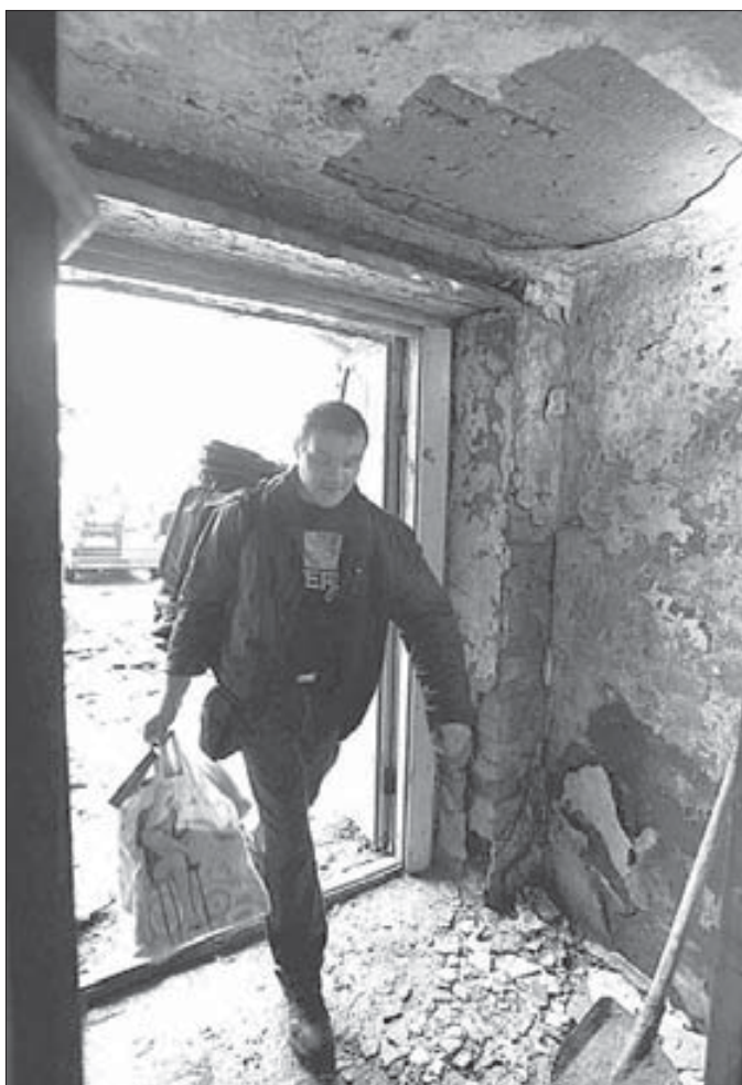
Дождь иногда продолжается и в подвале