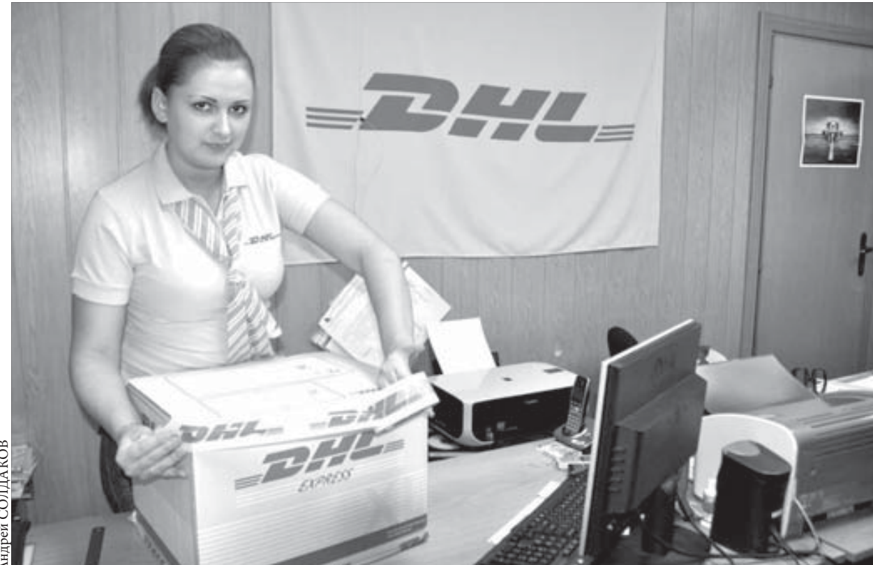
Фирма гарантирует: груз придет быстро