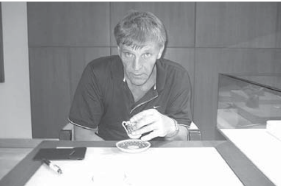
Прошло всего каких-то 30–40 лет...

В отделе кадров комбината, слегка пожурился за опоздание, мне объяснили, как проехать в Талнах. На бланке направления была обозначена таинственная для меня аббревиатура «ГРУ». «Главное разведывательное управление», — решил я. — Все правильно, в моем дипломе записана специальность «поиски и разведка...», так куда же еще меня послать, как не в ГРУ?..