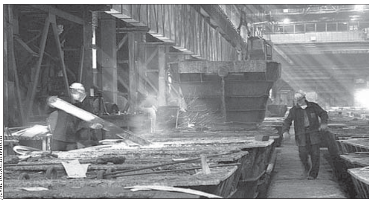
Это будни, праздник впереди

Корпоративный проект "Женский взгляд" Норильского никеля" делает "Шаг навстречу" коллективу Надеждинского металлургического завода им. Б.И. Колесникова, который в октябре отметит 30-летний юбилей. Вечер-встреча состоится в пятницу, в большом зале Городского центра культуры.