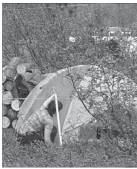
Палатка должна стоять правильно

На занятиях опытные туристы расскажут о пешеходных, водных и лыжных походах, научат и некоторым приемам альпинизма. Особое место в обучении отведено изучению основ безопасности в тундре, оказанию первой помощи. Кстати, в походах новичков обеспечивают спальными мешками и палатками.