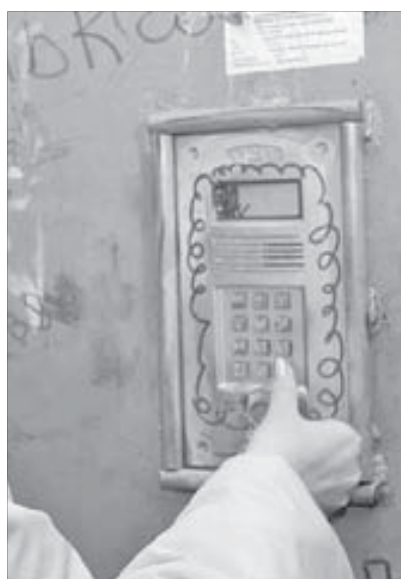
А я к вам

Всем известно, с какими неприятностями сталкиваются жильцы тех домов, которые находятся рядом с рынком или местами проведения городских массовых мероприятий. А уж если рядом летнее кафе... Вечером, после чрезмерного употребления горячительных напитков, люди идут в ближайший подъезд справить свои естественные потребности.