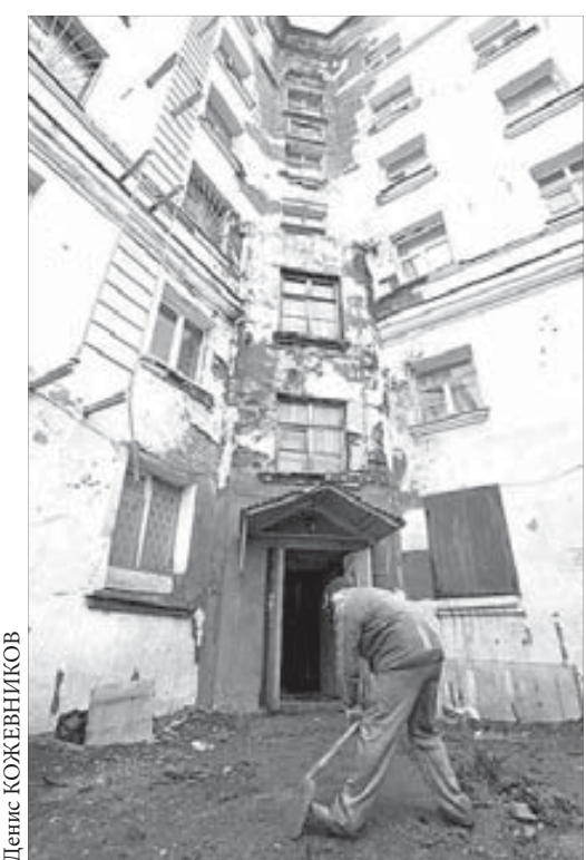
В мокрый подьезд страшно войти

Что бы там ни говорили, а это — хороший результат. Да, остались подьезды и квартиры, где трубы дали течь. Но это происходит ежедневно, и лишь в исключительных, аварийных случаях тепла нет и после того, как лег снег и