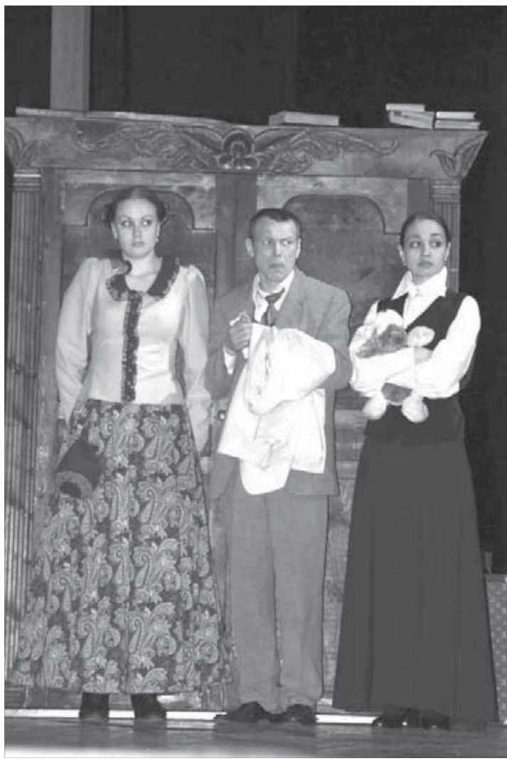
Мизансцена на фоне «многоуважаемого»...