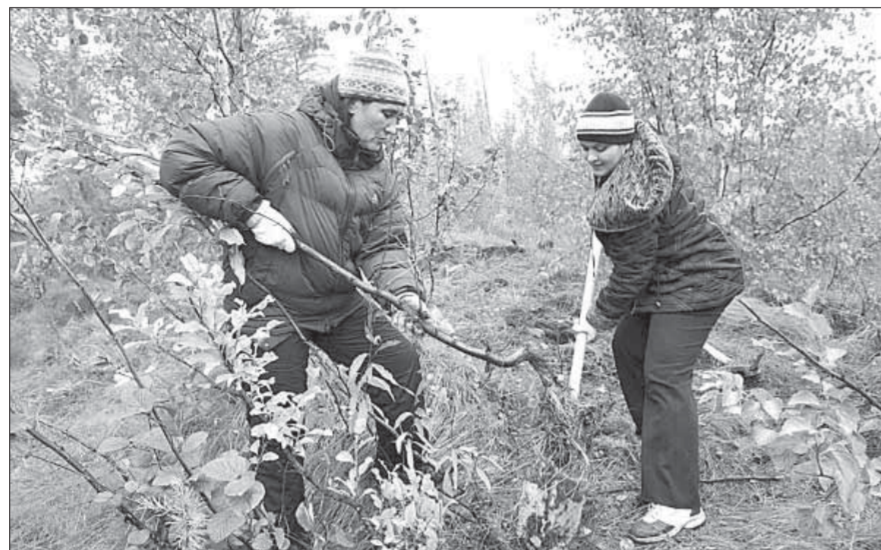
Выкапывают по инструкции НИИСХ Крайнего Севера