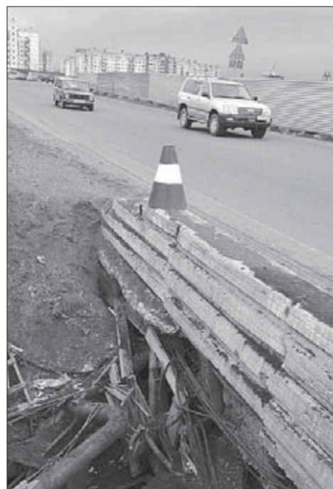
Закрытие «зрело» давно

Но даже до получения технического заключения «Красмостпроект» работы по строительству двух новых мостов шли полным ходом. К настоящему моменту частично проложены балки и опоры мостов. Продолжение работ Заполярным филиалом компании «Норильский никель» планируется после решения некоторых технических и организационных вопросов. Норильчане смогут увидеть новые сооружения в будущем году.