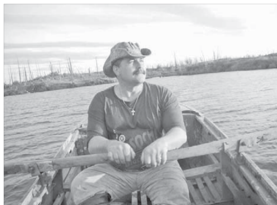
Влюблен в северную природу...

— В средства массовой информации за помощью обращалась не раз, и всегда получала от журналистов поддержку. Гласность — великая сила, я в этом убедилась на личном опыте. А минувшей зимой нас — работников "Дома торговли" — очень выручили журналисты "Заполярного вестника". В самые холода были разморожены отопительные системы магазина. Покупатели перестали приходить к нам. Продавцы мерзли, кутались на рабочих местах в шали и шубы. Коммунальная организация не торопилась устранить последнюю аварию. И только после публикации в газете дело сдвинулось. Теплоснабжение было восстановлено быстро. И история закончилась ко всеобщему удовлетворению.