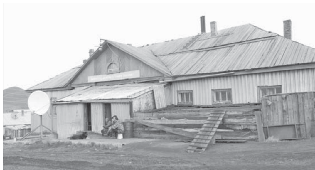
В школе летом сделали косметический ремонт