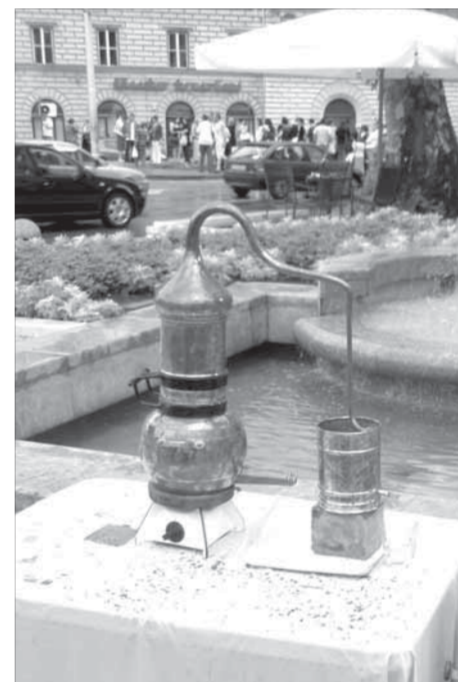
Это не экспонат!

вой отдельно: вермишель и два вида бульона. Пожалуйста, бери, смешивай и делай себе суп. А все остальное было в достатке: на завтрак — молоко, мюсли, йогурты, фрукты, творог, орехи, сыры, натуральный кофе, на ужин — печеные рыба и картофель, салаты, зелень, овощи, фрукты, пирожные нескольких видов. Только вечером чай и кофе приходилось ... покупать за деньги. Одна кружка стоила чуть более семидесяти рублей.