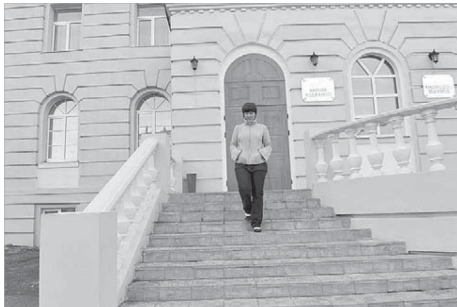
По лестнице приятно пройти...