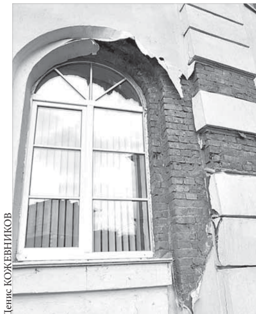
... на окна жалко смотреть

Зато ребятам из пятой гимназии приятно смотреть на бело-розовое здание напротив.