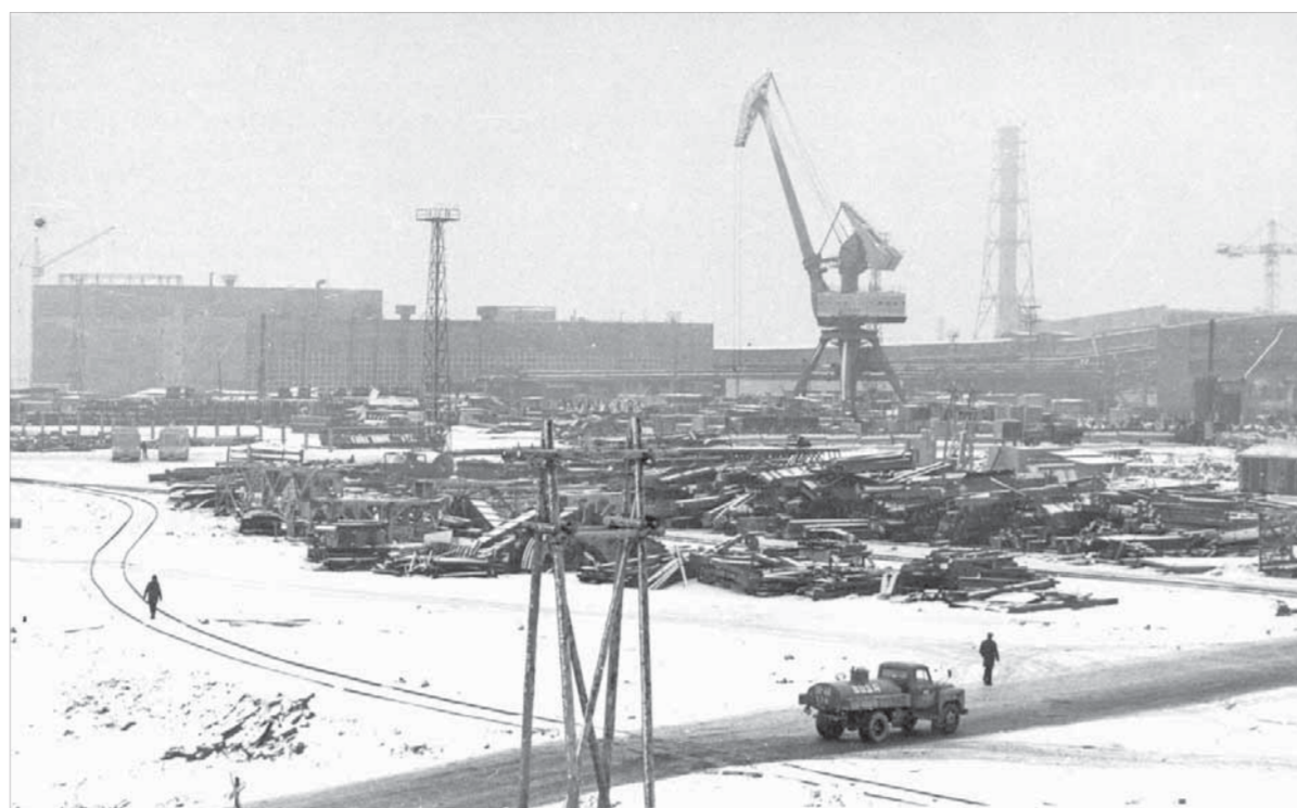
Оборудование для "Надежды" поставляли 14 стран мира