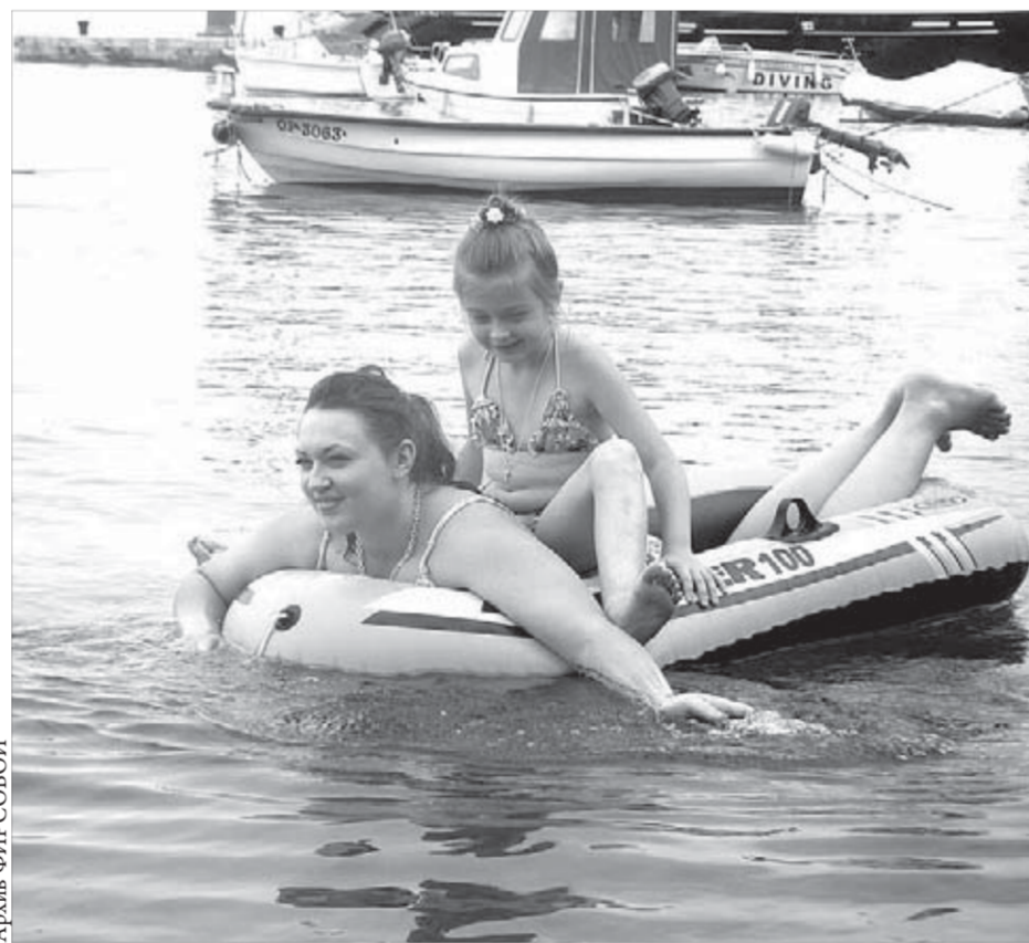
Это не яхта, но тоже здорово