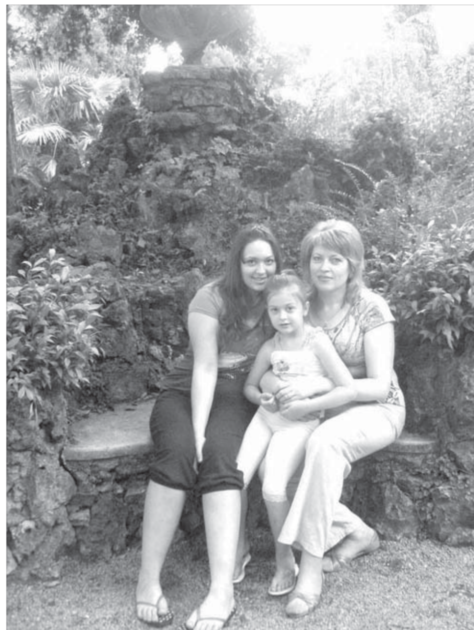
В Хорватию полетели втроем