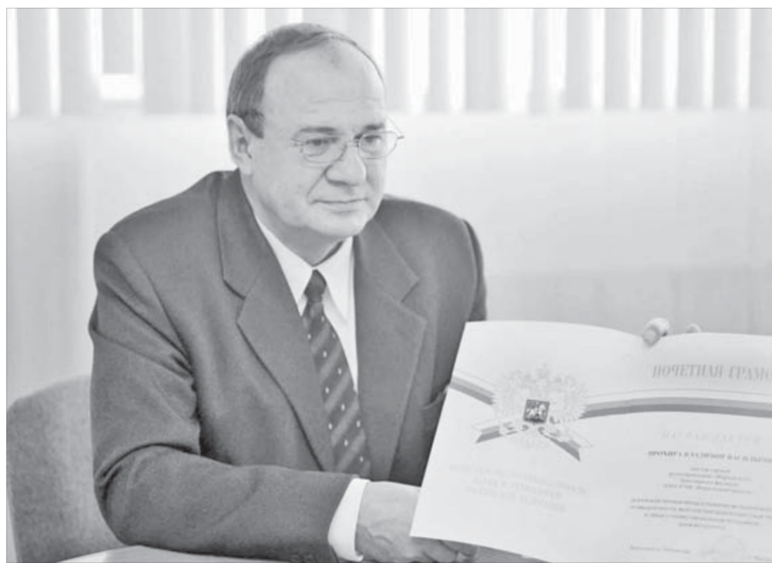
«Награды — это хорошо, но я не один в поле»