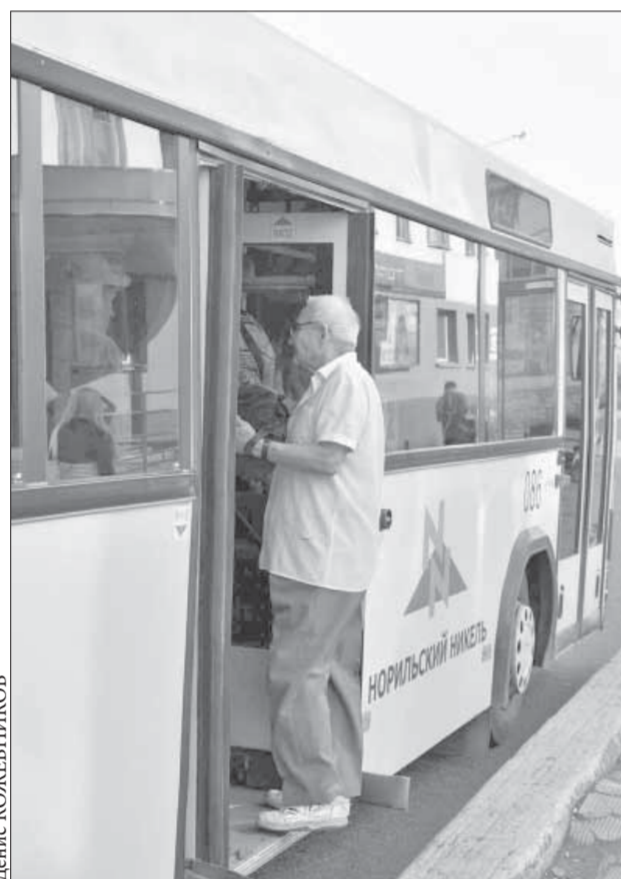
Осторожно, двери закрываются

Как уже сообщал "Заполярный вестник", с 5 сентября меняется схема движения автобусных муниципальных маршрутов.