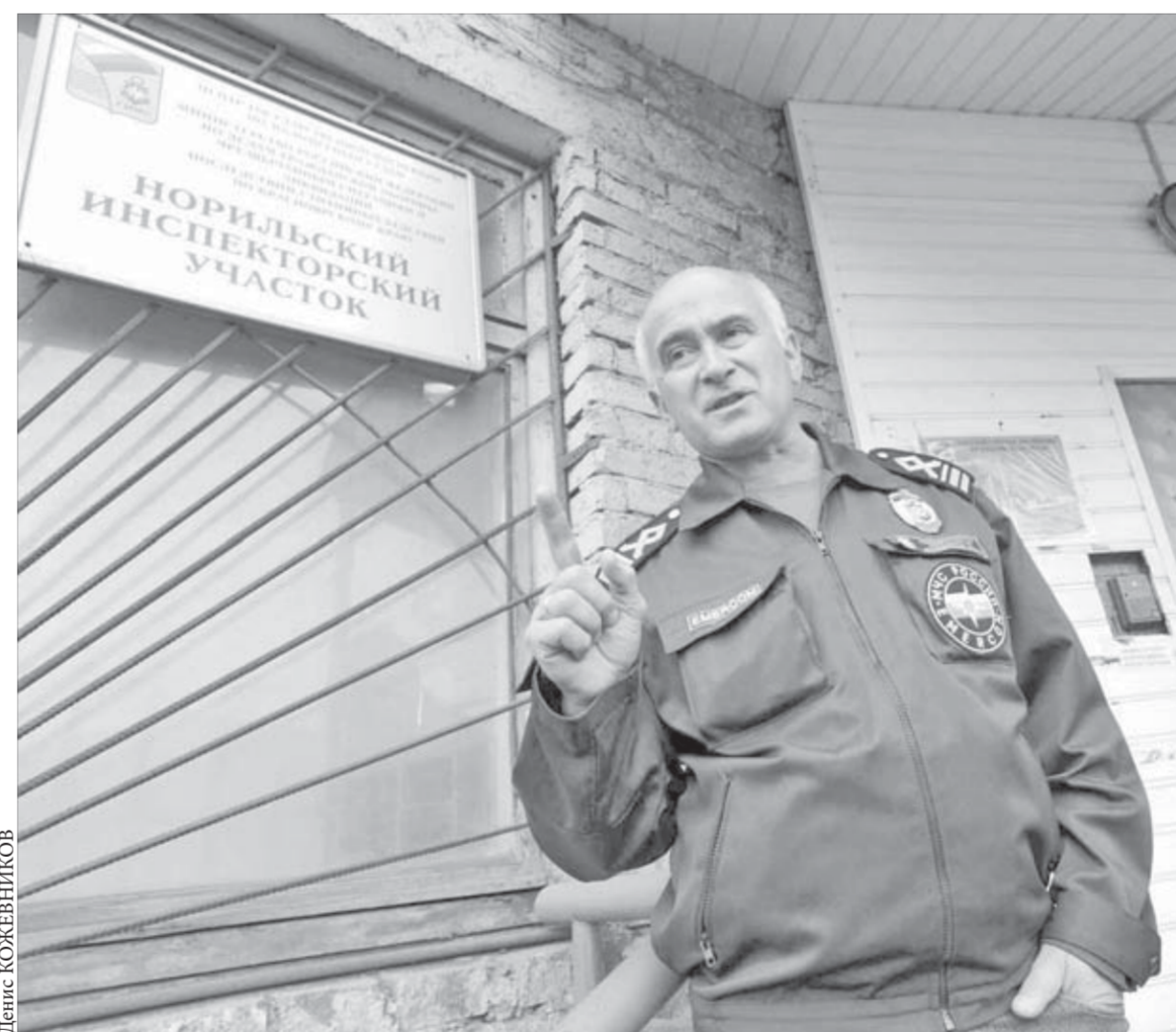
Сколько воды утечет, пока укомплектуют штат?

Бригады ФМБА России круглосуточно дежурили непосредственно на месте аварии, а также в ДК Черемушек и в саяногорской больнице, куда отвозили пострадавших с травмами и переохлаждением. Помощь медиков и психологов требовалась и там, где собирались родственники погибших или пропавших без вести.