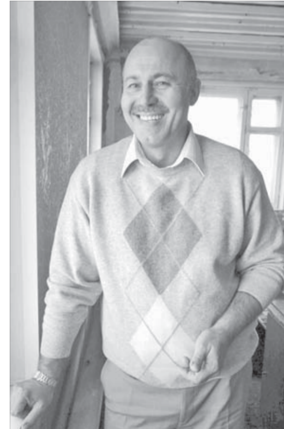
Донов не бахвалится – он гордится