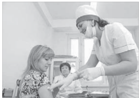
На прививку становись!

По данным статистики, ущерб от гриппа в России в среднем составляет примерно 10,2 миллиарда рублей, что соответствует 75–86 процентам от всех инфекционных заболеваний.