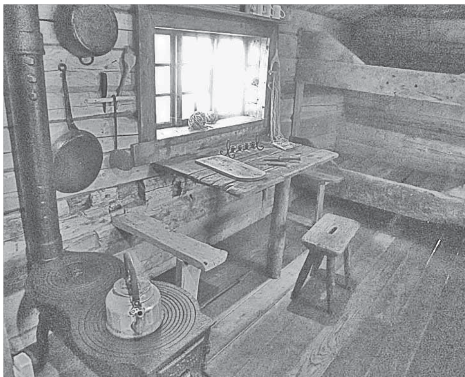
Глубокая норвежская история

Полярный круг в Норвегии – это еще одна приманка для туристов. Посреди суровых северных пейзажей, очень похожих на наши лайды между Кайерканом и Алыкелем, прямо у федеральной трассы выстроено монументальное здание. В нем – стандартный набор: кафе, магазины сувениров, кинозал для просмотра фильмов о Норвегии. Сам Полярный круг обозначен на асфальте – не ошибешься. Здесь же за 15 евро можно купить сертификат, в котором указано, что имярек такого-то числа такого-то года переступил сей Полярный круг. Осталось только от руки написать имя и дату.