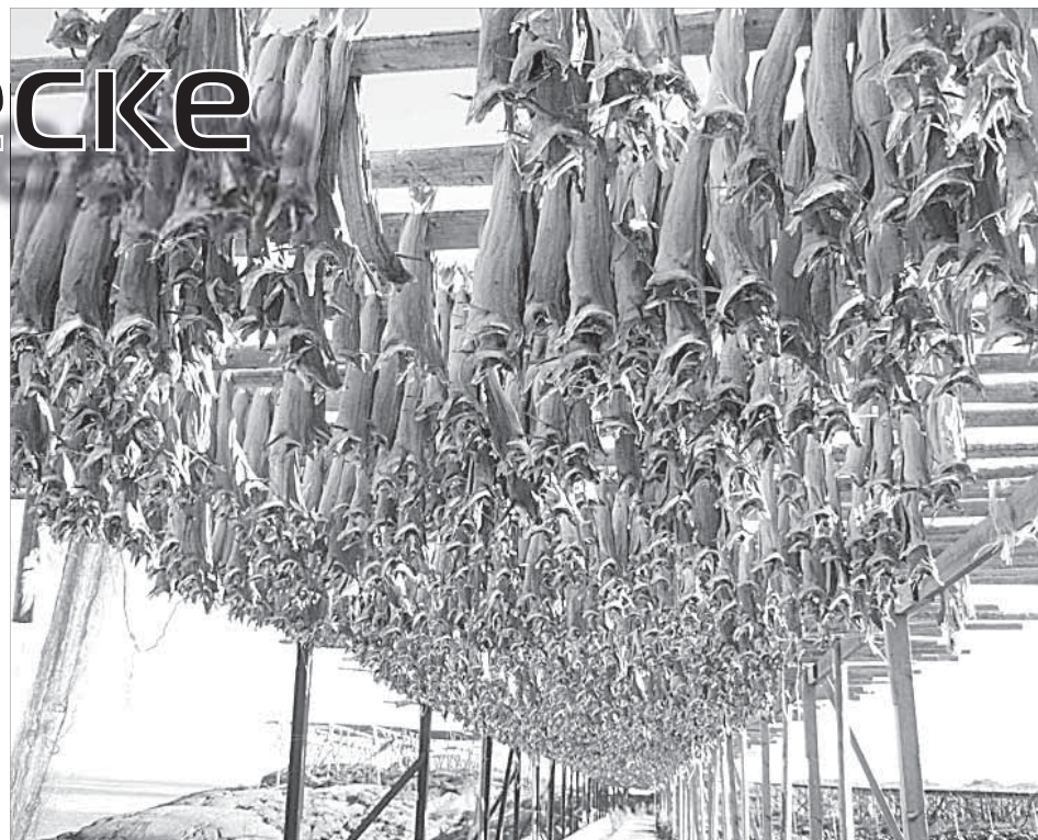
Километры сушеной трески

Отступление по теме. По различным статистическим данным норвежцы в последнее время являются одними из самых богатых жителей планеты (в пересчете на душу населения, которого в стране всего четыре с половиной миллиона человек). Известен другой показатель, который действительно вызывает у меня зависть: норвежцы являются самыми главными долгожителями в мире (японцы – на втором месте). Средняя продолжительность жизни – 84 года. Причем не дряхлого прозябания в старости, а полноценной жизни!