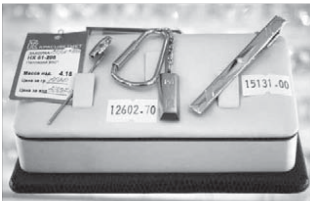
Для мужчин выбор скромнее

Платину и палладий ювелиры называют металлами будущего. А норильчанкам сам бог велел носить украшения из этих металлов – наши красавицы буквально ходят по земле, богатой залежами Pd и Pt. К тому же носить их патриотично: компания “Норильский никель” является крупнейшим в мире производителем белых металлов. “Заполярный вестник” выяснил: платиновые и палладиевые изделия в последнее время влет уходят с прилавков норильских ювелирных магазинов. Продавцы даже не успевают делать новые заказы.