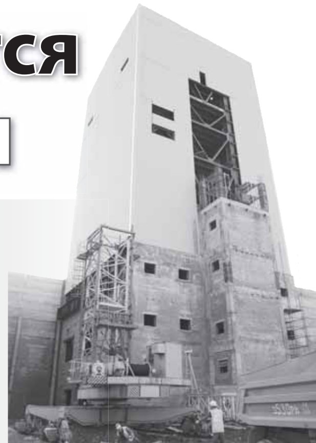
Строуправлению и сейчас работы хватает

Рудники начинаются с поверхности. Именно первостроители старейшего подразделения СУ “Талнахрудстрой” положили начало истории Талнаха. Приказ о его создании, подписанный Владимиром Долгих в 1962 году, дал жизнь не только рудникам правобережья, но и тресту “Норильскшахстрой”, куда позднее вошло управление.