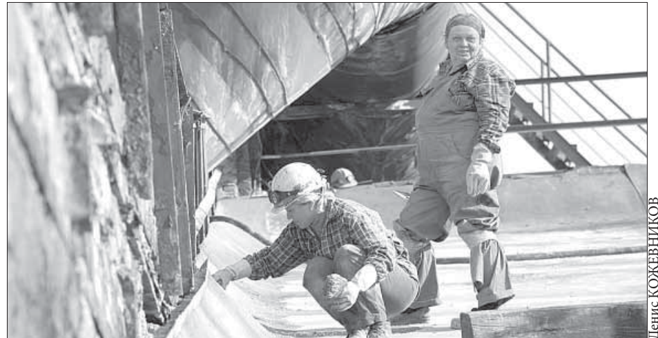
«Делаем на совесть. На плавильщиков капать не будет»