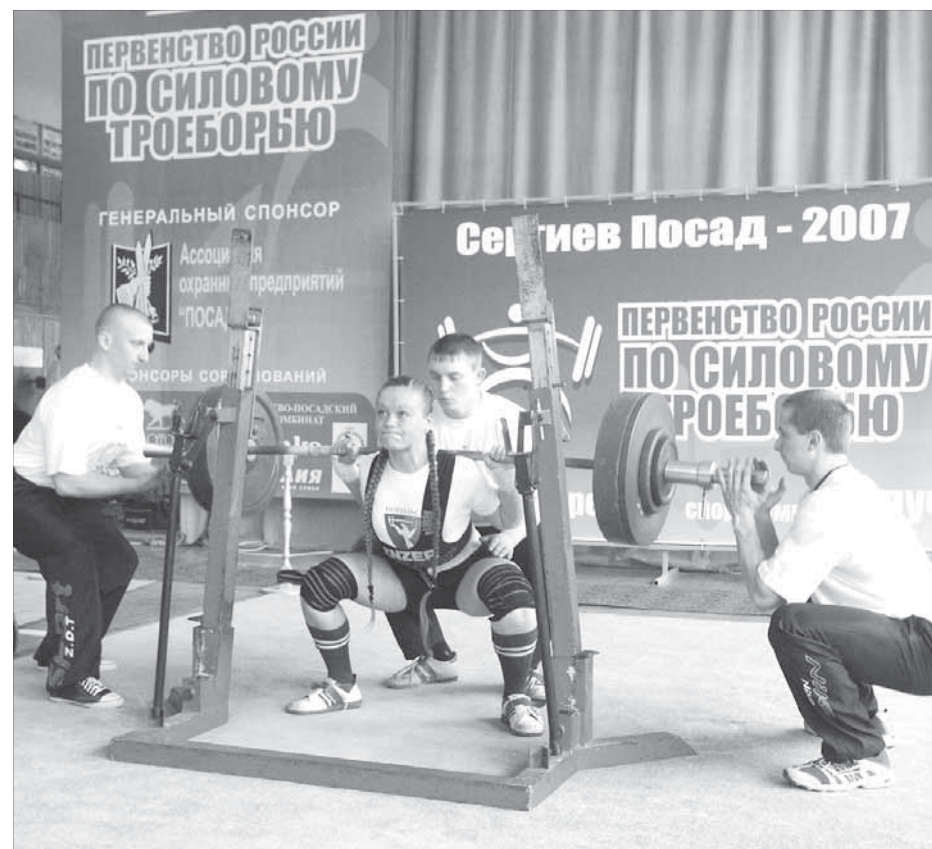
Приседание со штангой – одно из трех упражнений в пауэрлифтинге, по которым проводятся соревнования