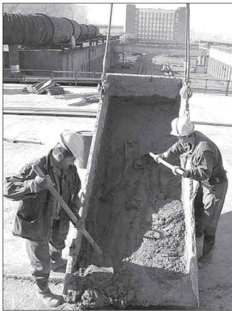
Ясные дни – союзники строителей

Производственное объединение «Норильскремонт», входящее в ООО «Норильскникельремонт», – предприятие, как следует из названия, ремонтное. Но День строителя здесь считают одним из своих главных профессиональных праздников.