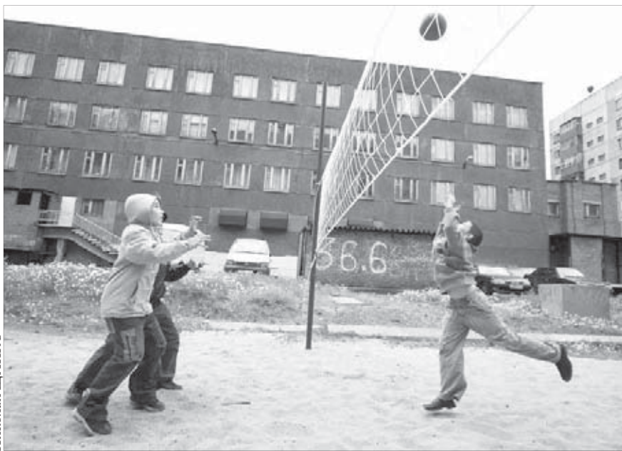
И до чемпионата дорастем!