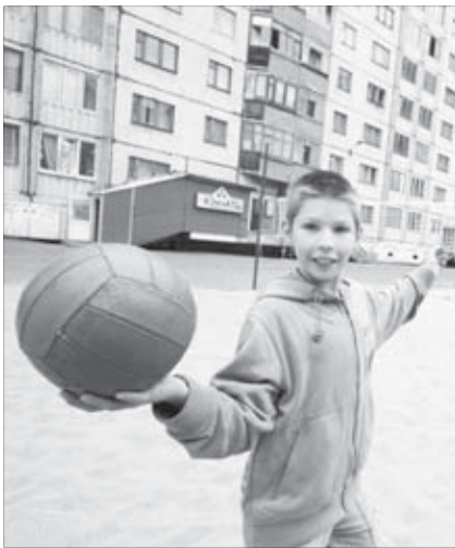
Есть, чем заняться во дворе