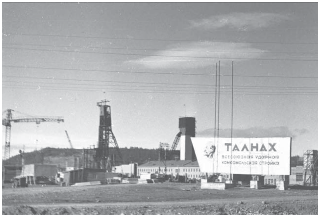
Талнах строился “золотым фондом” “Талнахрудстроа”

Впрочем, в “Талнахрудстрое” не только взрывают, но и прекрасно строят. Пусть времена возведения целого города позади, но и сегодня строительное управление способно на многое. Легко сумеют возвести здание любой сложности, начиная с фундамента и заканчивая чистовой отделкой.