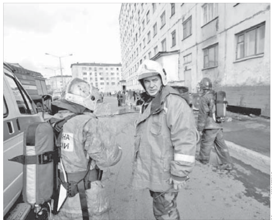
Возгорание локализовали. Последствия устраняют

по Красноярской (№6а и 8), а также дома №1, 3, 5 и 11 по Молодежному проспекту. По информации “ЗАО “Норильск-Телеком”, работы по восстановлению планируется закончить до 20 августа.