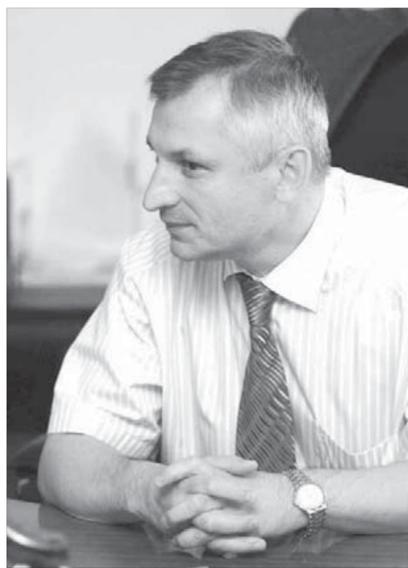
Не суровый. Требовательный