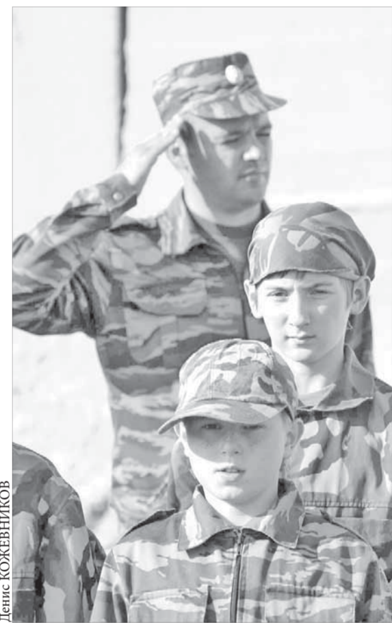
“Под знамя, смирно!”