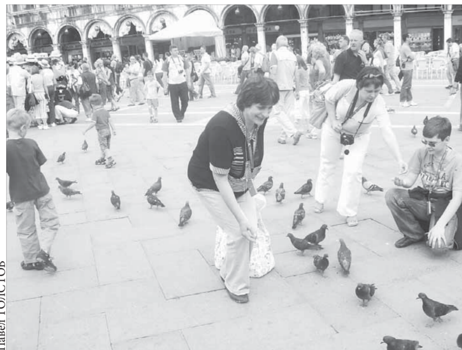
Мы и голуби на площади Сан-Марко

Курс акций ОАО “ГМК “Норильский никель” – 3424,9 рубля. ОАО “Полос Золото” – 1311 рублей.