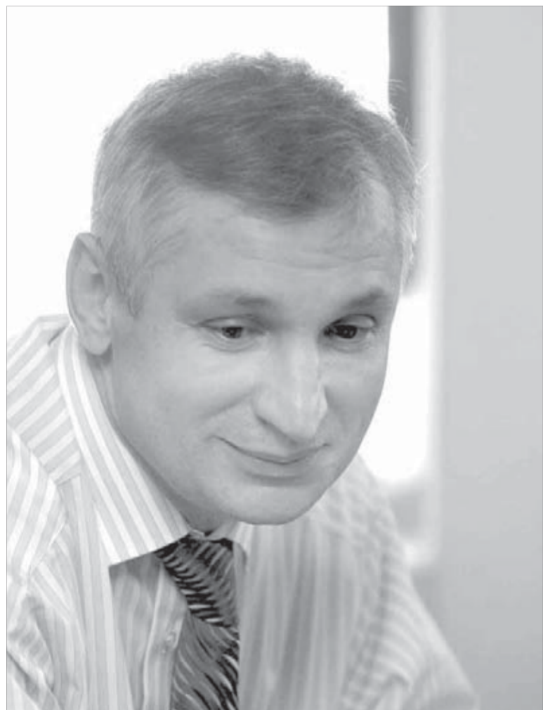
Нам скоро “стукнет” тридцать...