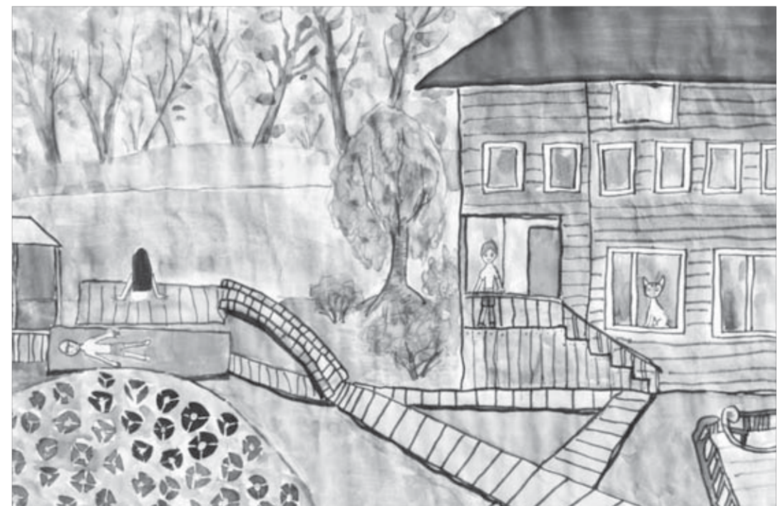
Дарья Ильичева, 13 лет. Самый лучший день на турбазе