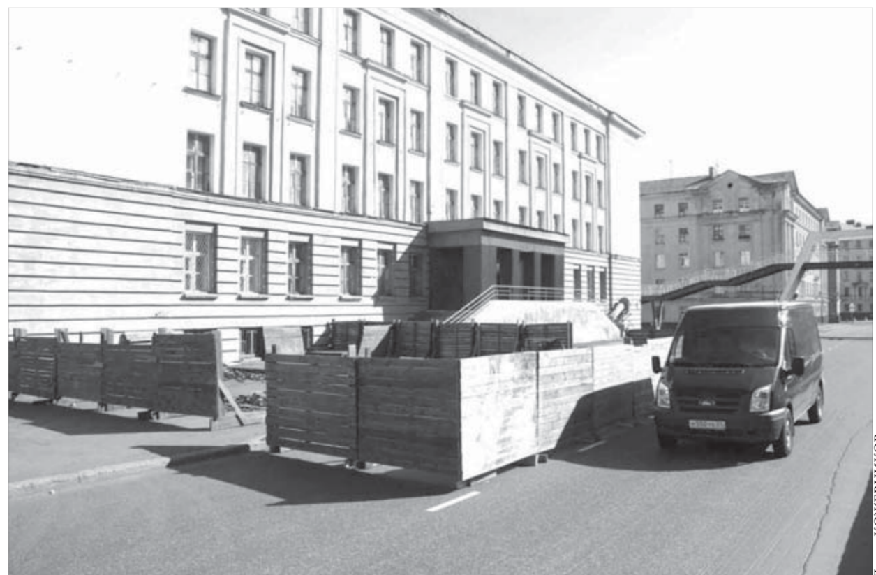
...а для автомобилистов – временные неудобства

На ремонт вводного коллектора, по его словам, выделено ровно два месяца – с 30 июля по 30 сентября.