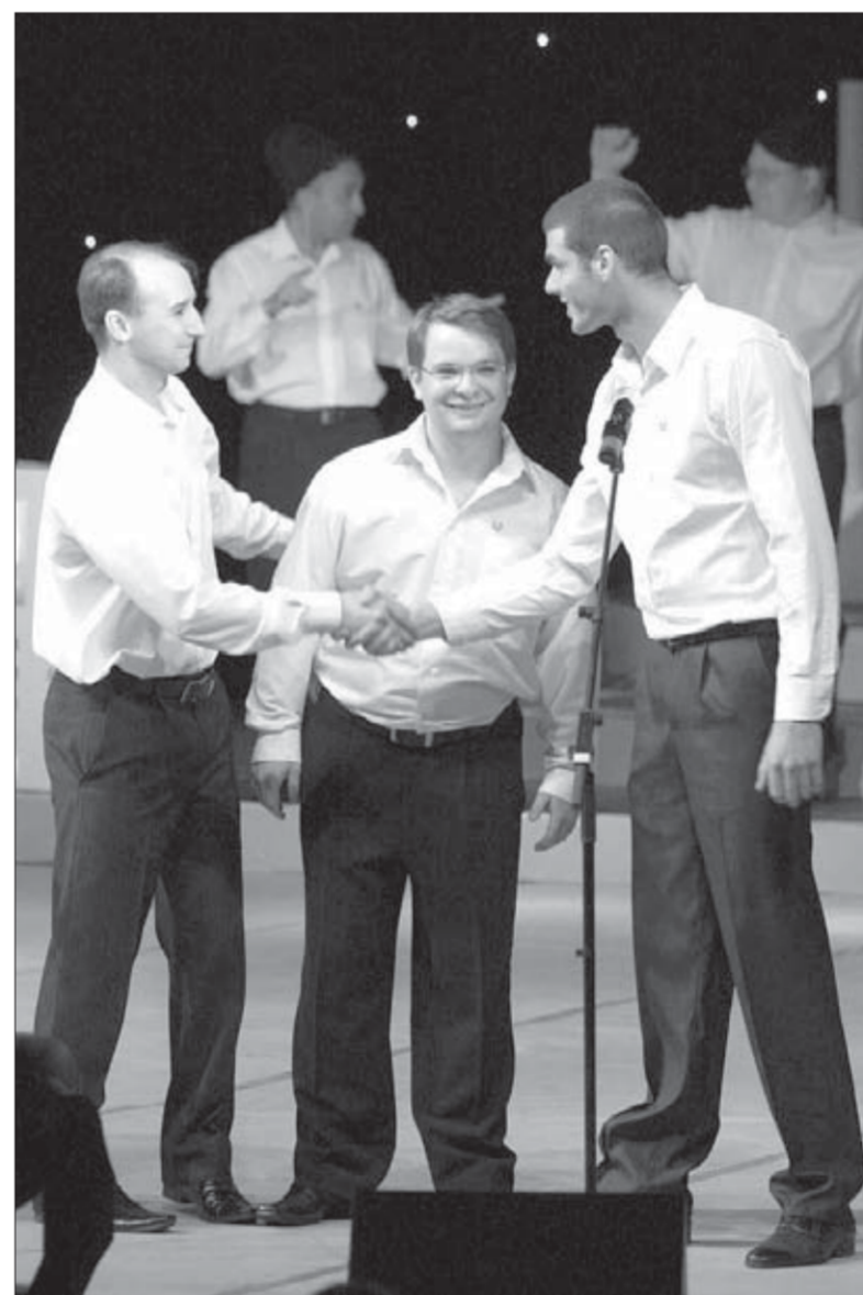
"Мы пишем историю" – символическое название