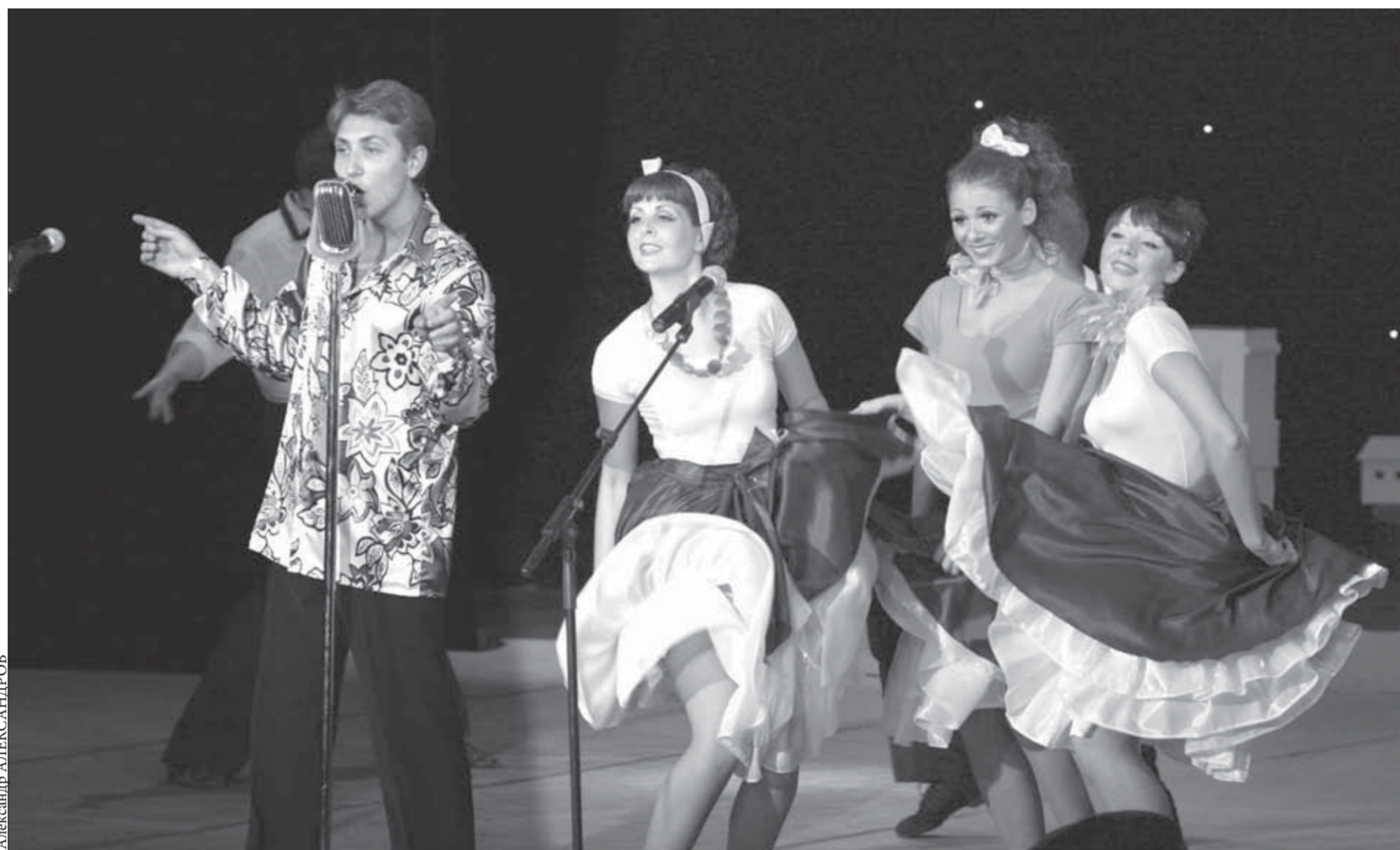
Молодые специалисты "Норильского никеля" талантливы во всем

За шесть месяцев в регионе выпущено 1999 тонн сладкого продукта, тогда как за тот же период год назад – 2770 тонн. Причем до мая 2009 года производство мороженого в крае росло с января по апрель примерно на два процента в месяц. Тем не менее Красноярский край сохраняет пятое место по выпуску мороженого среди регионов Сибирского федерального округа. Лидируют Омская область (23 тысячи тонн), Новосибирская область (15 тысяч тонн), Алтайский край (5,6 тысячи тонн) и Кемеровская область (4,1 тысячи тонн).