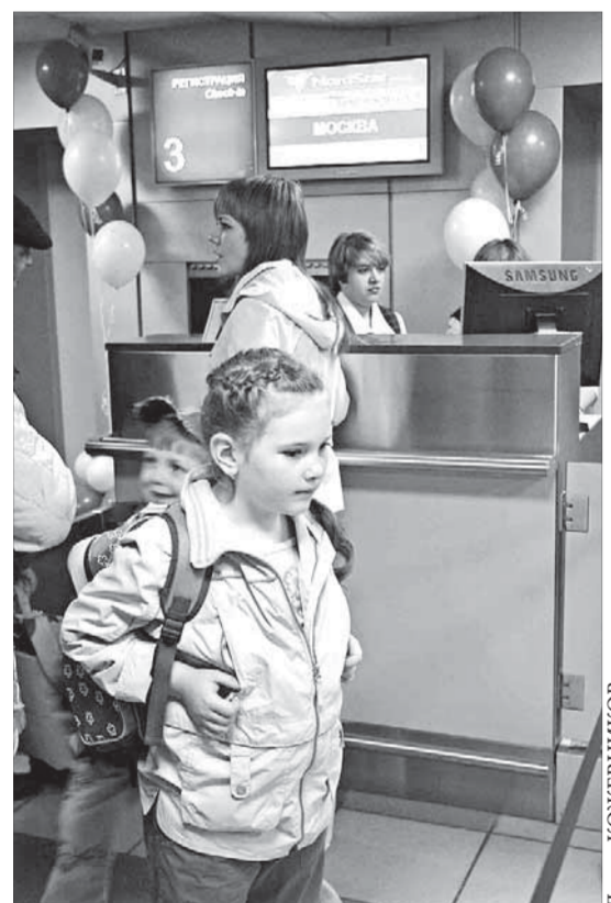
К отпуску готовы

“В Положении об оплате дороги, опубликованном в “Заполярном вестнике”, сказано, что на тех работников ЗФ, кто имеет оплачиваемую дорогу и успел приобрести билеты до 1 июня, не распространяется обязательное условие лететь в отпуск авиакомпанией NordStar. Однако в отделе по персоналу мне сказали, чтобы я сдал билет и покупал на новую компанию. Кто мне в таком случае возместит потери, которые я понесу при сдаче авиабилета?” Для работников Заполярного филиала, которые приобрели проездные билеты других авиакомпаний-перевозчиков (хотя бы в одном из направлений) заранее – до 1 июня 2009 года, оплата авиабилетов в направлениях Норильск – Москва (Красноярск) и обратно будет производиться без предоставления отрывного талона справки со штампом-валидатором ТАВС об отсутствии билетов на эту дату ОАО “Авиакомпания “Таймир”. Поэтому в вашем случае заранее приобретенные авиабилеты сдавать не нужно.