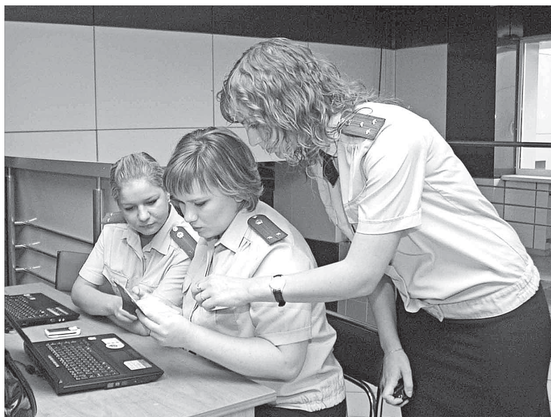
Судебные приставы проверили тринадцать рейсов