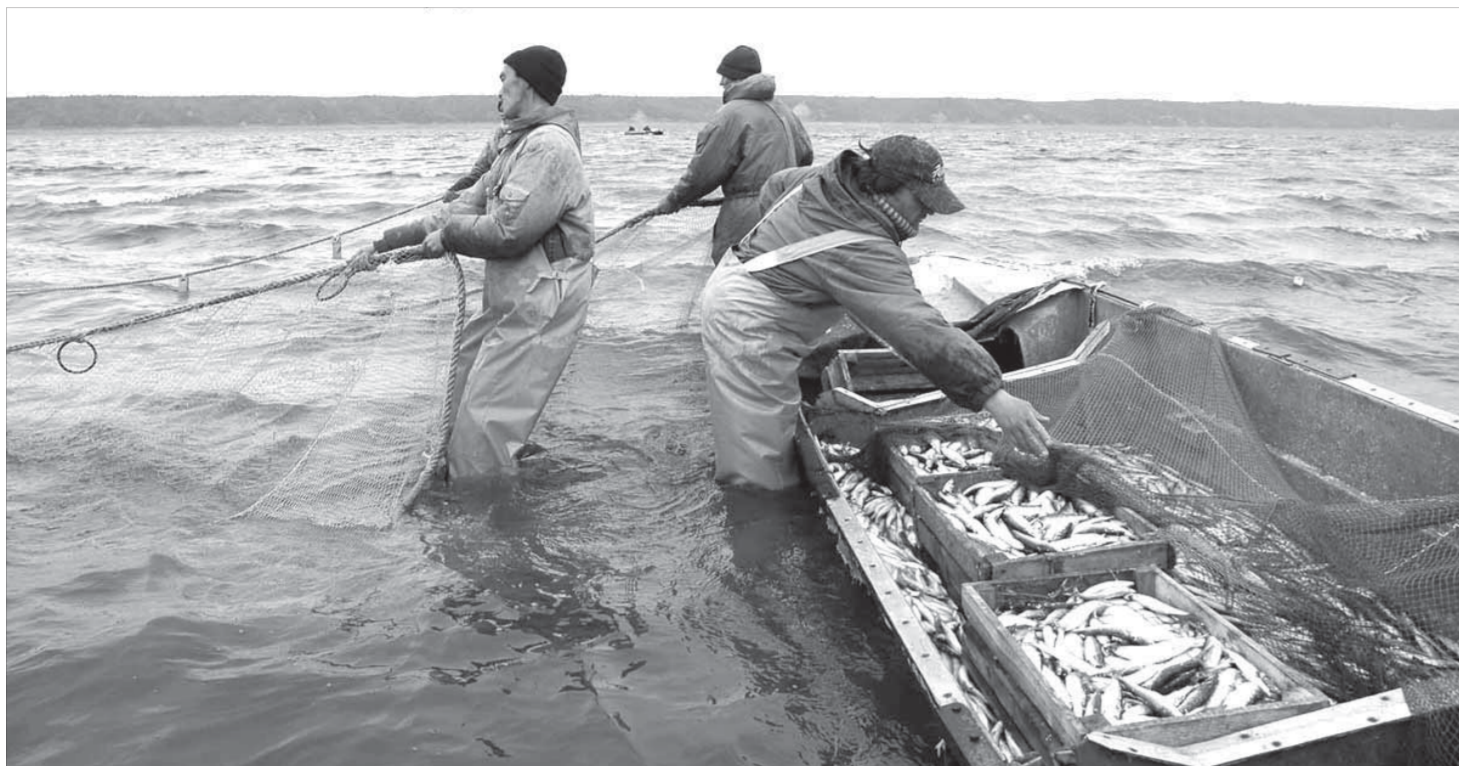
Артели берут количеством выловленной рыбы