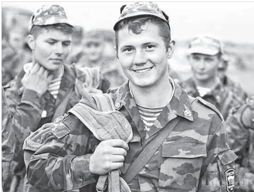
Видят смысл в завтрашнем дне

В ходе реформы военного образования происходит кардинальная реорганизация института сержантов. Упразднены должности прапорщиков, которых и заменит сержантский состав. Если ранее сержантские должности занимали срочники, а качественная подготовка и рядового, и сержанта одного призыва почти ничем не отличалась, то теперь “носить лычки” будут контрактники, получившие специальное образование в военных вузах.