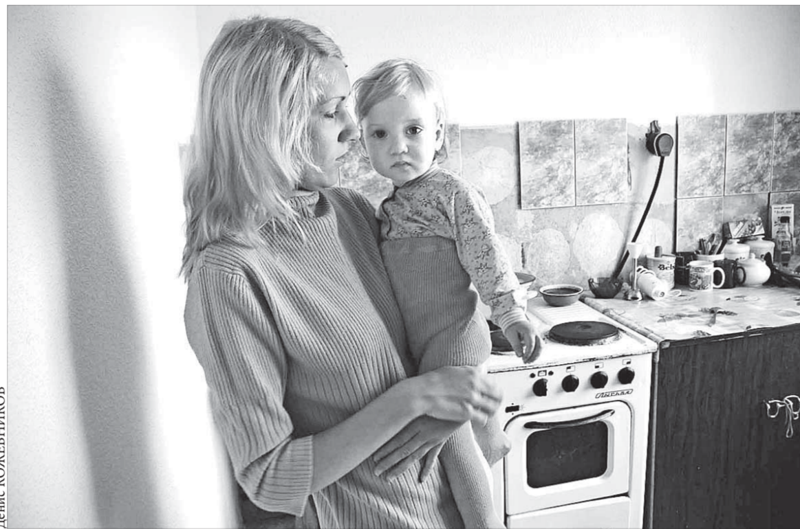
Вера и Лера мечтают о своей квартире