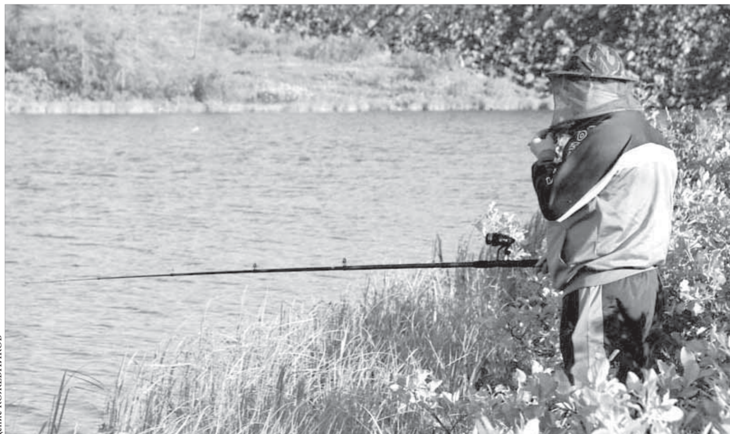
На рыбалке время летит незаметно