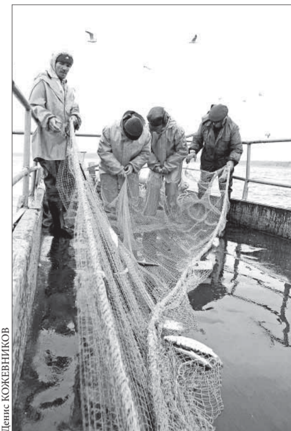
Каждый рыбак обязан знать... правила