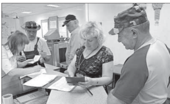
Суров он, паспортный контроль

– Так и живем от сплава к сплаву. Цельный год его ждешь. Настроение отлич-