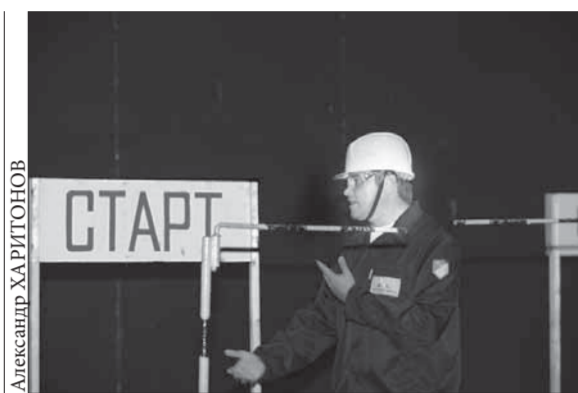
Старт через два дня