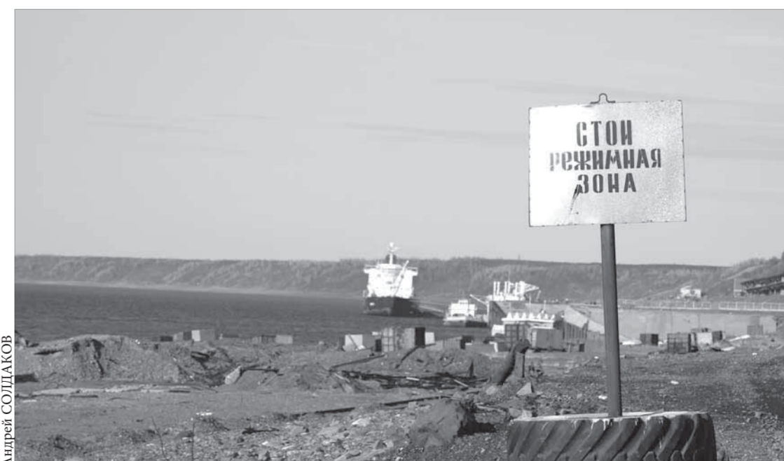
Порядок – он и есть порядок

– Никаких нарушений прав судовладельцев нет и быть не может. В акватории рек Енисей и Дудинка действует тридцать причалов, приспособленных для разгрузки и погрузки. На них работают квалифицированные специалисты. Для меня главное – безопасность жителей Дудинки и спокойная работа порта. В ситуации разбираются представители правоохранительных органов, но повторю, что решение капитана порта по ограничению движения коммерческих судов законно.