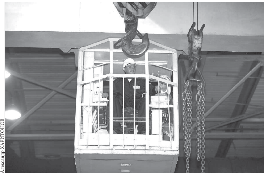
Крановщику нужны безукоризненная точность и быстрота

С этого дня жители СНГ, решившие получить гражданство России, должны будут предоставлять в Федеральную миграционную службу РФ сведения о наличии постоянного источника доходов и о знании русского языка. По данным ФМС РФ, в регионах Сибири около 50% граждан, приобретающих российское гражданство, не владеют русским языком и порядка 85% из них не имеют постоянного источника доходов.