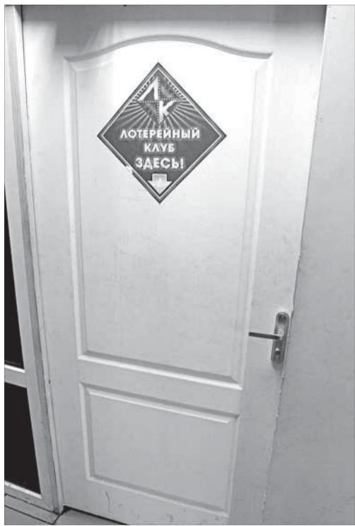
Клуб в "Золотом теленке" на замке

После возбуждения дела милиционеры опечатали 16 автоматов, но оставили их на хранении в клубе. Однако, как выяснилось при последней проверке, владельцы клуба, не срывая печатей, вновь подключили устройства. Сейчас автоматы вновь отключены и вывезены на один из норильских складов. Проверка продолжается, след будет рассматриваться в арбитражном суде. Максимальная сумма штрафов за незаконный лотерейный бизнес – 40 тысяч рублей.