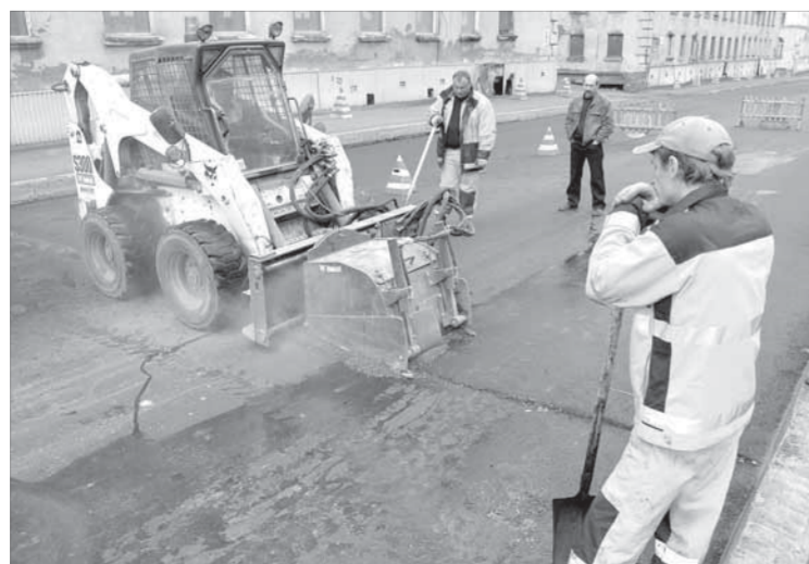
Маленький, но мощный

– Наиболее часто повреждения происходят осенью-весной, когда вода попадает в поры асфальтобетонного покрытия, и после заморозков-оттепелей со временем образуются ямы, – объясняют специалисты муниципального бюджетного учреждения "Управление "Норильскавтодор". – Через три года дорожное полотно обычно требует ямочного ремонта, а через