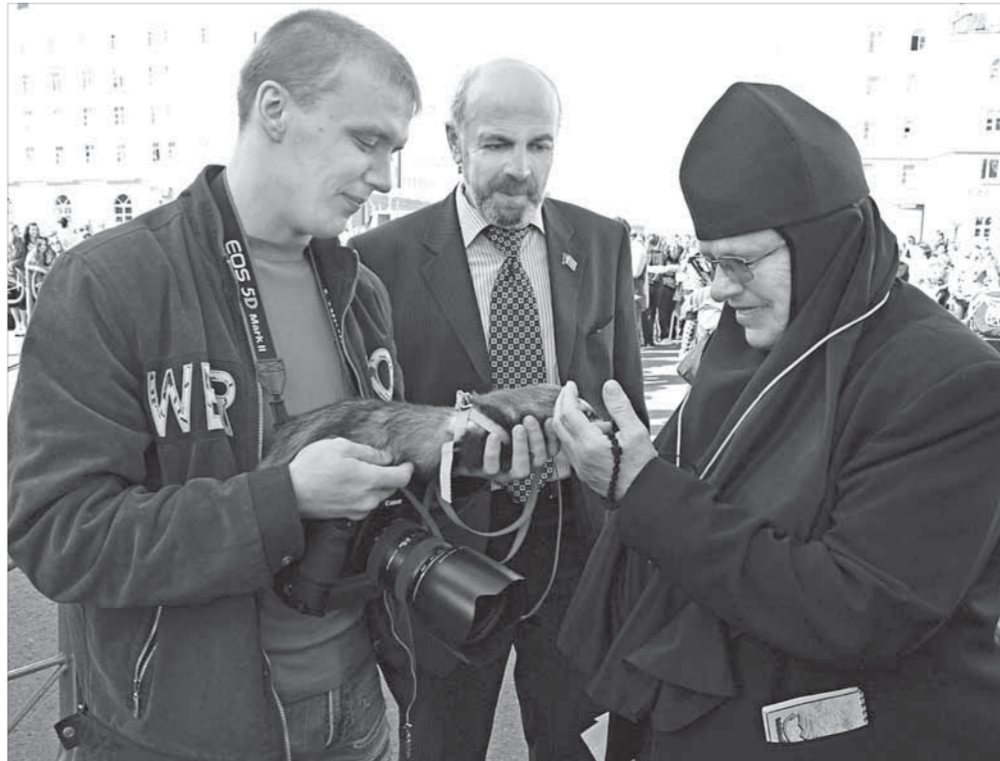
Хоря – зверек по связям с любой общественностью

В Интернете люди продают и покупают страусов, нильских крокодилов, мраморных тараканов, поросат мини-пиги, макак, питонов, рысаков и осликов. В Норильске пошла мода на хорьков. Их хозяева собираются возле загса, рассказывает Денис, вместе со своими питомцами. Хоря там пока не был, но если попадет, ему должно понравиться. Общество он любит.