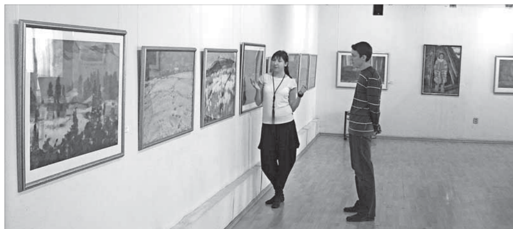
В свое время эти работы собирали полные залы

Сотрудники галереи планируют, что выставка будет работать все лето. А значит, будет возможность рассказать и о других ее авторах.