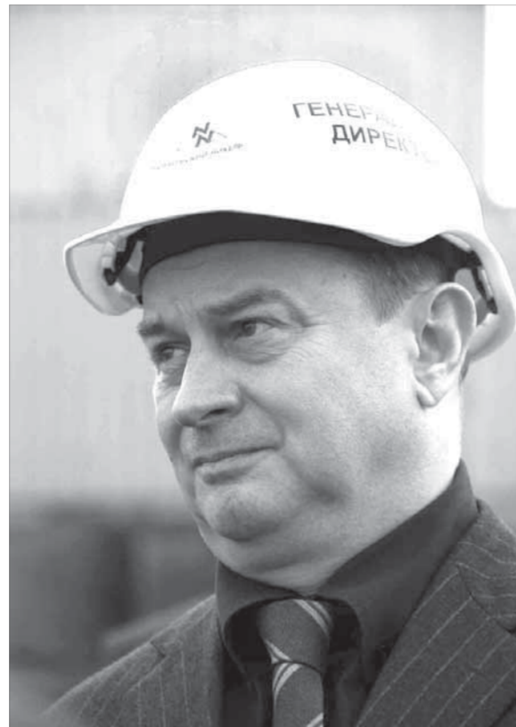
"В России не остановлен ни один завод компании"

но-производственные. Но инвестиционная программа не свернута, все важнейшие для долгосрочного развития ГК проекты будут реализованы. Могут быть пересмотрены сроки, объемы, формат инвестиций. Но ни один принципиально важный для будущего компании производственный или технологический проект отменен не будет – при сохранении жесткой финансовой и исполнительной дисциплины.