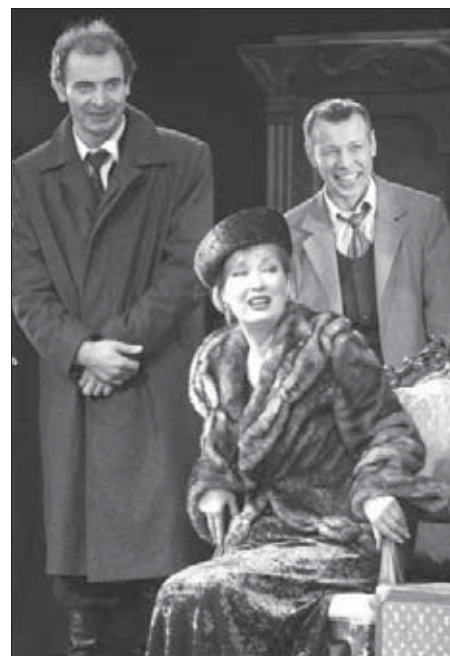
Раневская, как и все в “Вишневом саду”, хочет любить, но не умеет. В отличие от актрисы

Извините, что не слишком откровенна. Считаю, что исповедоваться нужно в церкви, а не в интервью.