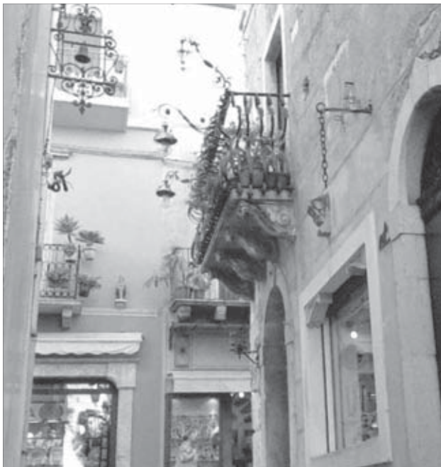
Сицилийский дворик: красиво и уютно

Игрушечный курортный городок Таормина – жемчужина Сицилии. Здесь проходят кинофестивали, гуляют мировые знаменитости. Городок расположен на вершине горы на Ионическом побережье острова. Чтобы попасть сюда, надо подняться... на лифте. В Таормине, как и в Венеции, движение автотранспорта запрещено. Автобусы и машины остаются внизу на бесплатной муниципальной стоянке-гараже внушительных размеров. После общения с Палермо Таормина со своим пышным убранством площадей, улочками, буквально заставленными комнатными горшечными растениями и увитыми экзотическим плющом, кажется изысканной декорацией к спектаклю о dolce vita – сладкой жизни по-итальянски.