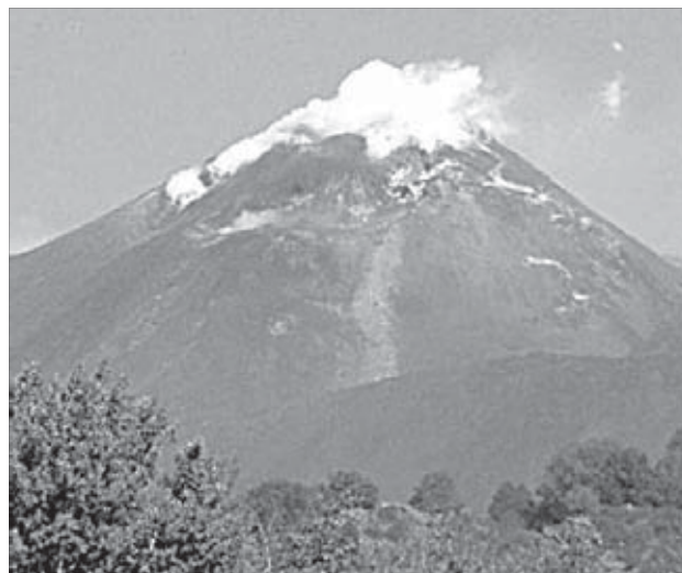
Вулканическая лава преодолевает все препятствия

Самый большой действующий вулкан Европы Этна – прекрасная бесплатная декорация к фильмам про ядерную зиму или что-то из области космической фантастики.