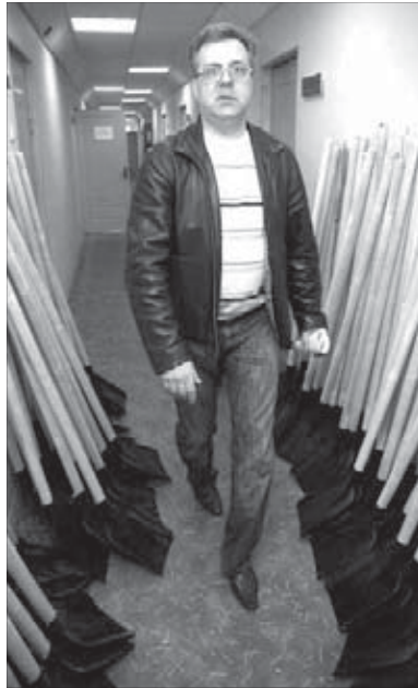
Ординцову теперь лопаты ни к чему

город», которая помимо собственной территории на Комсомольской, 33а, должна улучшить облик города в районе ресторана «Кавказ», на Талнахской. По обеим сторонам заведения представителям массмедиа следует собрать мусор и облагородить два ростверка демонтированных домов. Две улицы по обеим сторонам драмтеатра достались ЗАО «Таймырская топливная компания», объездная дорога с улицы Комсомольской до Набережной Урванцева отдана на откуп ОАО «НТПО». Прилегающую к городскому рынку территорию решено привести в порядок силами сотрудников ЧОП «Норник» и Корпоративного университета. Остальные участники субботника займутся уборкой закрепленных за ними территорий. В случае, если обстоятельства не позволят справиться с уборкой закрепленной территории в срок, ее можно закончить до 10 июля.