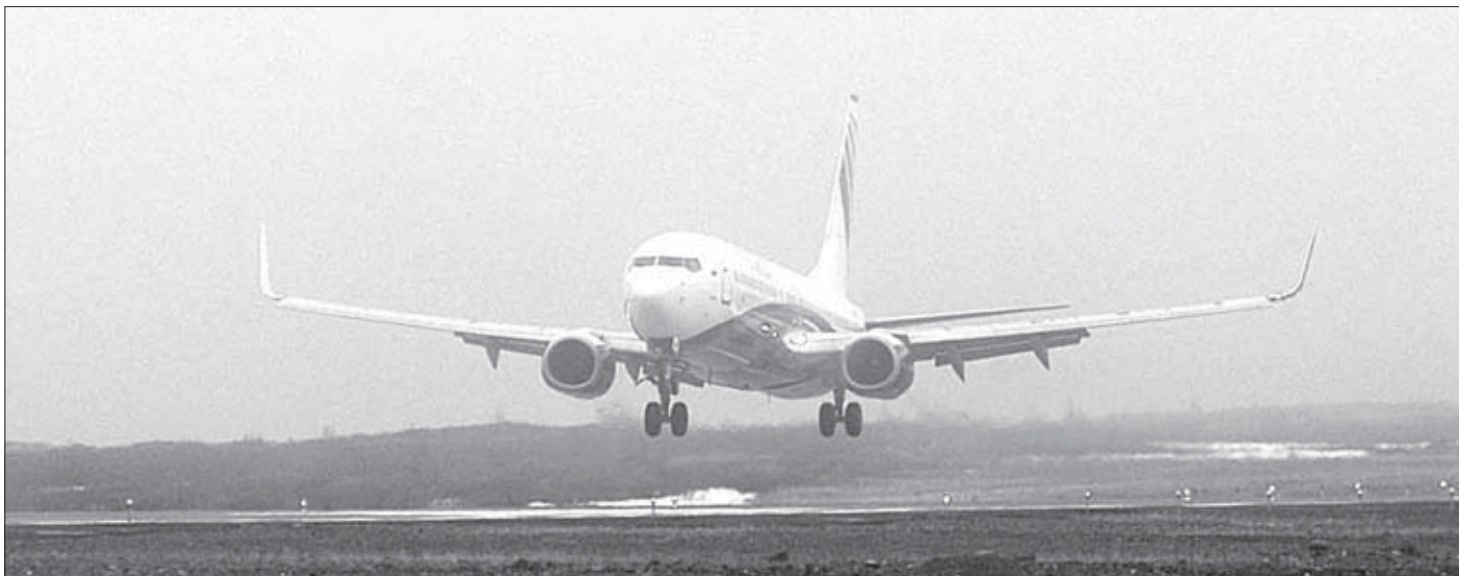
Первое приземление на норильской земле