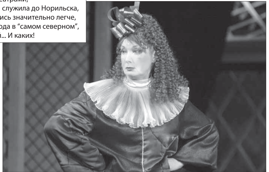
В роли Фрозины в “Скупом” демонстрирует отменное комическое дарование, музыкальность и женское обаяние. Так считают столичные критики и зрители