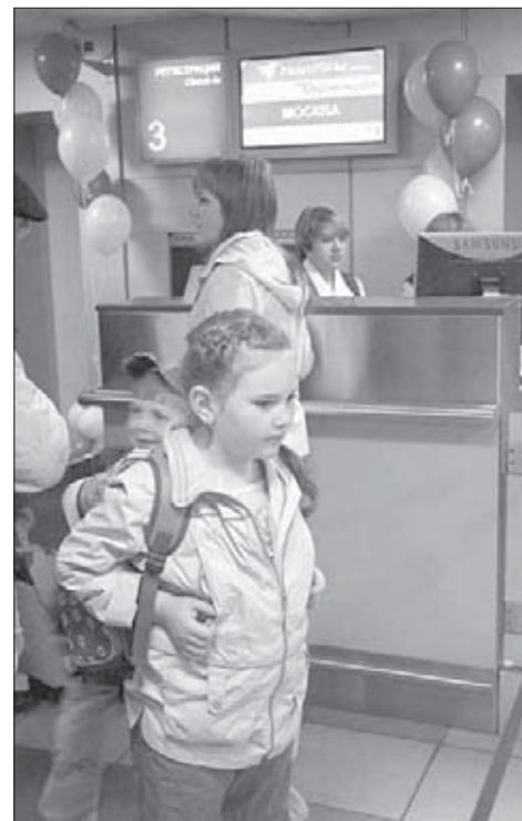
Рейсом №106 на материк

"Первопроходцы" – пассажиры первого рейса NordStar – по достоинству оценили "Боинг", на котором совершали этот, можно