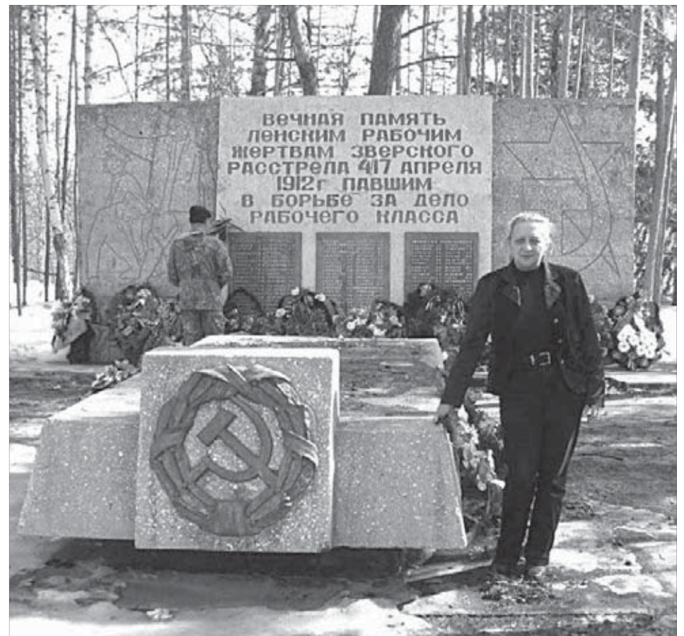
Без прошлого нет настоящего, без настоящего нет будущего

Такие поездки обязательно сказываются на региональном компоненте. Знаете ли вы, что Ангара вытекает из Байкала и впадает в Енисей? Стало быть, Таймыр связан с Байкалом тесными водными узами. А это что-то, да значит.