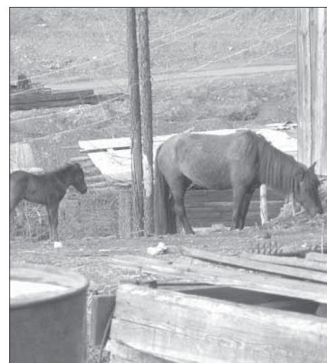
Одичавшие лошади пасутся на дальнем прииске