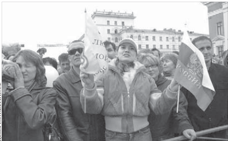
Праздник молодой, но значимый

В Талнахе в этот день пройдет праздничный концерт “Мой дом – моя Россия”. У входа в культурно-досуговый центр имени В.Высоцкого гостей встретят скоморохи, сфотографируют на память и проведут фотовыставку “Северные просторы”. В концертной программе примут участие ансамбль народной песни “Раздолье”, ансамбль народного танца “Оганер”, ансамбль “Акварин” и другие творческие коллективы. Приходите, будет весело!