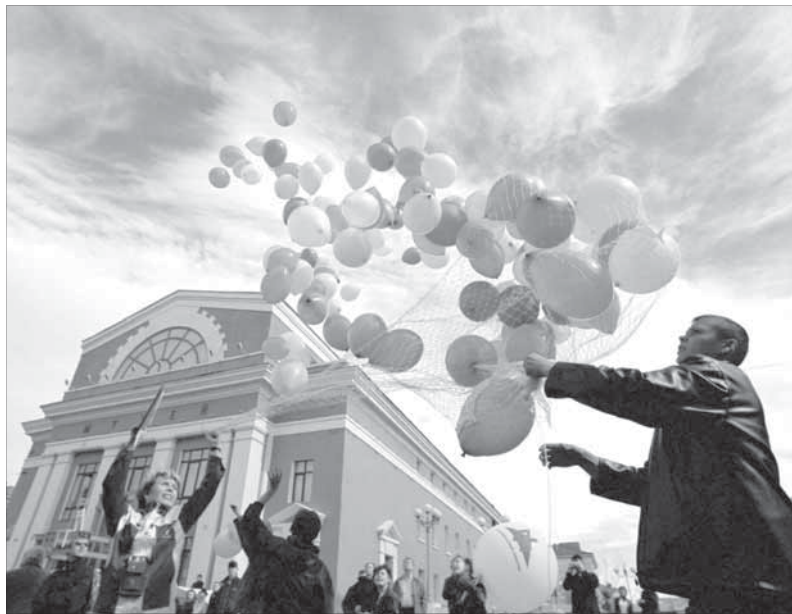
12 июня в небо запустят шары и голубей

Главная идея праздника будет воплощена самым активным участием в нем культурно-национальных объединений Норильска. ОКНО “Украина”, азербайджанская, осетинская, чувашская, башкирская, татарская и белорусская диаспоры, объединение поддержки греческой культуры на деле докажут, что “мы – россияне!”.