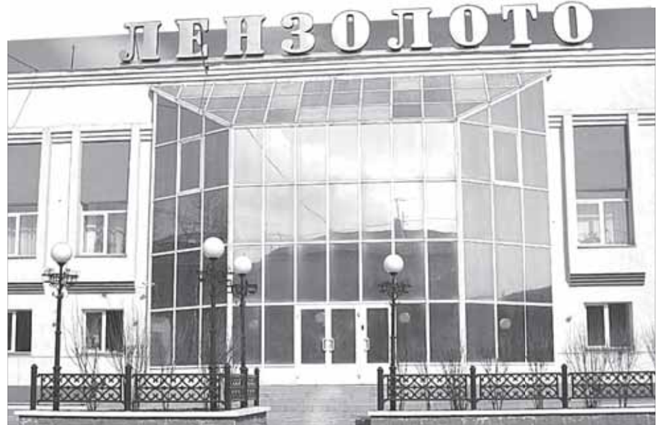
Сверкает на солнце окнами офис ЗАО «Лензолото»