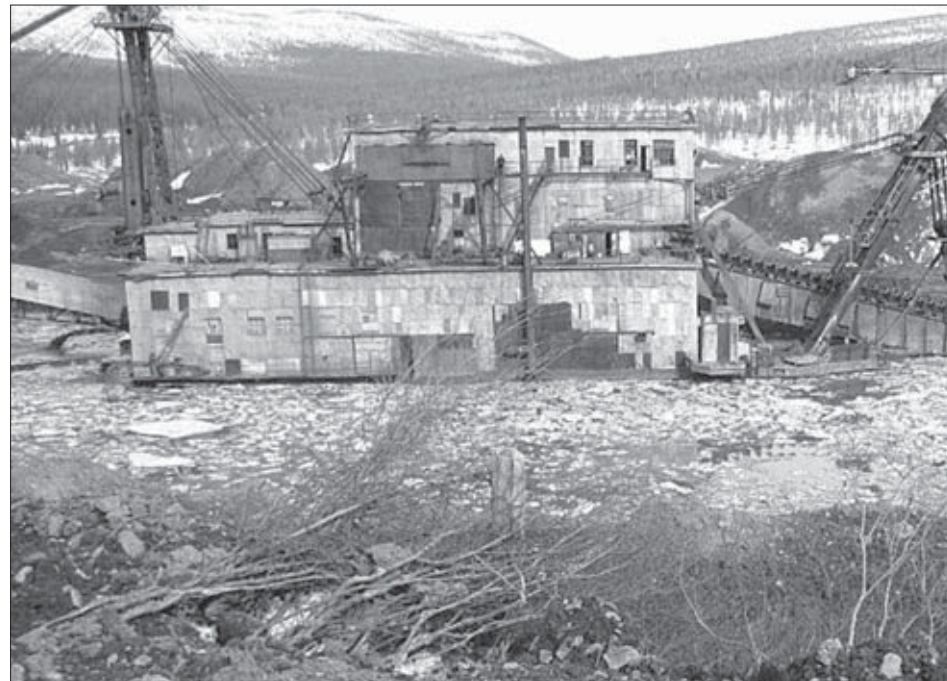
Неутомимая драга извлекает из россыпей ценные минералы

Есть здесь и такие животные, которых даже медведи боятся. Это лоси. Мощными копытами они могут так припечатать, что мало не покажется. При