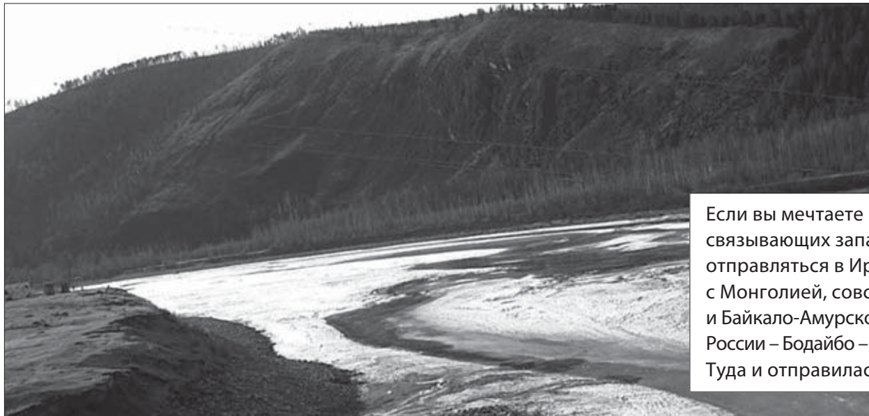
Горделивая Жуя готова вырваться на простор

Самолет садится прямо на землю, бежит по лужам, поднимает пыль и предстает взору встречающих эдаким бесшабашным грязнулей. Служащие аэропорта, прежде чем отправить лайнер в обратный путь, моют забрызганные иллюминаторы из брандспойта.