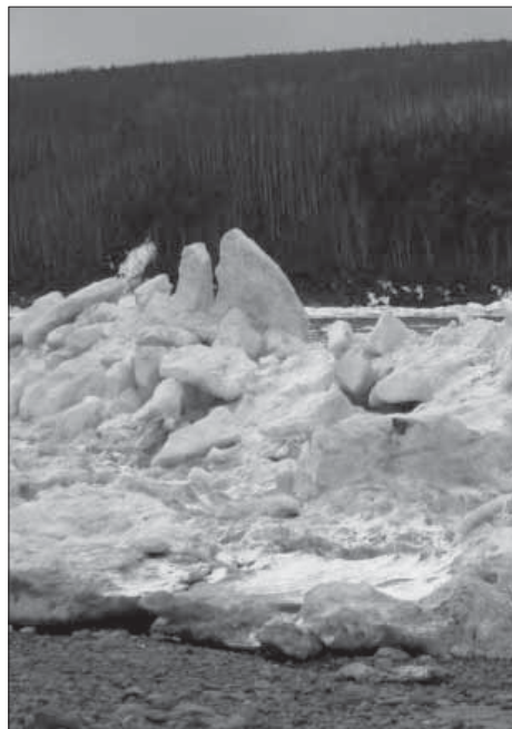
Ледоход на реке Витим – завораживающее зрелище

В районе много рек: Витим, Бодайбо, Патом, Жуя, Нерпо, Хомолхо, Вача. Они принадлежат водозабору Лены. В апреле-мае можно наблюдать речные ледоходы. До самых отдаленных приисков в это время добраться непросто. На «буханке» или «санитарке», как здесь называют «УАЗ», нужно пересечь Жую, готовую освободиться ото льда, а это чревато. Водитель так и говорит: надо, мол, спешить, а то не сможем прыгнуть с берега на льдину – забереги большие.