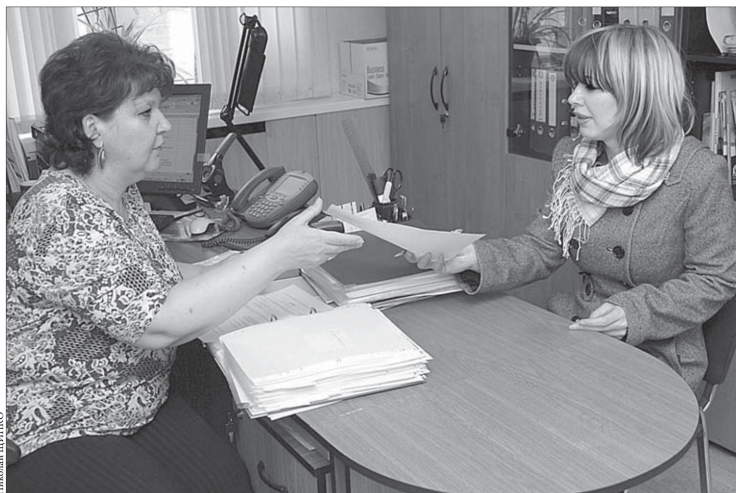
Процедура возврата налогового вычета для работника сведена до минимума

Вкладчики негосударственных пенсионных фондов могут получить социальный налоговый вычет в размере 13% от суммы пенсионных взносов в НПФ, сделанных с 1 января 2007 года. Тем не менее знают об этом не все, а многие и вовсе не спешат воспользоваться льготой по причине утомительной процедуры получения необходимых справок. В управлении по персоналу и социальной политике Заполярного филиала принято решение о том, что пакет документов для получения социального налогового вычета по заявлению работника предприятия теперь формируют сотрудники отделов по работе с персоналом. Подобное решение вполне можно назвать норильским ноу-хау.