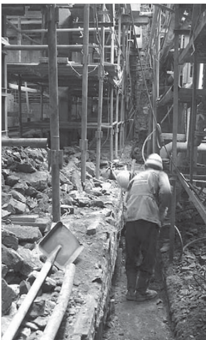
Ремонты – время находок

Найденные кирпичи – привет из прошлого. 66 лет назад начиналась история норильского кобальта. На строительство завода №25 и обкатку технологии ушло три года. Первый кобальт был получен в 1946-м.