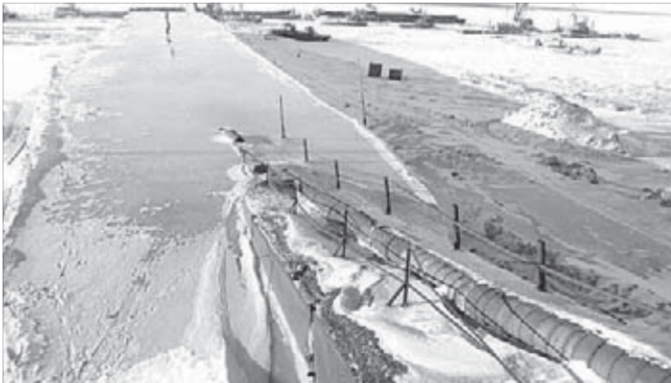
Подобие Дудинской дамбы — Хатангская

Сейчас длина дамбы по гребню составляет 785 метров, ширина около 40 метров, а высота относительно берега до 14 метров. Как и 30 лет назад, она защищает город и порт от разрушительной стихии. Подобная практика взята на вооружение и в Хатангском морском порту.