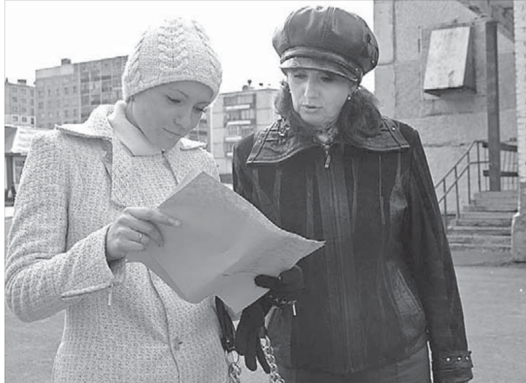
В списке инспекторов два десятка «непослушных» родителей

Инспекторы ГДН возражали, что навещают тех, кто состоит на учете. Чаще всего о неблагополучных семьях и детях они узнают от жителей. Некоторые звонят в отдел ГДН, кто-то – в дежурную часть отдела милиции №16. Любая помощь и информация от кайерканцев очень ценится инспекторами. Они призывают к содействию всех неравнодушных горожан.