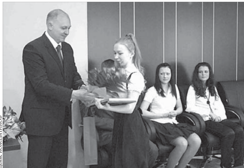
Премия из рук главы – достойная награда

Отдельной темой обсуждения стал вопрос лекарственного обеспечения. Управление здравоохранения постоянно анализирует цены и следит за тем, насколько обеспечен город лекарственными препаратами. В ходе ряда проверок были выявлены случаи превышения установленных предельных надбавок в цене товара. Алексей Текслер подчеркнул: информация обо всех подобных фактах и нарушениях будет передаваться в краевые надзорные органы, поскольку вопрос доступности лекарственных препаратов – приоритет государственного значения.