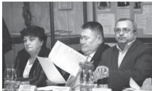
Предложения по занятости – в письменном виде

В Эвенкийском и Таймырском муниципальных районах от безработицы больше страдают женщины и представители коренных малочисленных народов. В общей численности жителей края доля коренного населения Крайнего Севера составляет всего 13,3 тыся-