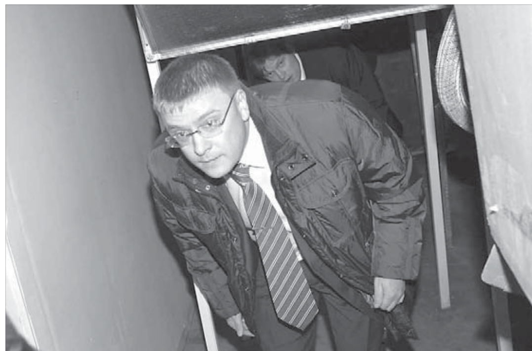
Сити-менеджер основательно проверил ход ремонта