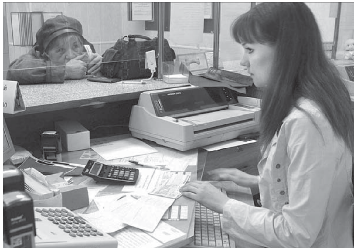
Билеты есть во всех кассах города