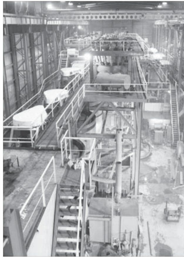
Цех переработки, флотации и обогащения лежалых хвостов хвостохранилища №1