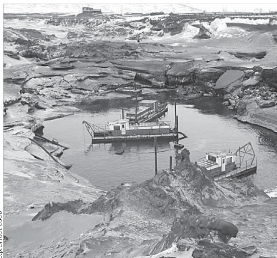
Разработка пирротинного концентрата в пирротинохранилище НОФ

Превышение расходов и доходов планируется закрыть за счет облигационной эмиссии в 10 миллиардов рублей, остатков прошлого года и, если потребуются, банковских кредитов.