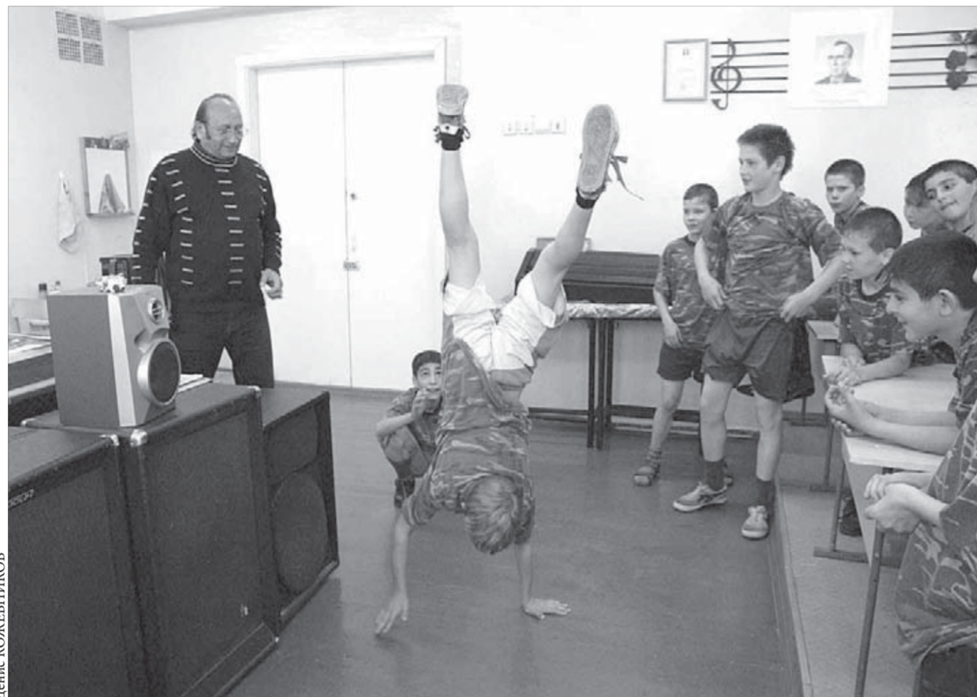
Летом детвора отрывается по полной

Выставка откроется в 13.00 по адресу: Ленинский проспект, 14. Свои работы представят 14 норильских фотографов и любителей фотографии из фотоклуба "Таймир". Кроме того, центр семьи "Норильский", фотоклуб "Таймир" и агентство "Кактус" проведут в этот день специальную акцию на улицах города. Сотрудники центра предложат маленьким норильчанам подписать обращение детей к взрослым, подарят праздничные открытки и бесплатные приглашения на фотовыставку.