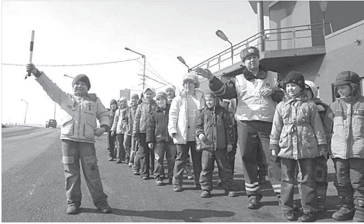
Растет молодая смена ДПС

Самым проворным в этот раз было дозволено под прищелком офицера самостоятельно махнуть полосатой палочкой. Удовольствие от произведенного эффекта на дороге буквально переполнило гордость юного гимназиста, чего не скажешь о водителе автомобиля, который был сильно удивлен таким поворотом событий.