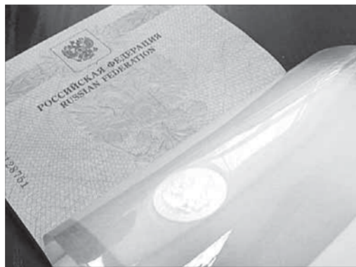
Новые паспорта получили меньше тысячи норильчан

– Может ли человек, постоянно проживающий в НРП и имеющий здесь временную