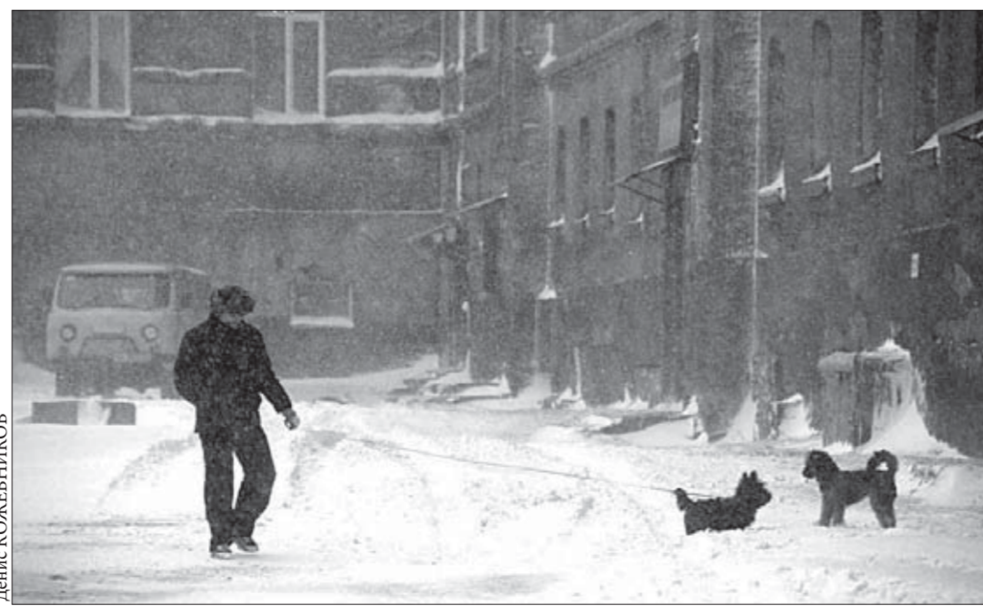
Норильчане выгуливают собак во дворах