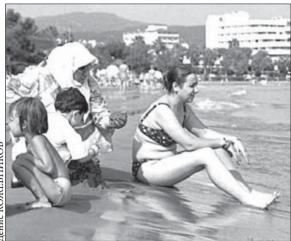
В Турции можно позагорать...

В Заполярном филиале и ряде предприятий группы «Норильский никель» запущен пилотный проект новой корпоративной программы «Отдых работников за рубежом». В приемных по производственным и социально-трудовым вопросам и в отделах по работе с персоналом начался прием заявлений от претендентов. Всего в 2009 году оздоровиться по туристическим путевкам смогут 1100 работников компании и членов их семей.