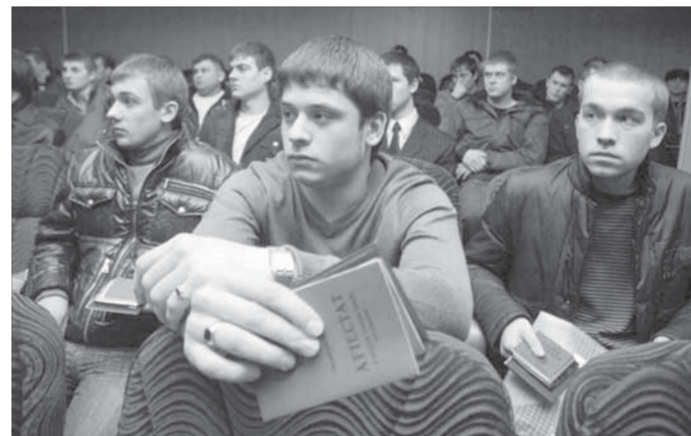
Шансы есть всегда