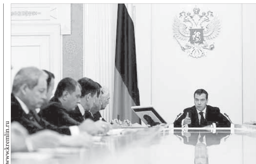
Совещание с членами правительства и руководителями палат Федерального собрания по Бюджетному посланию на 2010–2012 годы