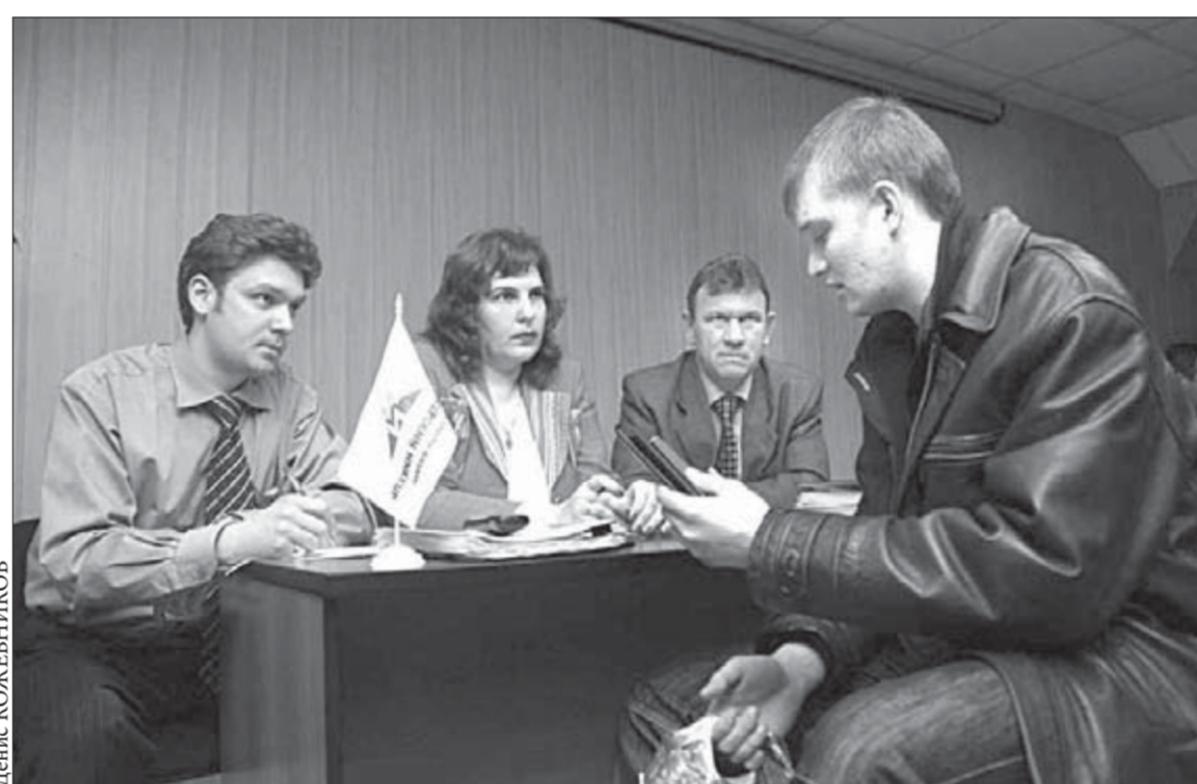
Собеседование – ответственный момент