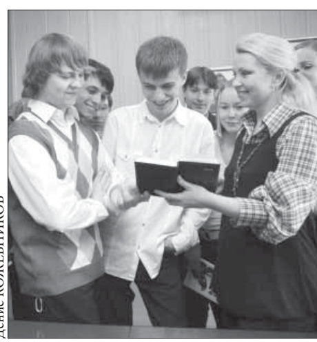
В будущее – с оптимизмом

ский никель" готова тратить огромные деньги на подбор и подготовку специалистов для собственных производств. Трудоустроиться сюда по-прежнему престижно. Потому что "Норникель" – это гарантия стабильной работы, высокий уровень доходов, разнообразные социальные программы, карьерный рост. Все эти составляющие, конечно же, интересуют и выпускников. – Я человек амбициозный, поэтому выбрал техническую специальность,