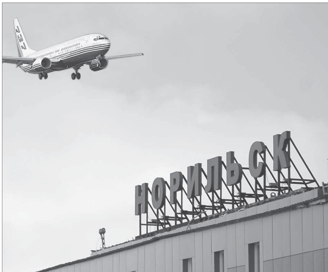
Идея организации собственных авиарейсов в "Норильском никеле" зрела давно