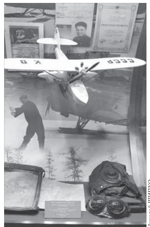
В музее так интересно!

Декорации в театре теней замечательные. Действующие лица и исполнители в этом спектакле из истории освоения и развития ННР всегда на месте.