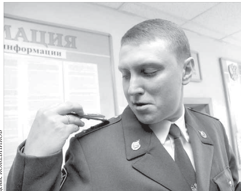
В праздничный день многие получили звания