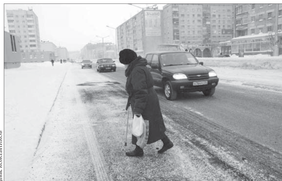
Осторожность – залог долгой жизни

С 23 мая в России ужесточается административная ответственность пешеходов и водителей. Чем это обернется для норильчан, рассказали в городской ГИБДД.