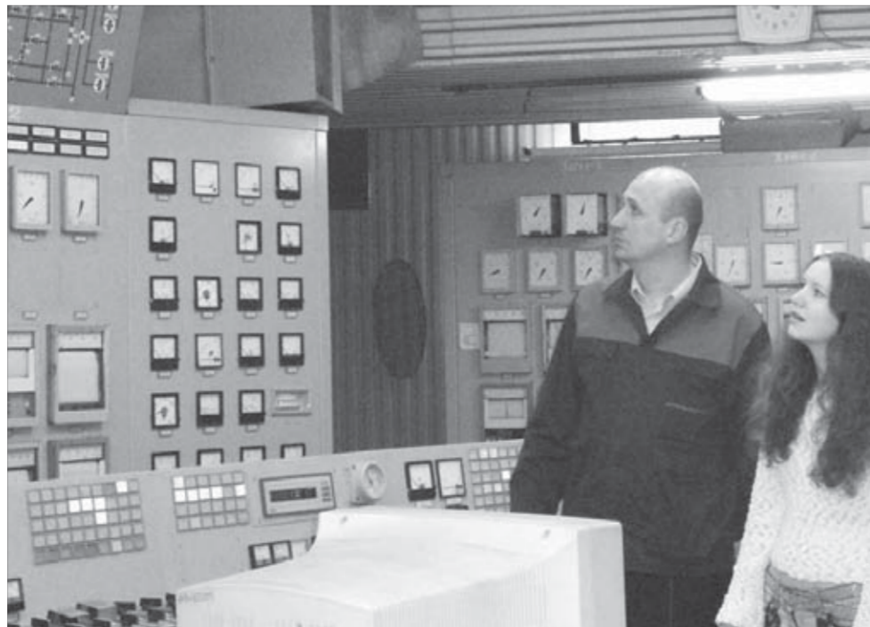
Теория подкрепляется на практике

А в 60-х годах прошлого столетия в тогда еще Норильском вечернем индустриальном институте была всего одна электротехническая кафедра общей и специальной электротехники, позднее преобразованная в кафедру электроснабжения и электрооборудования