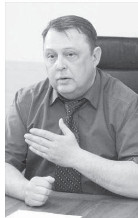
И начальник автоколонны рано приехал

уже проходят проверку у сменного механика их автобусы.