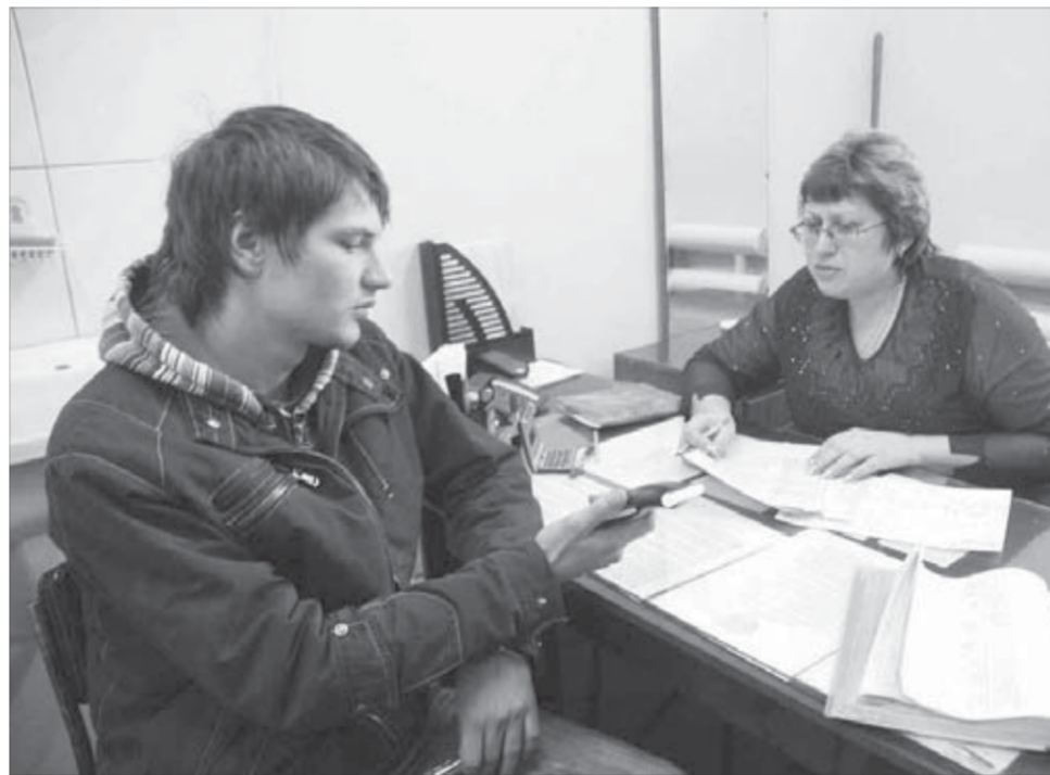
С наркологом встречаться обязательно