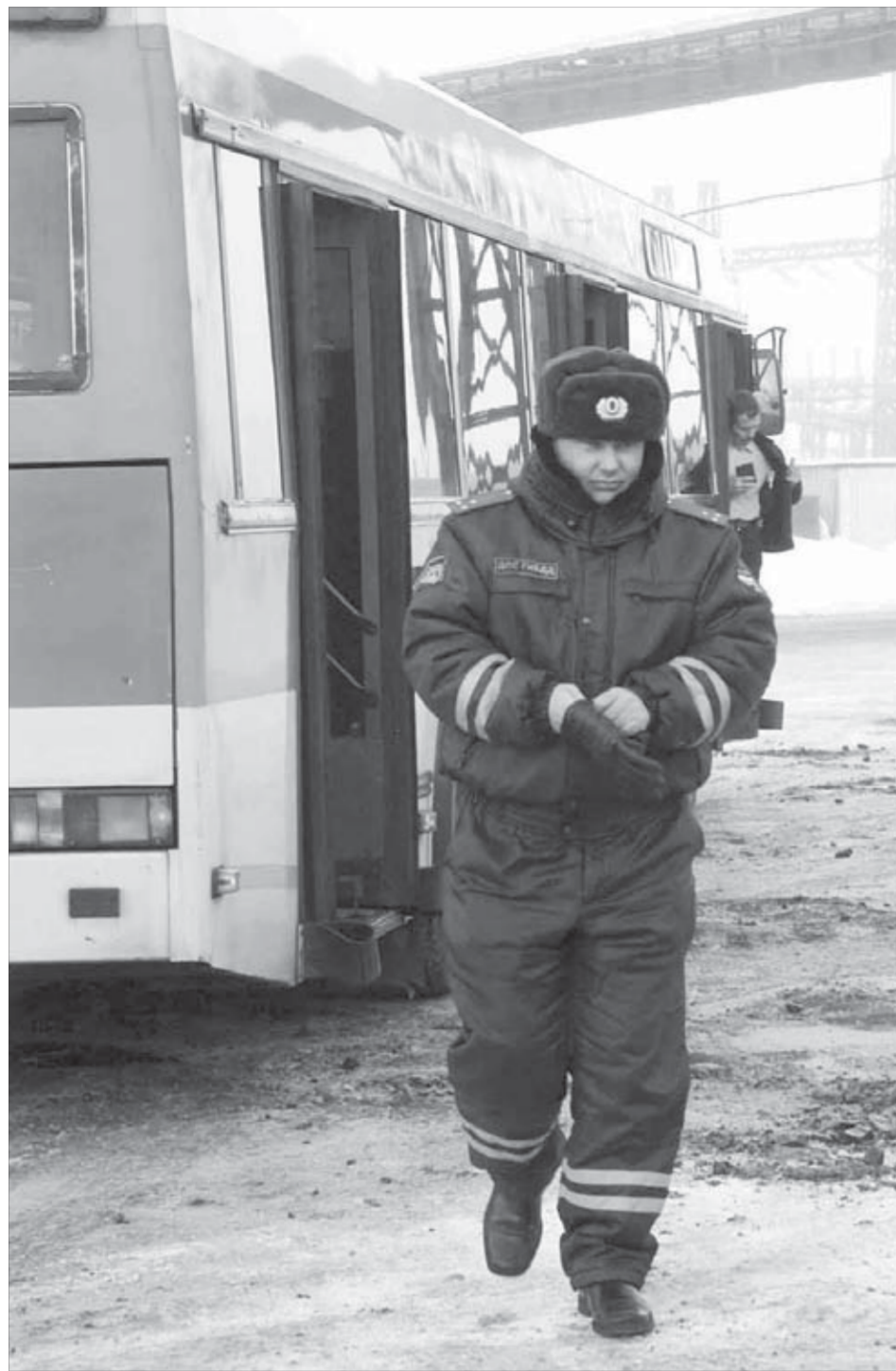
Автобус проверен, идем к другому

Пройдя нарколога, водители получают путевой лист у диспетчера, а затем