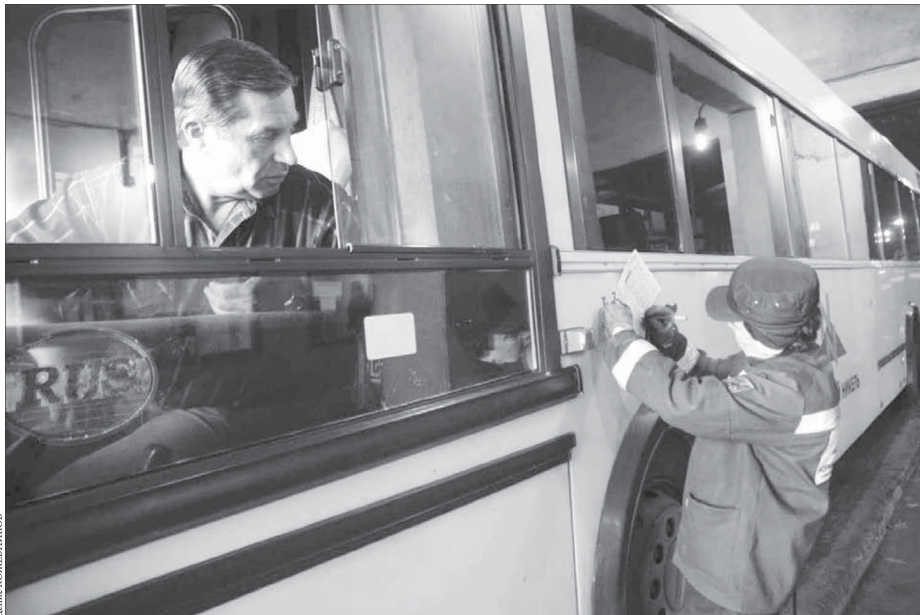
А теперь - в путь!

Согласно конкурсным документам детским садам требуется 6,5 тонн чистящих и стиральных порошков, детского и хозяйственного мыла - 16,9 тонны. Максимальная цена контракта - 2,05 млн. рублей. Конкурсные документы принимаются до 26 мая.