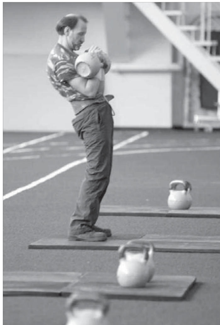
По всероссийским стандартам

В легкоатлетическом манеже “Арктики” прошли соревнования по гиревому спорту в зачет 48-й спартакиады группы компаний “Норильский никель”.