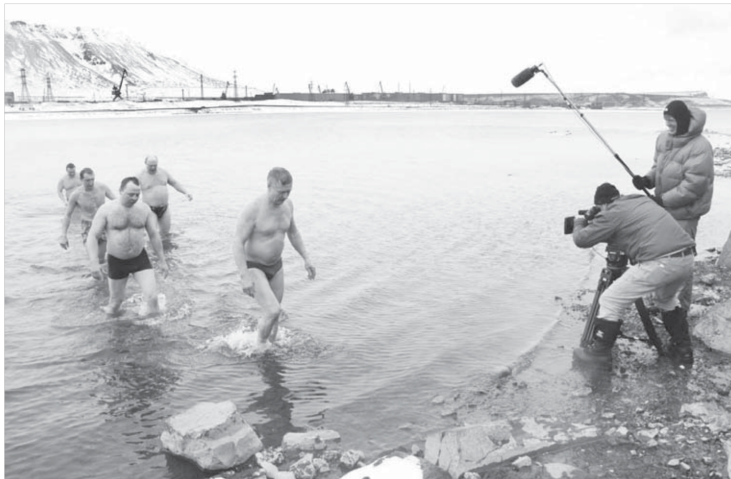
После пингвинов Антарктиды ВВС снимает моржей Таймыра