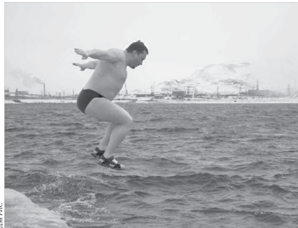
Моржи летят над Долгим

Англичане, оказавшиеся очень приятными в общении людьми, контактными, понимающими шутки и любящими пошутить сами, не скрывали удоволь-