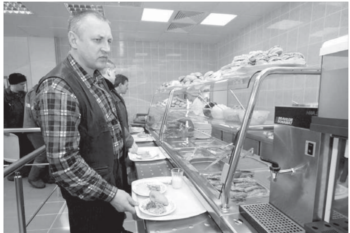
Самому первому на кассе вручат торт в подарок