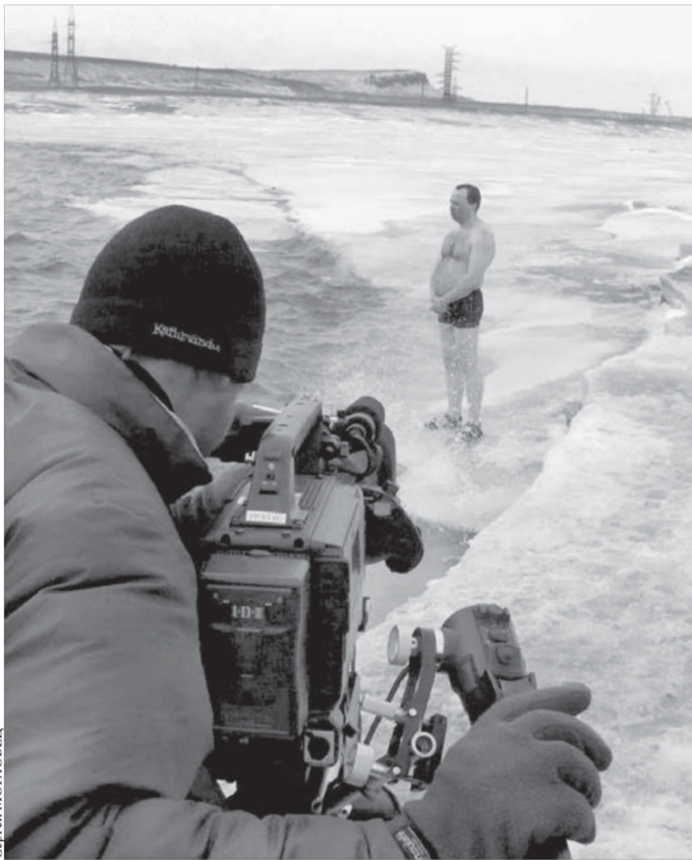
Внимание! Дубль “три”