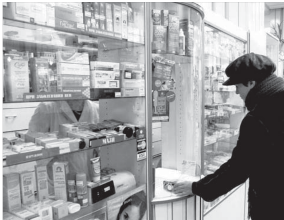
В НИПР проверили все аптеки

Далее комиссия рассмотрела вопрос об оказании в Норильске наркологической помощи и проведении профилактических мероприятий. По итогам 2008 года специ-