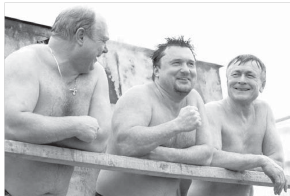
Окунешься – и жить хорошо!

– Это самокупаемые проекты, хотя они действительно фантастически дороги. Деньги выделяют заказчики – корпо-