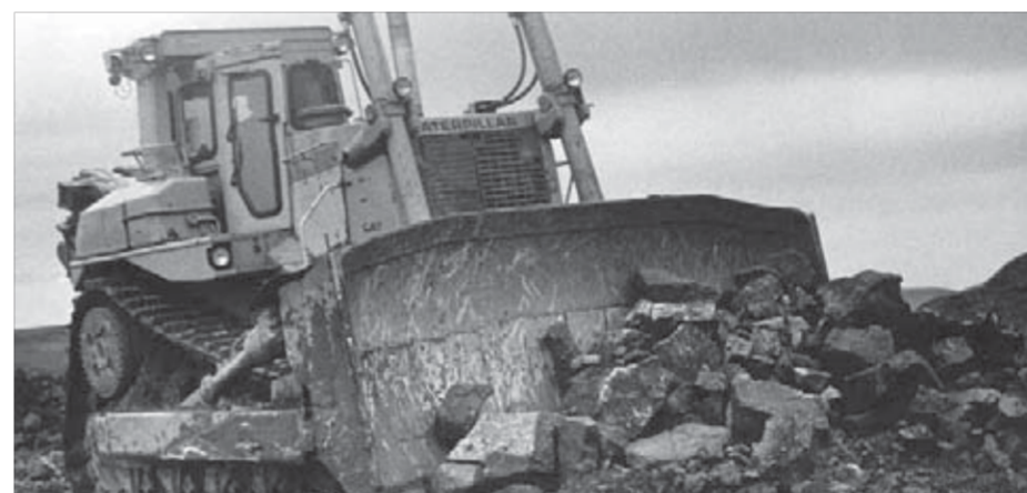
Это было, было...

И сейчас, семьдесят лет спустя, "Норильский промышленный транспорт" и входящее в его структуру Предприятие механизации производства выполняют, по сути, ту же функцию – являются машинопрокатной базой. Только тогда, в довоенные годы, здесь работало 22 человека. В их распоряжении было два дизельных экскаватора ОМ-202 и паровой "Воткинцев". А сейчас в норильском автопарке трудятся более 1700 квалифицированных работников, обслуживающих свыше тысячи