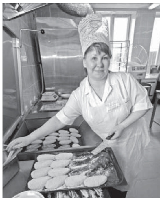
Накормят по высшему разряду

Надо сказать, что на аппетит в этот день никто из обедающих не жаловался. Долго ждали этого события, как выяснилось, не только работники «Ангидрита». Самым первым клиентом, получившим в придачу к первому, второму и третьему блюдам торт в подарок, оказался мастер участка с хвостохранилища «Лебяжье». Пока столовая ремонтировалась, ему и его коллегам приходилось ездить обедать на медный завод. Может, теперь будет наоборот? Повара уверены, что в модернизированной столовой у них все блюда будут получаться еще вкуснее.