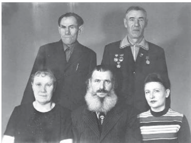
Родня в сборе. Междуреченск. 1977 год

Но какая была радость, когда он переступил порог родного дома! Солдатская выправка, грудь в наградах. Почти десять лет не виделись.