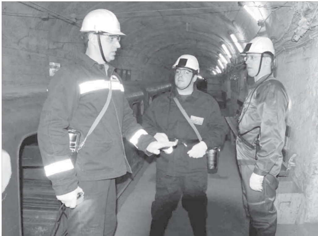
Великий князь в «подземном городе»