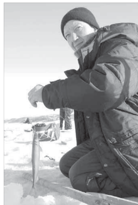
Одна рыбка – уже успех!