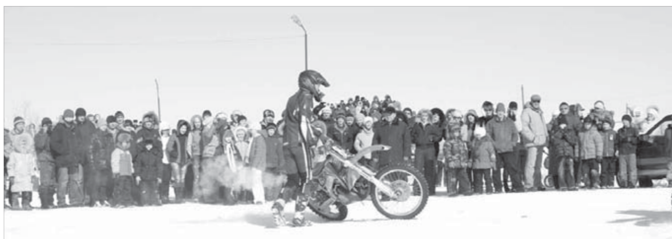
Открыли ледовое поле – вернемся

Отведав угощений, приступили к занятиям. Задача была непростая: объяснить учащимся младших классов, как надо себя вести на дороге. Где можно перейти, где остановиться, как оказать первую медицинскую помощь пострадавшим. Соль проблемы заключалась в том, что в Снежногогорске как такового транспортного движения