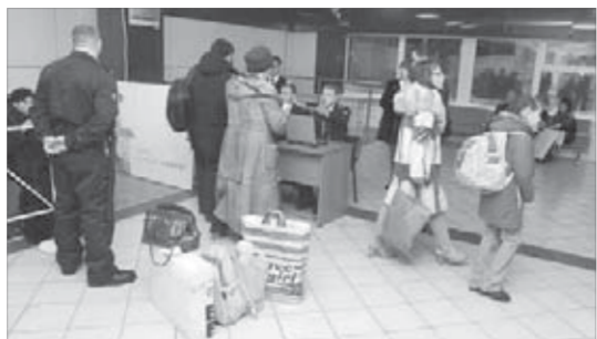
Отпуск может быть испорчен...