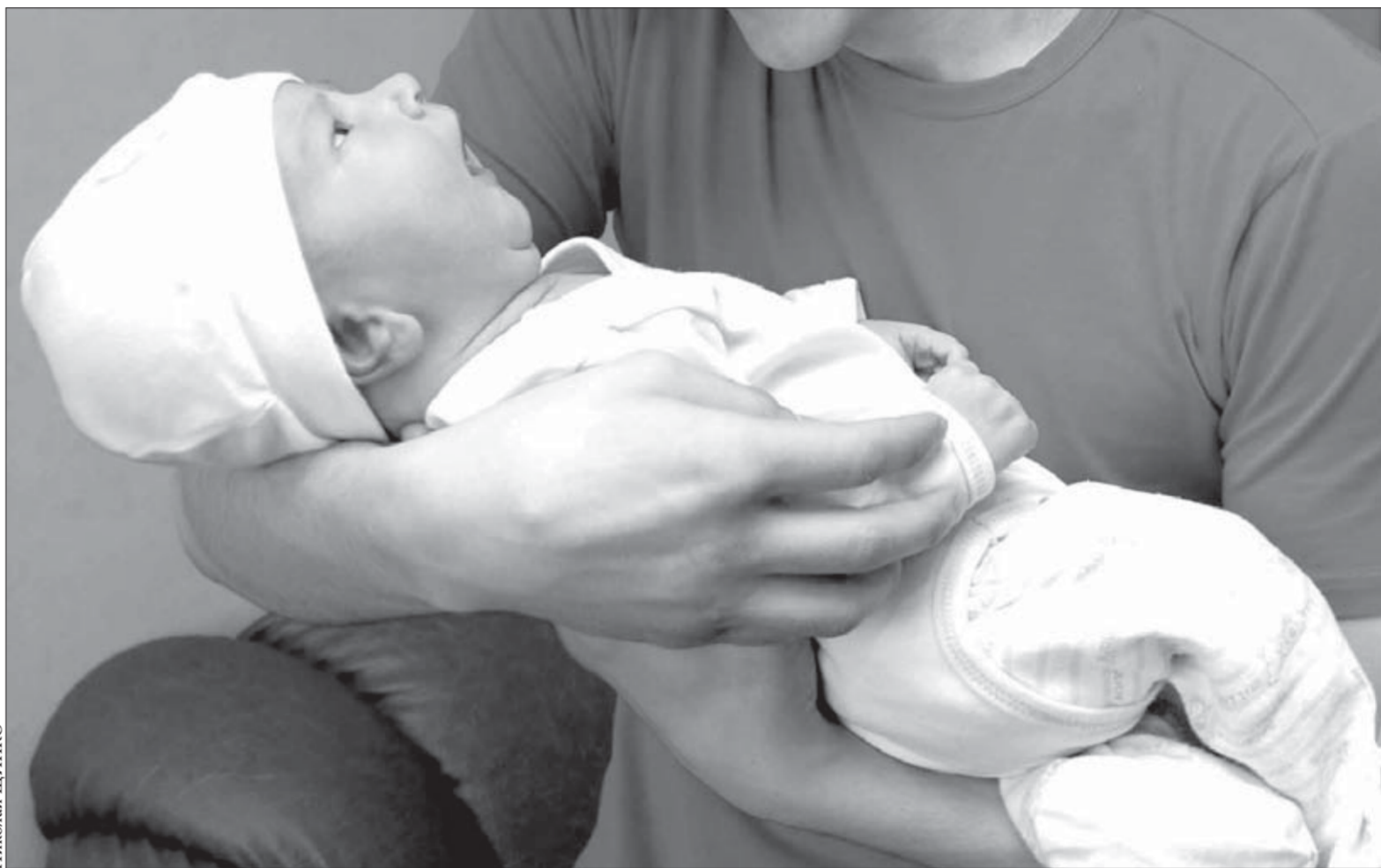
Новорожденный заговорил с первых же минут