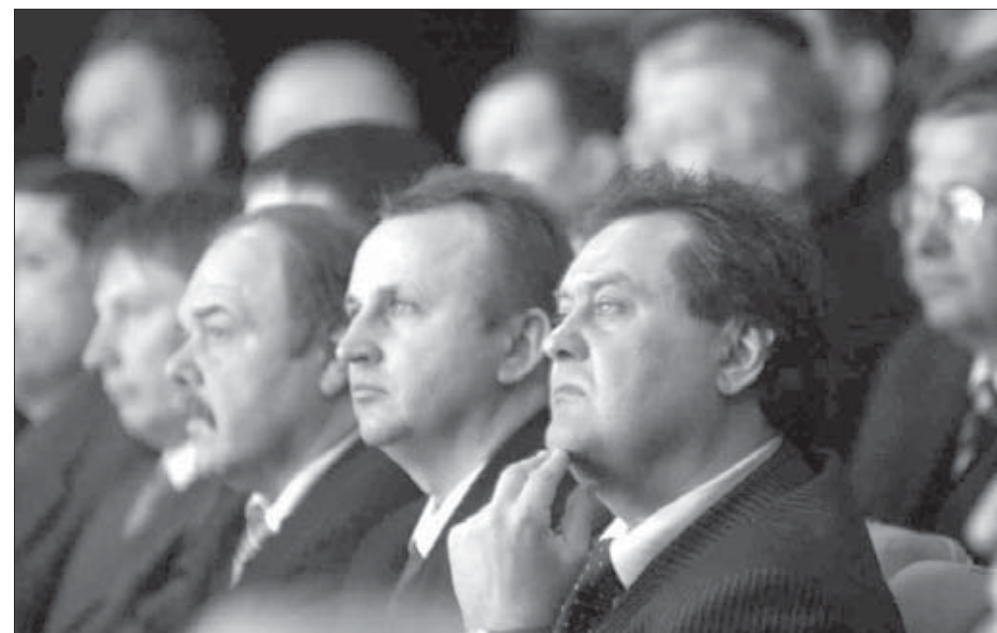
Вопросы заданы, ответы получены

Подробности читайте в следующем номере “ЗВ”