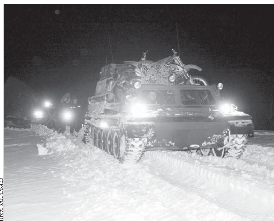
Тундра полна неожиданностей

Курс акций ОАО “ГМК “Норильский никель” – 2643,7 руб. ОАО “Полюс Золото” – 1430,4 руб.