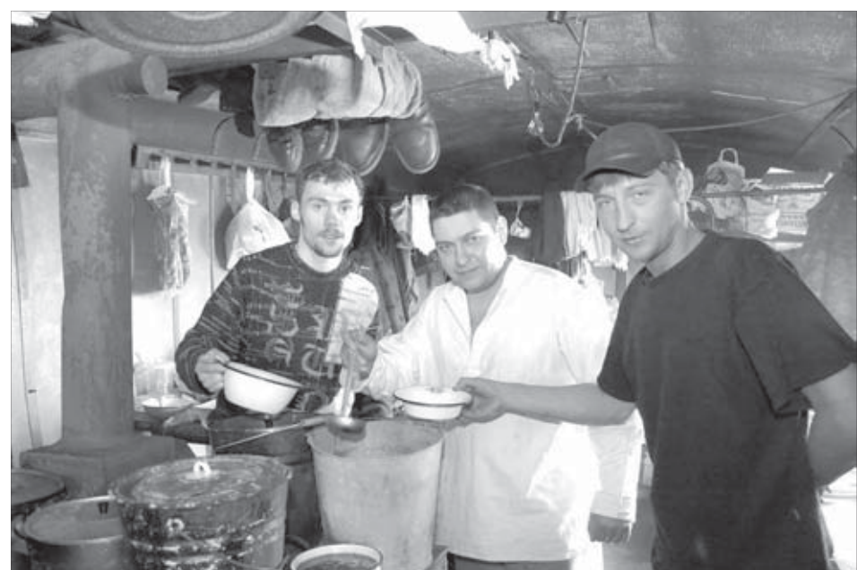
Походной каши лучше нет