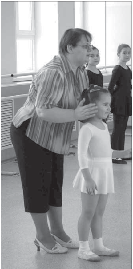
Подготовка начинается с азав