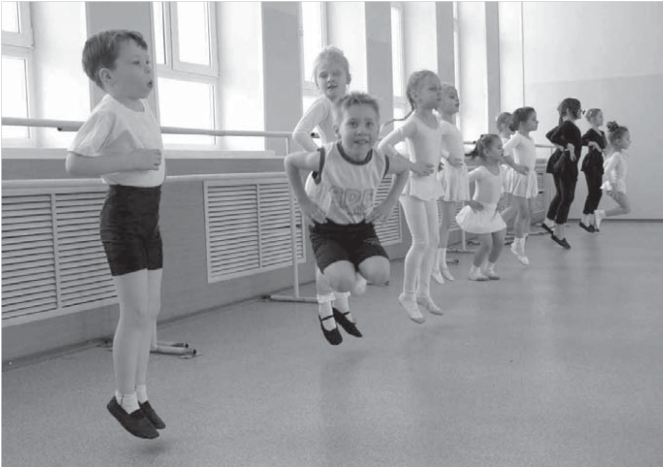
"Школьные годы": полет нормальный