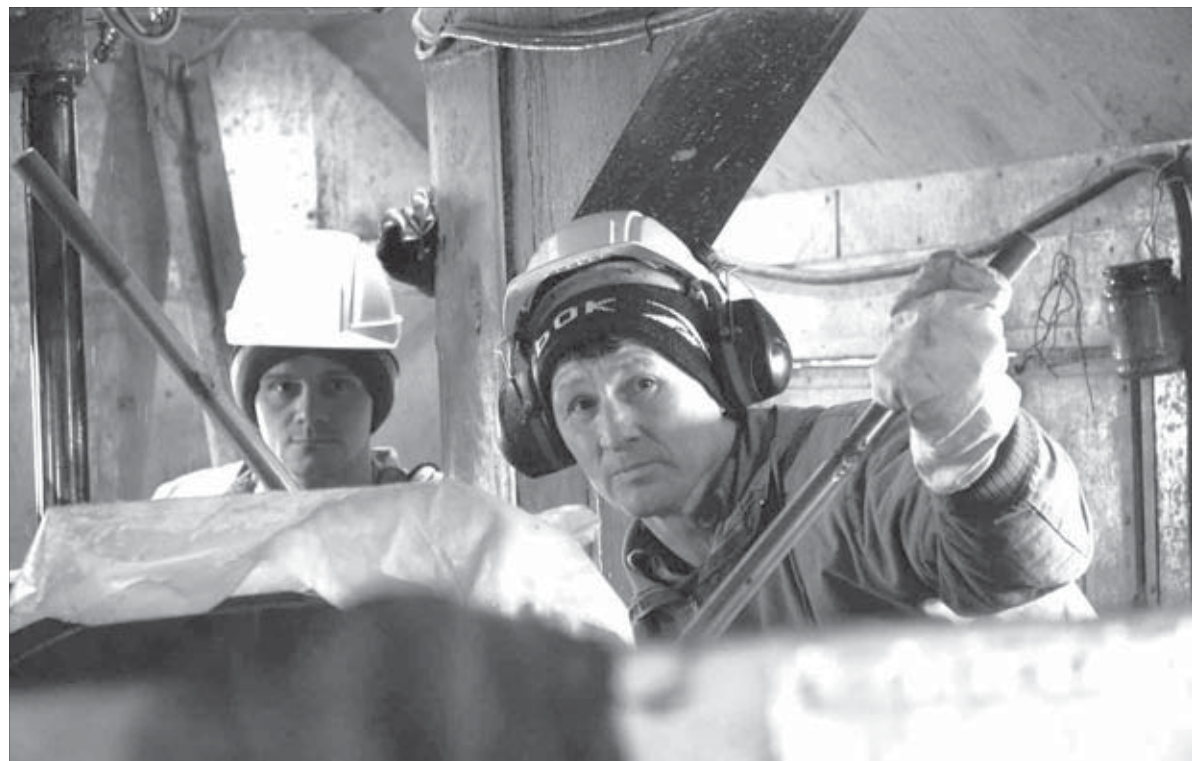
Без бурьщиков все осталось бы на бумаге