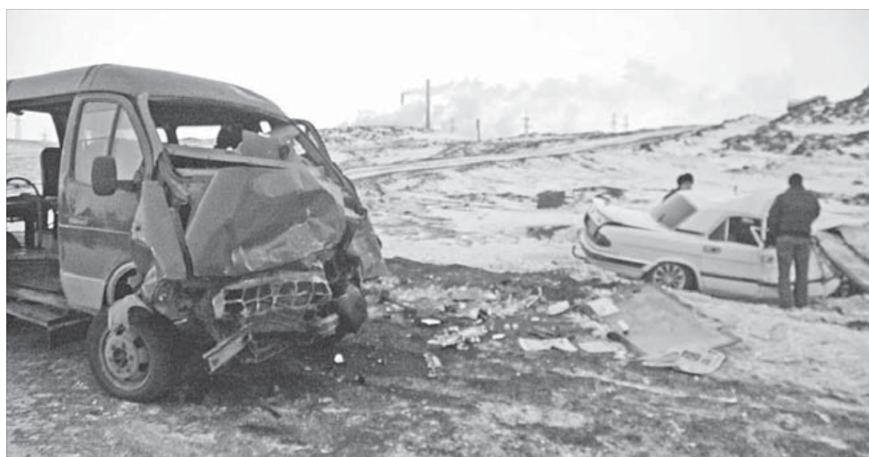
Трасса Норильск — Кайеркан: пассажирская «газель» столкнулась с «Волгой»

Некачественный подбор, нарушение режима труда и отдыха водителей, неорганизованный медосмотр перед рейсом и после работы — эти причины, как отметили на недавнем заседании депутатской комиссии по городскому хозяйству, влияют на безопасность пассажирских перевозок в Норильске.