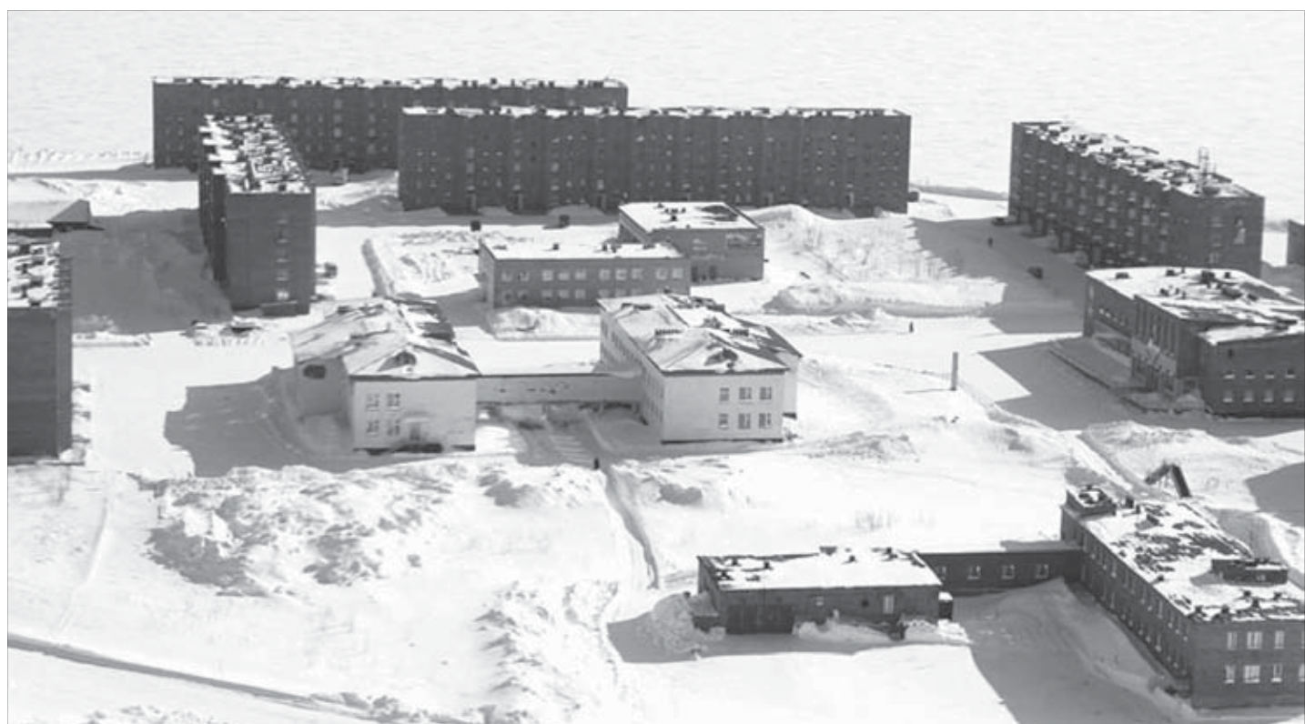
Снежногорск как на ладони