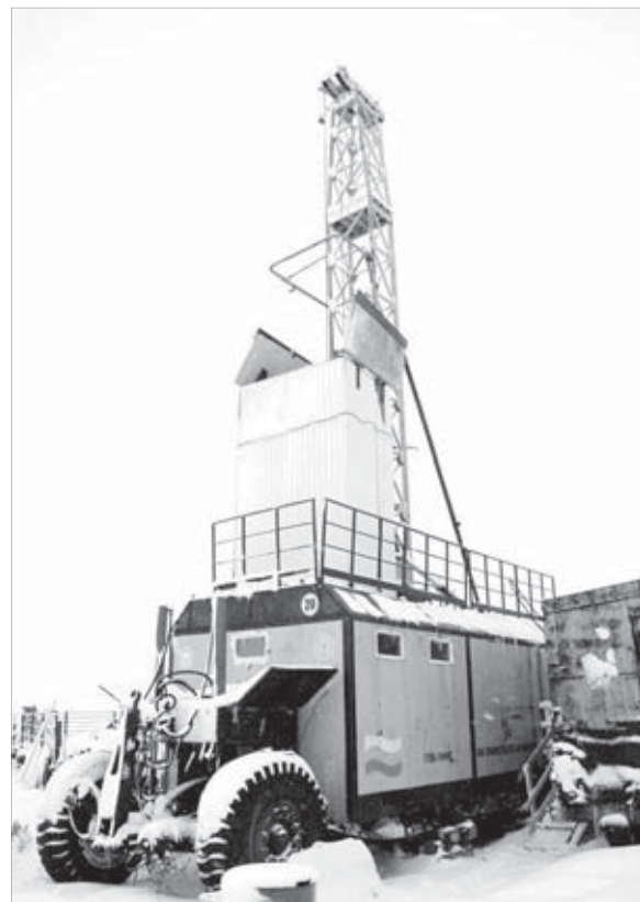
Бурение скважин – дело дорогое

Автор гипотезы переживает, удастся ли ее подтвердить окончательно. Но и тем, что уже есть, доволен. Все же сделали природу запасов, и не типичным подземным способом, а можно сказать, на пустом месте. Речь, по прикидкам геологов, идет о большой сумме: порядка 15–20 процентов от тех запасов, которые были утверждены ранее.