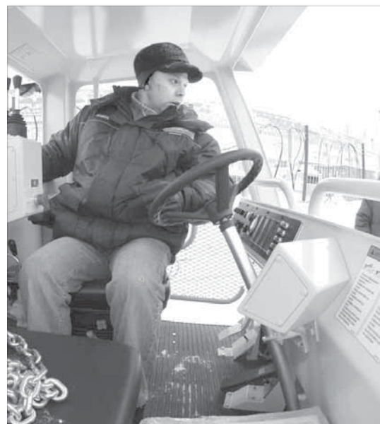
Домой своим ходом

Вчера специалисты Норильского шахтостроительного треста по одной выгнали технику из контейнеров, чтобы она, уже своим ходом, отправилась в Талнах. Для горнорудных выработок получено три машины механической оборки кровли, две машины для перевозки грузов, машина для перевозки людей в подземных условиях и подземный бетономеситель. Вся техника представлена модельным рядом Utilif и была подготовлена отправителем по принципу "сел и поехал", что и проделали специалисты ННСТ. По словам представителей треста, новая техника ничем не отличается от предыдущих типовых моделей. Однако, зная принцип производителя вводить улучшения в каждую последующую модель, норильчане готовы увидеть в технике некоторые усовершенствования.