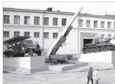
Будет место и для боевой техники

Мемориал "Вечный огонь" преобразится: тумбы разберут и облицуют гранитными полированными плитами, старое художественное литье в форме звезды и ветвей демонтируют и заменят на более современное, памятную доску с именами покрасят в серебряный цвет. Рядом установят флашгоки и три постаментов под боевую технику – это будут две гаубицы и танк. Вокруг памятника благоустроят клумбы и парковую зону. Планируется, что Севастопольская превратится в пешеходную улицу – как московский Старый Арбат. На обновление памятника выделяется порядка 10 миллионов рублей. Еще