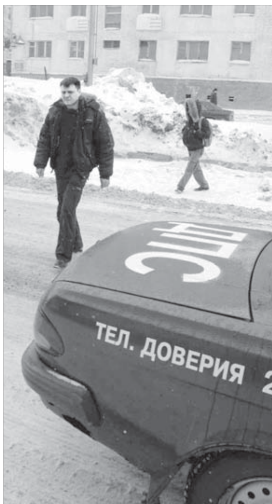
Прямоком в "объятия" ДПС