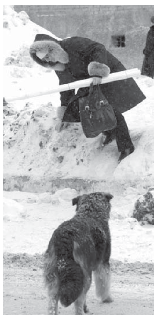
Нарушители – и люди, и животные