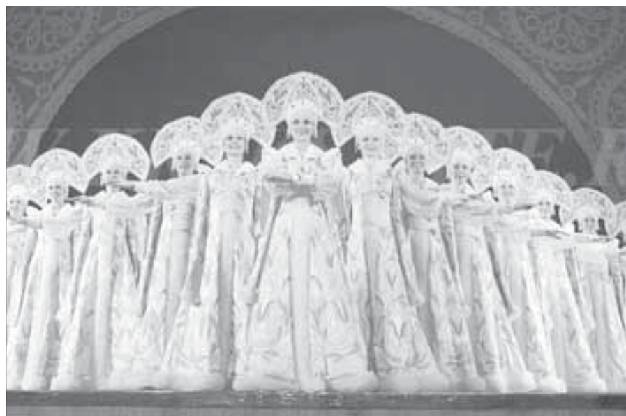
Красноярский государственный ансамбль танца Сибири носит имя Годенко

1 мая, в день рождения Михаила Годенко, коллектив ансамбля, официальные лица и гости края примут участие в церемонии возложения цветов к памятнику на кладбище Бадалык и у мемориальной доски на доме, где жил мастер.