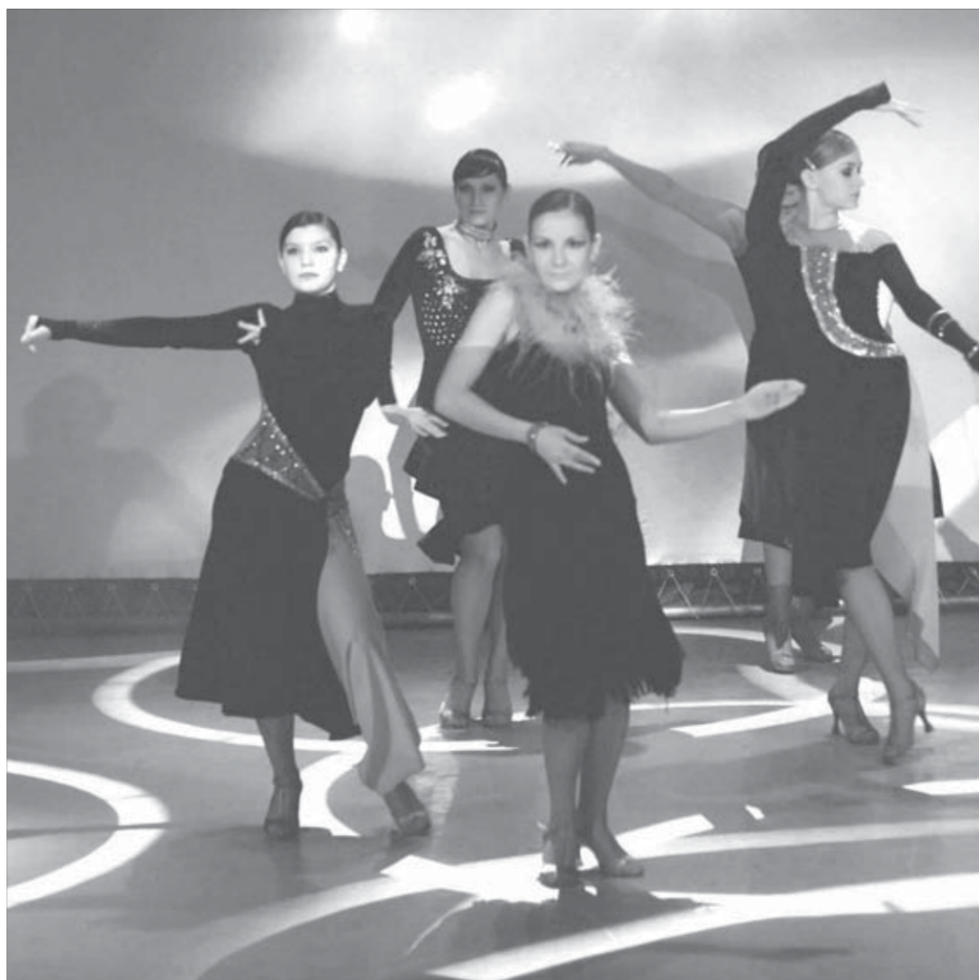
"Фристайлу" 15 лет! Впереди немало успехов