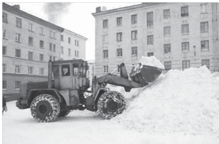
Снег надо убрать до новой пурги