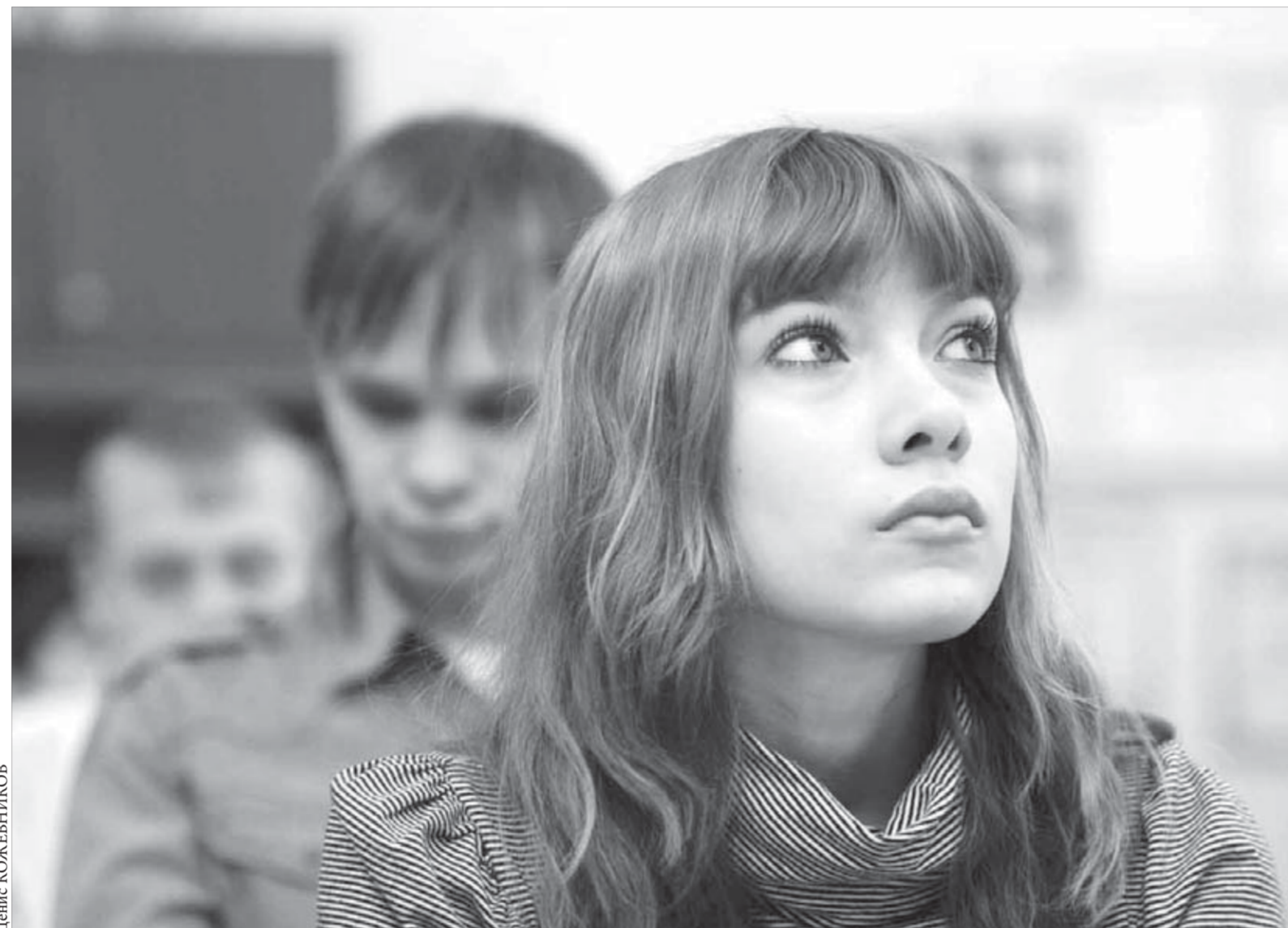
Репетиция ЕГЭ только начинается

Норильские госавтоинспекторы просят очевидцев сообщить подробности ДТП, в котором пострадал несовершеннолетний пешеход. ДТП произошло 9 апреля около дома №45 по улице Хантайской. Очевидцев и водителя-участника происшествия просят обратиться в автоинспекцию. Отметим, что за последние несколько дней в Норильске участились случаи ДТП, в которых страдают дети. Последний случай произошел позавчера – на перекрестке улиц Талнахской и Московской автомобиль Toyota сбил 10-летнюю ученицу лицея №1, переходившую дорогу, несмотря на запрещающий сигнал светофора.