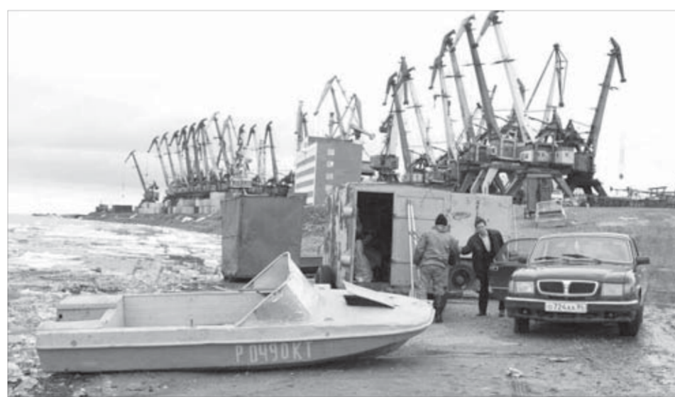
Енисейский речной надзор отказался от норильчан

— Наши требования были законными, что признал и Красноярский краевой суд, рассматривавший кассационную жалобу Норильского участка ГИМС. А то, что суда, снятые по нашему требованию с учета в ГИМС (в полном согласии с требованиями закона!), не хочет брать под свой надзор Енисейское управление государственного морского и речного над-