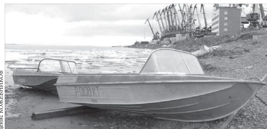
Выброшенными на берег могут оказаться не только лодки, но и судовладельцы

“Морской узел” – так была озаглавлена статья, опубликованная в “ЗВ” 27 ноября 2008 года. В ней рассказывалось об обвинениях, выдвинутых Дудинской транспортной прокуратурой в адрес норильского участка Государственной инспекции по маломерным судам (ГИМС). После публикации судебные процессы против ГИМС были приостановлены, но недавно вновь возобновились.