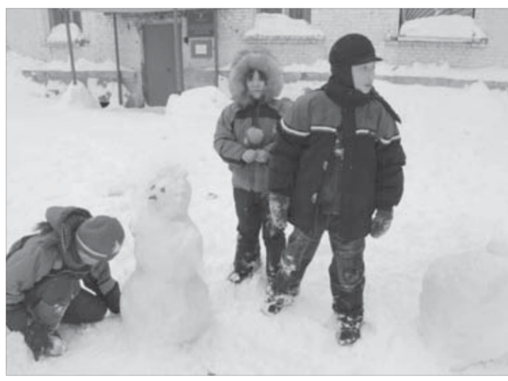
Ветер стих. Можно слепить снеговика

Как сообщили "ЗВ" в Таймырском центре по гидрометеорологии и мониторингу окружающей среды, циклон, бушевавший с понедельника, практически ушел с Таймыра. На очереди — новый.