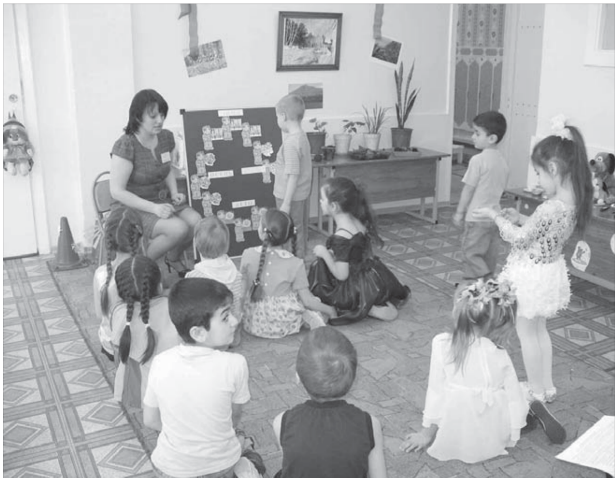
Знакомство с месяцами на занятии по математике

Запись детей в “Маленькую страну” на следующий учебный год уже началась. С условиями приема можно ознакомиться по телефонам 44-29-60, 44-29-63.