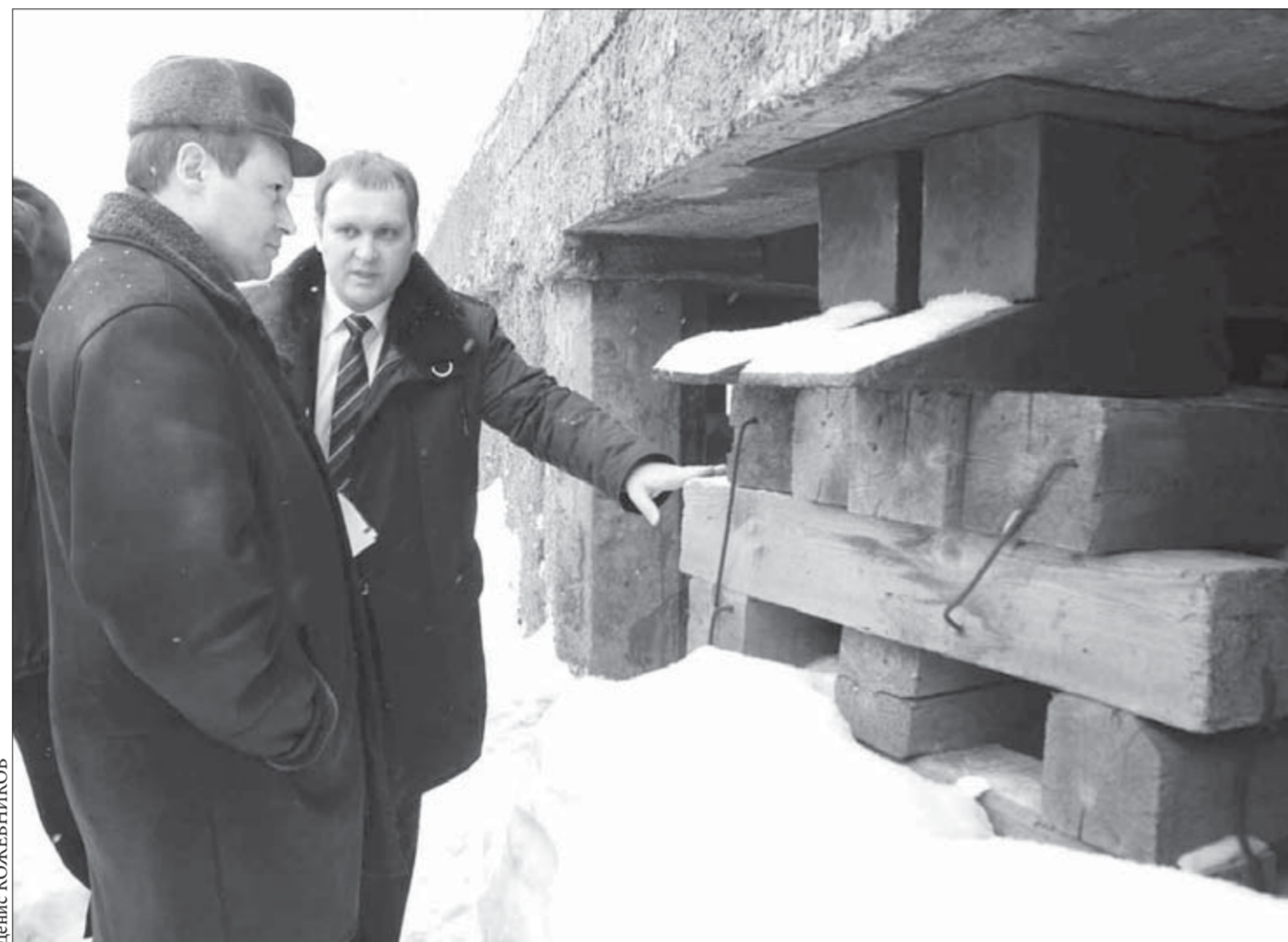
Аварийному дому поставили подпорки