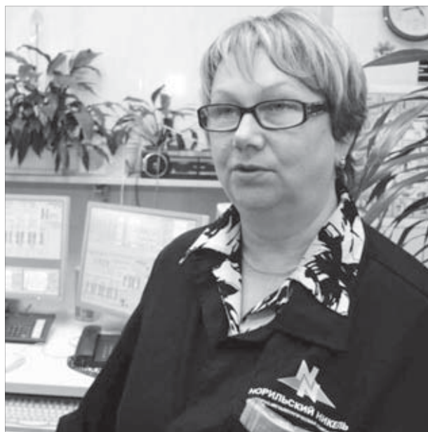
Сегодня ее рабочее место у экранов мониторов

– Я с ней работал, когда еще был сменным мастером. Помню, конец 83-го, буквально последняя смена перед Новым годом, все в напряжении – план, качество... А она накануне вышла из отпуска. На первом кобальтовом переделе у нас какие-то вентили не держали, и давление пульпы могло передавить в линию воды для промывки свечевых фильтров. Чтобы этого не случилось, применяли такую схему: мыли фильтры “на себя”, в пачук, а не на карбонатный передел. Она этого не знала, по смене не передали, моет, как положено, по инструкции. Прибегает аппаратчик товарного передела: “У меня все черным-черно идет с