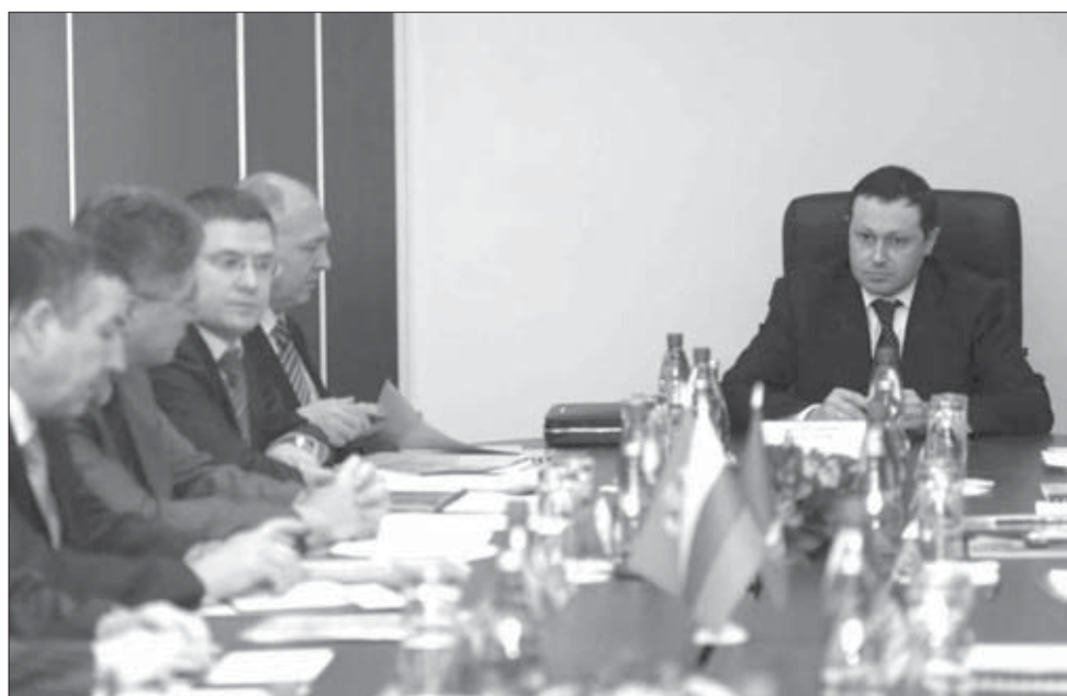
Вся исполнительная власть

Председатель краевого правительства подчеркнул решимость регионального кабинета министров сделать все возможное, чтобы норильчане пережили сегодняшнюю экономическую ситуацию с наименьшими негативными последствиями.