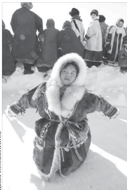
Таймырцы ждут гостей

Добавим, что в этот день по зимнику на Енисее введут ограничения по движению транспорта. А добраться от центральной праздничной площадки до этнического стойбища можно будет специальными автобусами.