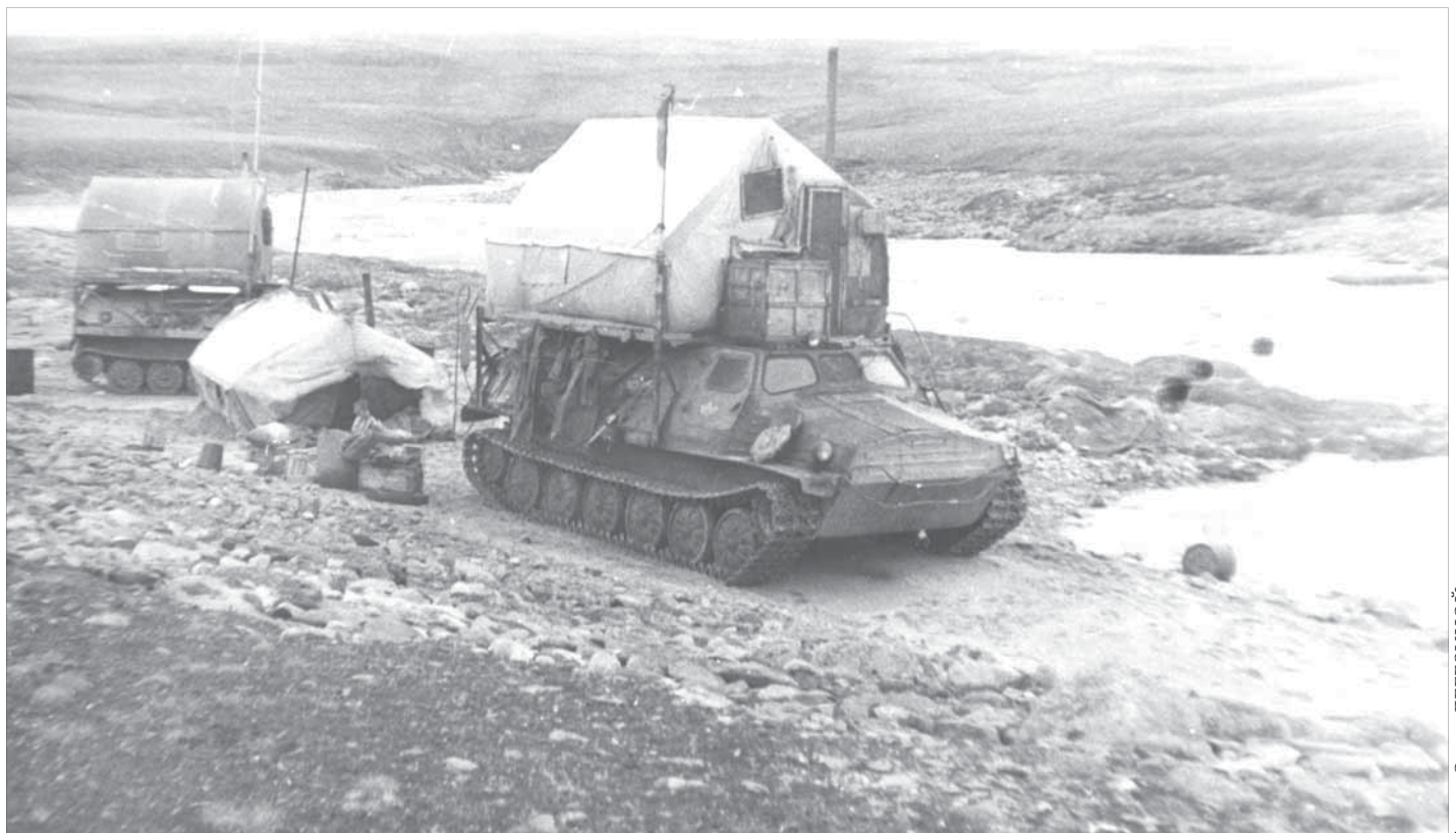
Почему палатки на вездеходах? Так теплее

Она считает, что работа у нее творческая и как геологу ей повезло. Приехала в место, где зарыто много кладов. Причем приехала совершенно самостоятельно, к родственникам в гости, посмотреть, что это за город такой – Норильск. Пришла в “Норильскгео-