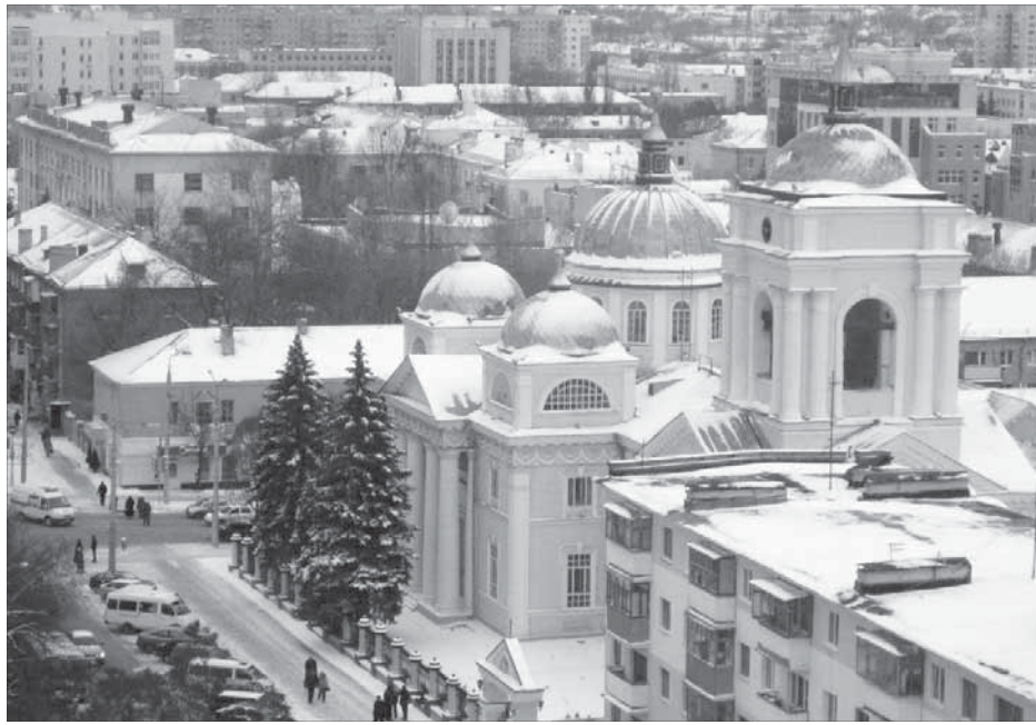
Смотришь на собор – душа ликует

В последнее время только и слышишь от норильчан: "Белгород, Белгород, Белгород...". Кто-то из наших живет там уже давно, кто-то перебрался в этот город недавно, есть немало и тех, кто лишь собирается переселиться на берега Северного Донца. И потому нет, наверное, более "норильского" города на материке, чем Белгород. Чем он живет сегодня, узнавала вездесущая Лариса ФОМЕНКО.