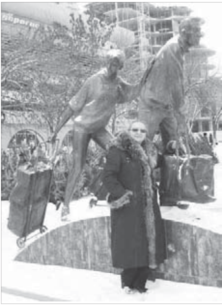
Снимок на память с "челноками"

Город, о котором с таким восторгом и восхищением говорят в Норильске, действительно того заслуживает. Увидев его белым, заснеженным, могу представить, каким Белгород, который считается самым зеленым и благоустроенным городом России, предстает взору живущих там и приезжающих погостить летом. Сегодня этот областной центр, расположенный на реке Северный Донец, развивается стремительно по многим направлениям. Машиностроение – один из коньков местной промышленности. Белгородчина также известна в России и за ее пределами энергетической, химической, электротехнической, приборостроительной, радиоэлектронной и другими отраслями. Прекрасные перспективы у производства стройматериалов, главным образом цемента.