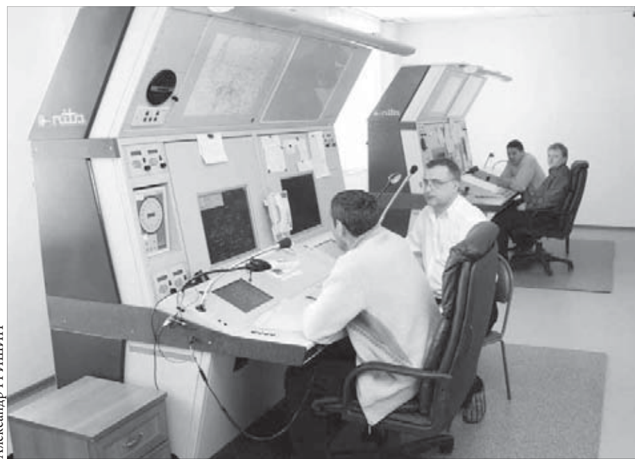
Все на высшем уровне