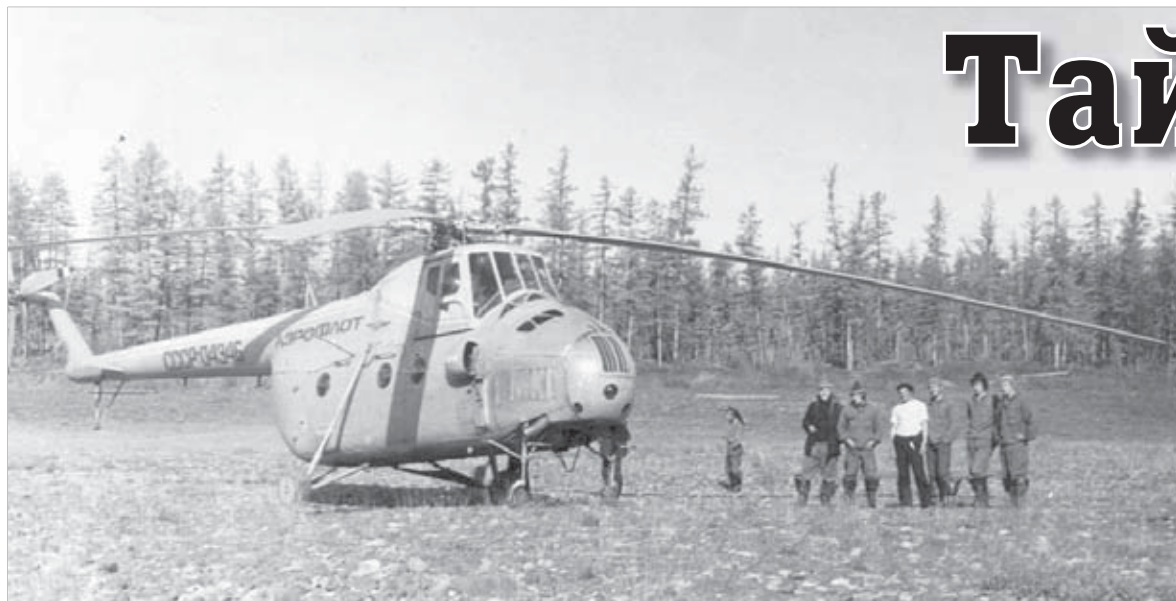
Друг геологов – вертолет