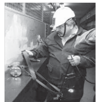
Горняк должен быть уверен в исправности самоспасателя и фонаря

– Тогда приходится заказывать у слесаря новый, – объясняет ламповщица. – Если дело происходит в ночную смену, когда слесарь не