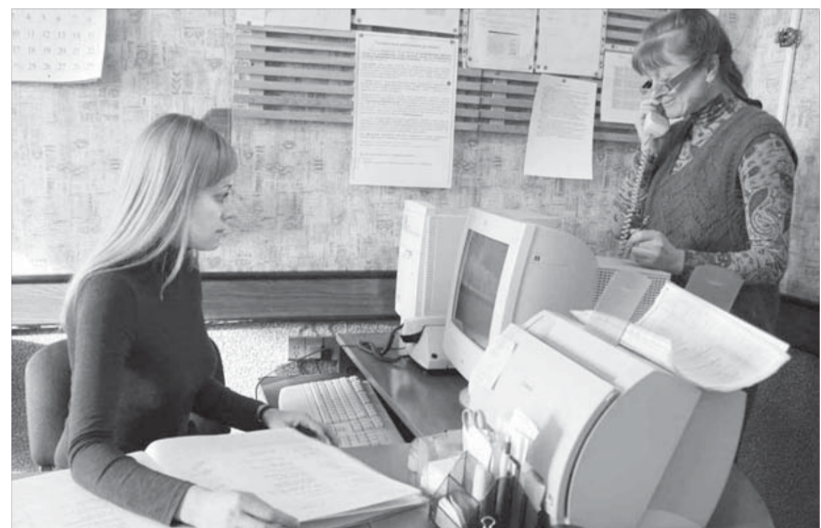
Все происходящее четко документируется в журнале и компьютере