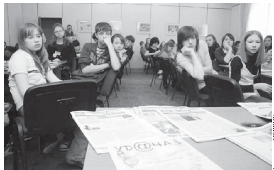
Тематика школьных газет заставила задуматься

Конкурс "Лучший в профессии, лучший в бизнесе" станет ежегодным городским мероприятием для молодежи. В нынешнем году он проводится с 25 марта по 24 ноября. В нем могут участвовать молодые люди в возрасте 14–35 лет.