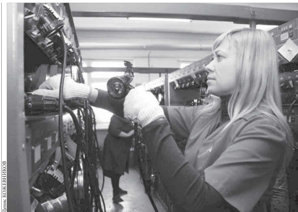
Вставляем и поворачиваем вправо. Все просто? Как бы не так!

Все впечатления и идеи ребята отразили в первом выпуске собственной газеты проекта "Таймырская зебра". Со временем она обещает стать регулярной, как и сессии в школе будущих журналистов.