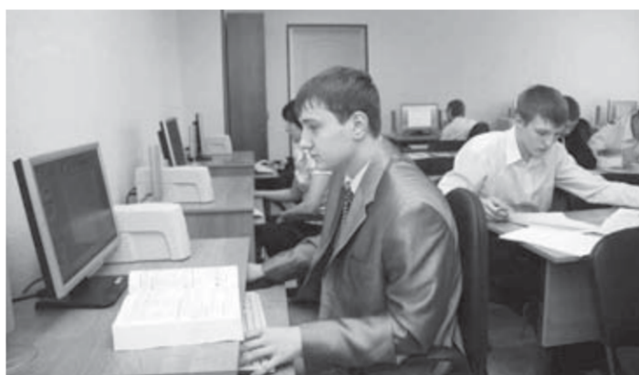
В медиатеке училища