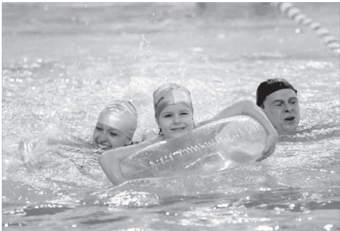
К морю готовы!