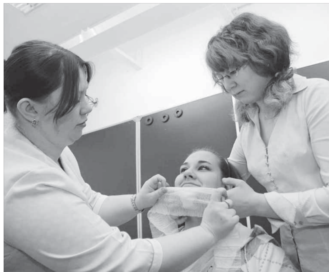
Основы медицинской подготовки