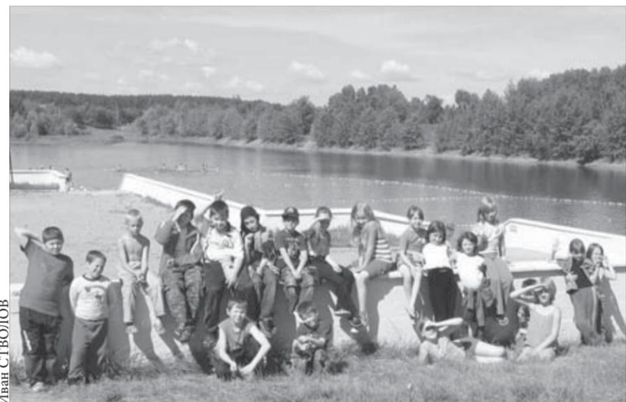
Здесь можно и отдохнуть, и здоровье поправить

массовых мероприятий. Для школ приобретают дезинфекционные средства для обработки помещений и инвентаря. В детских садах идет профилактика гриппа среди воспитанников. В медучреждениях развернуты специализированные стационары (отделения) для госпитализации больных ОРВИ.