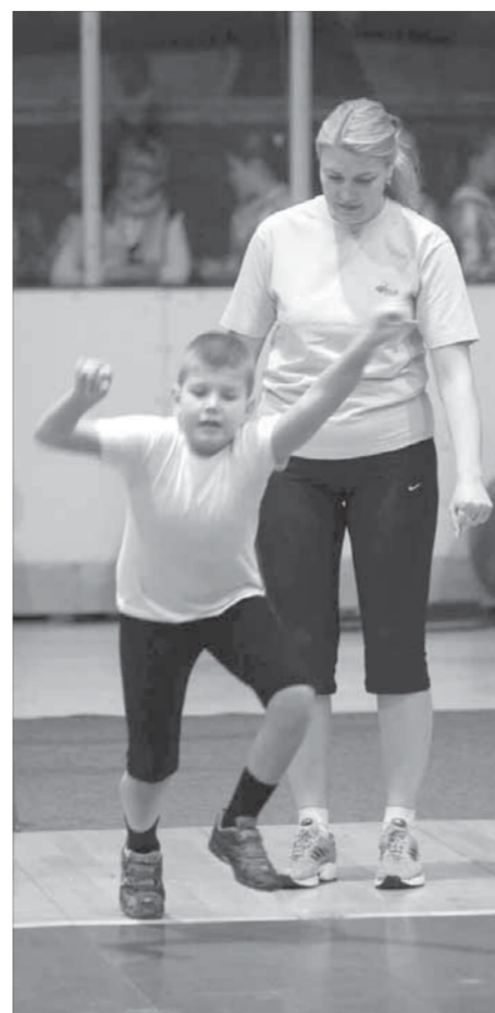
Я покажу как, мама

За участие в конкурсе наградили всех без исключения. Детишки получили игрушки, родители – памятные подарки, а все вместе – массу положительных эмоций, которые еще скажутся в будущем, вдохновив участников на новые спортивные достижения. Корпоративный турнир "Папа, мама, я – спортивная семья" планируется на сентябрь, но точную дату старта пока не определили.