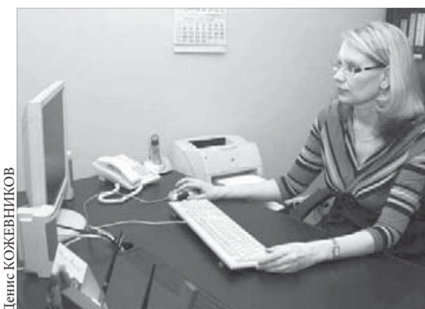
В Пенсионный фонд поступает много вопросов

Выработаны унифицированные формы справок. Центральный банк РФ утвердил перечень сведений, которые должны быть включены в справку, выдаваемую владельцам материнского сертификата. Аналогичная работа велась с Министерством юстиции и Федеральной нотариальной палатой. Разработаны рекомендации нотариальным палатам по вопросу оформления обязательства о распределении долей собственности в приобретенной квартире между всеми членами семьи после снятия обременения. Так что проблем с получением документов в банках и у нотариусов быть не должно. Если такое происходит, сообщайте в Пенсионный фонд.