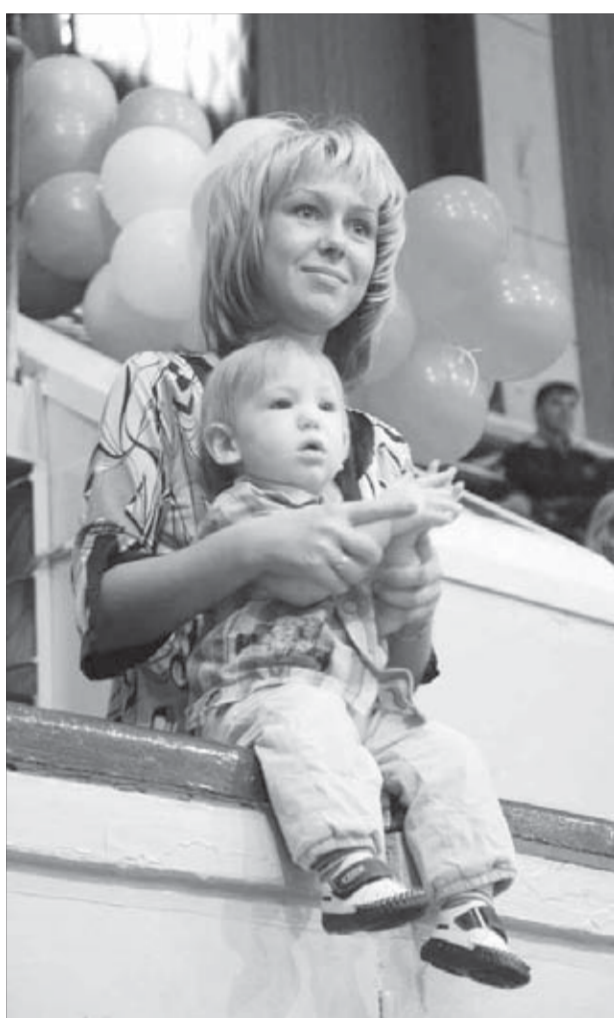
Новые участники подрастают

В Норильске прошел семейный спортивный конкурс "Папа, мама, я – спортивная семья". Призерам предстоит отстаивать честь Заполярного филиала на корпоративном турнире, который по традиции пройдет осенью на побережье Черного моря.