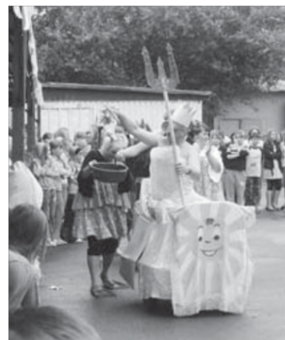
Что ни день – то праздник

Несмотря на благополучные показатели минувшей недели, Роспотребнадзор по городу Норильску отложил принятие решения об отмене ограничительных мероприятий по ОРВИ и гриппу до следующего понедельника.