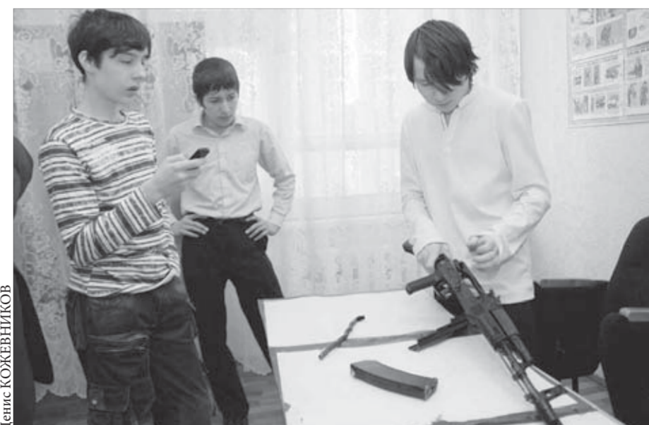
Разобрать автомат? 25 секунд