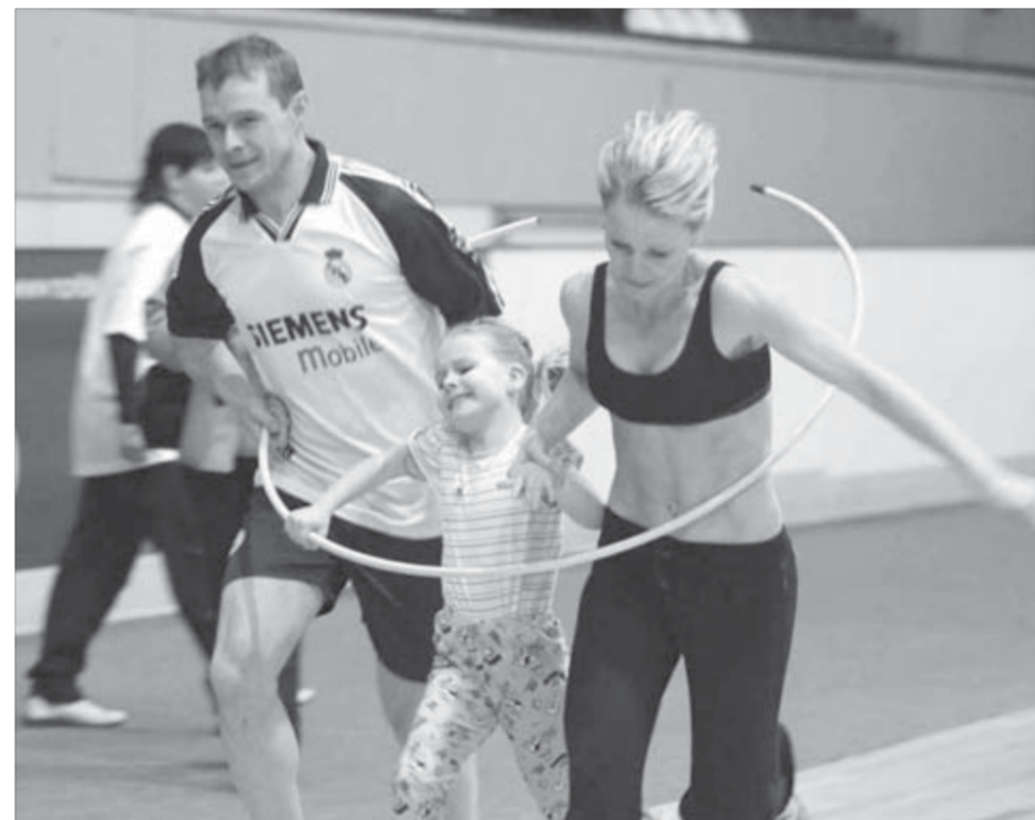
Здесь равнялись на младших