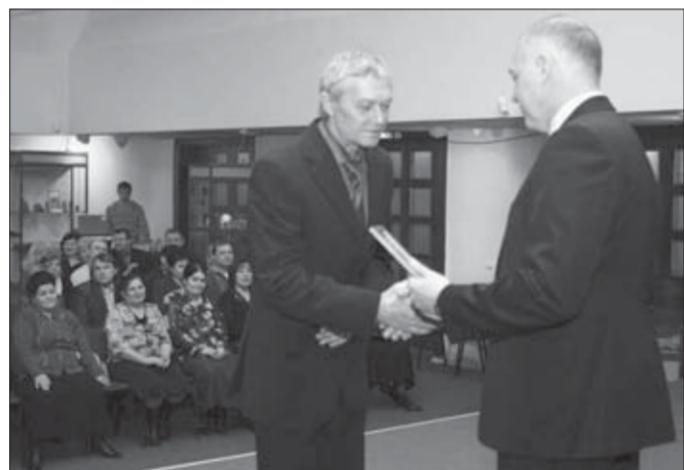
Мужчинам - рукопожатие вместо цветов

Нужные работники слесари и плотники. А также маляры, электрики, прорабы, паспортисты и генеральные директора управляющих компаний. В честь Дня работников торговли, бытового обслуживания населения и жилищно-коммунального хозяйства в Музее истории освоения и развития НПР награждали "именников".