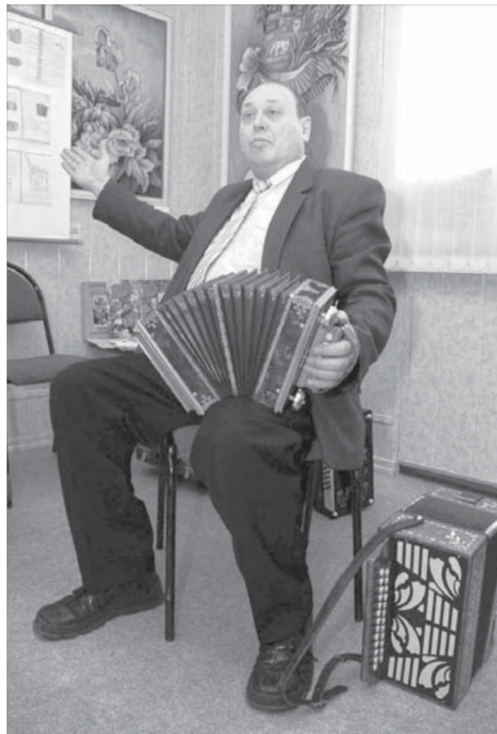
Эх, раззудись, плечо!