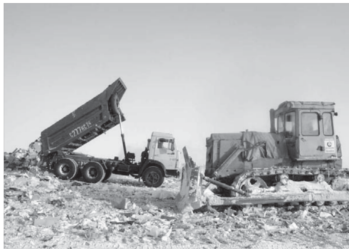
За день на свалку заезжают сотни машин с мусором

Мусора на планете становится все больше. В особо продвинутых городах и странах его сжигают в печах.