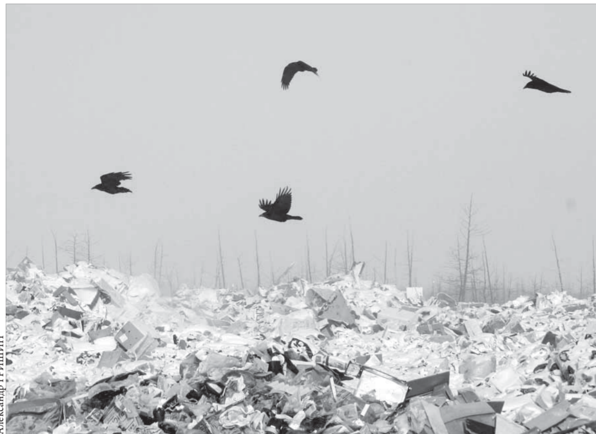
Для кого - отходы, для кого - место пропитания