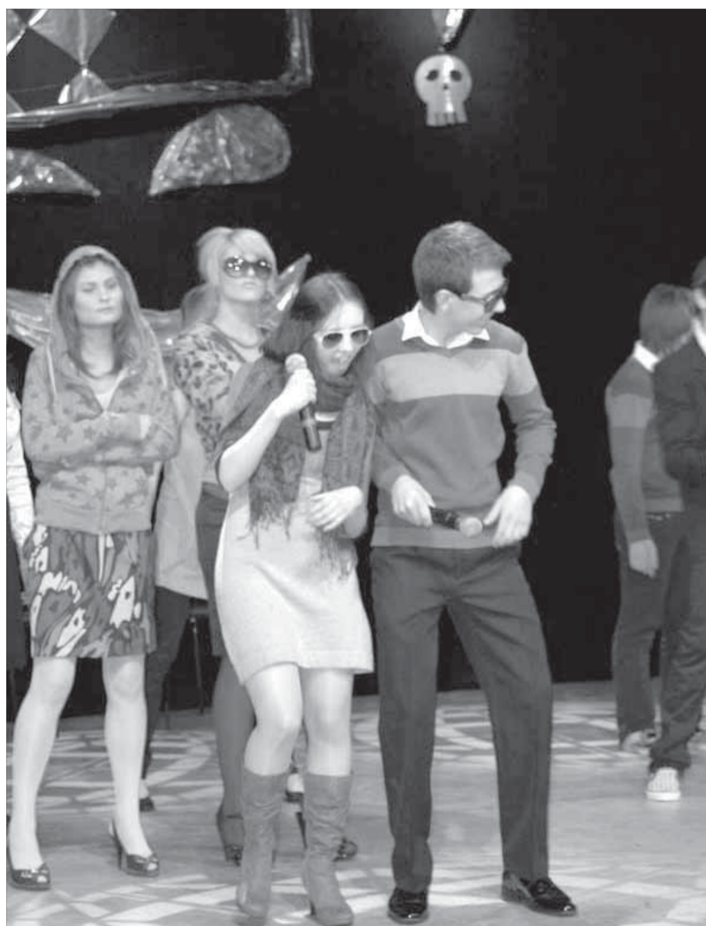
Энергия команд бьет ключом

Большой зал Городского центра культуры вновь собрал любителей норильского КВН. И на этот раз зрителей ожидало немало сюрпризов.