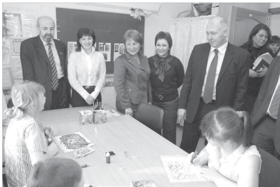
Центр «Виктория» – мир детства

Показать центру реабилитации детей и подросткам есть что. «Виктория» – единственное в Красноярском крае учреждение для детей с ограниченными возможностями, в котором помогают ребятам не только поддерживать здоровье, но и дают навыки социальной адаптации. Ребята учатся здесь выполнять поильную домашнюю работу, занимаются физкультурой, что позво-