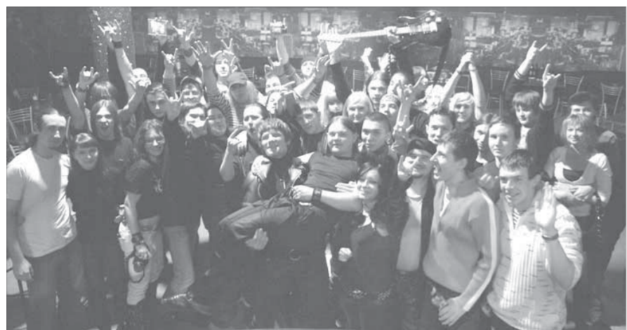
На руках у фанатов

сигаретный дым и разговоры: "Ведите здоровый образ жизни: не пейте спиртного, слушайте панк-рок..."