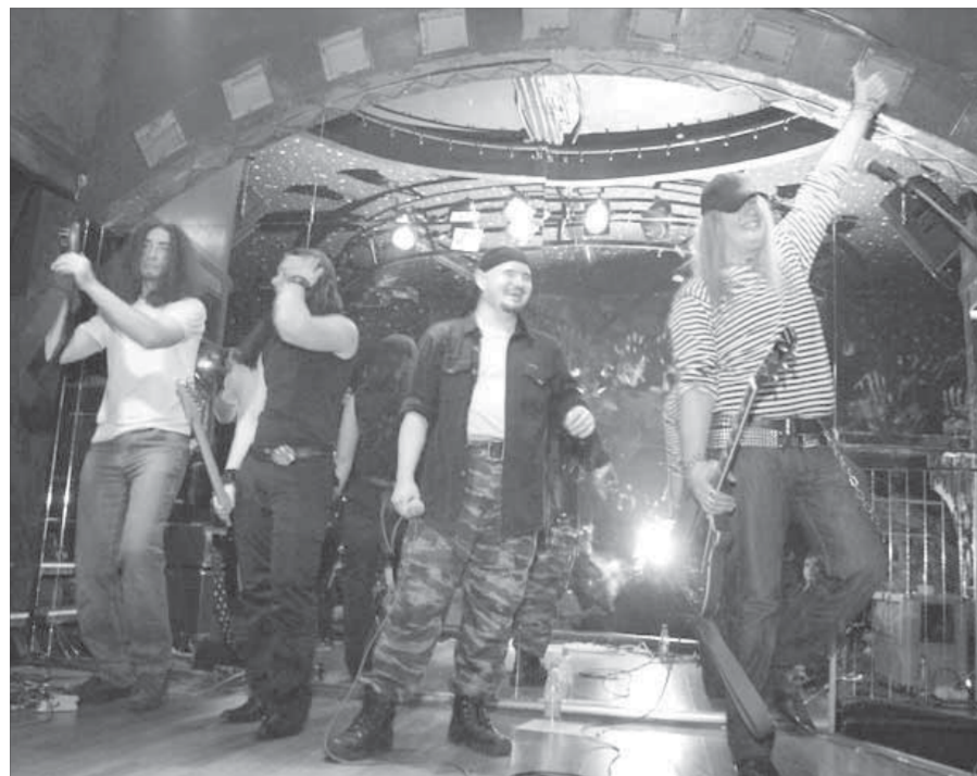
С первым юбилеем!