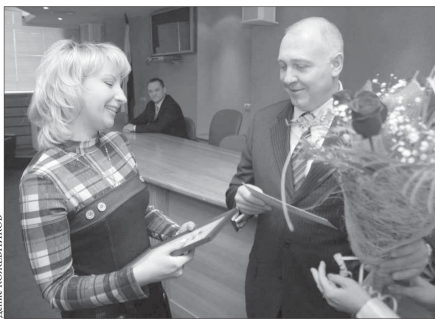
Заслуженный букет от мэра