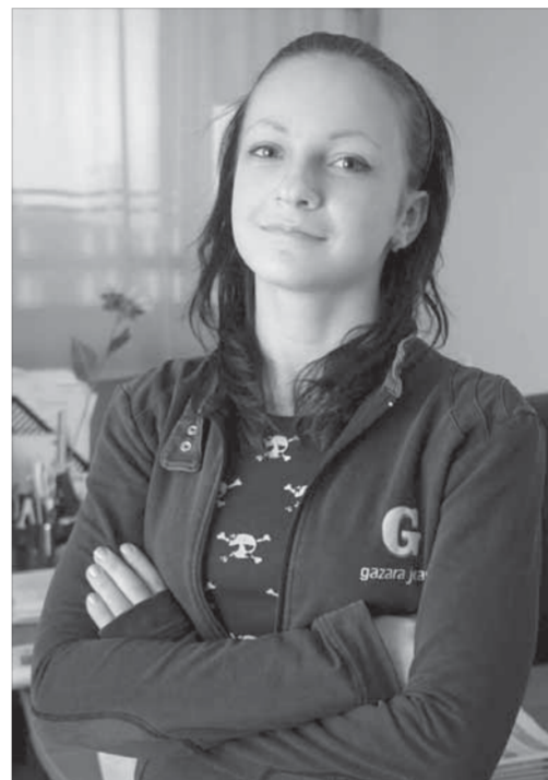
Главное – реализовать полученные знания

Поступить (моя специальность "Государственный и муниципальный специалист") оказалось несложно. Сложнее учиться. Зачастую многие уверены, что учеба в техникуме не представляет особых трудностей, и поначалу относятся к занятиям с прохладцей. Пока не начинают понимать, что не могут справиться с нагрузкой учебного процесса, наверстать упущенное. Вот и приходится одним возвращаться в школу, другим идти в училище. Зря не слушали преподавателей, которые с первых занятий предупреждали о том, как много зависит от отношения к учебе. Кстати, многие преподаватели техникума имеют солидный стаж работы со студентами и являются отличными специалистами.