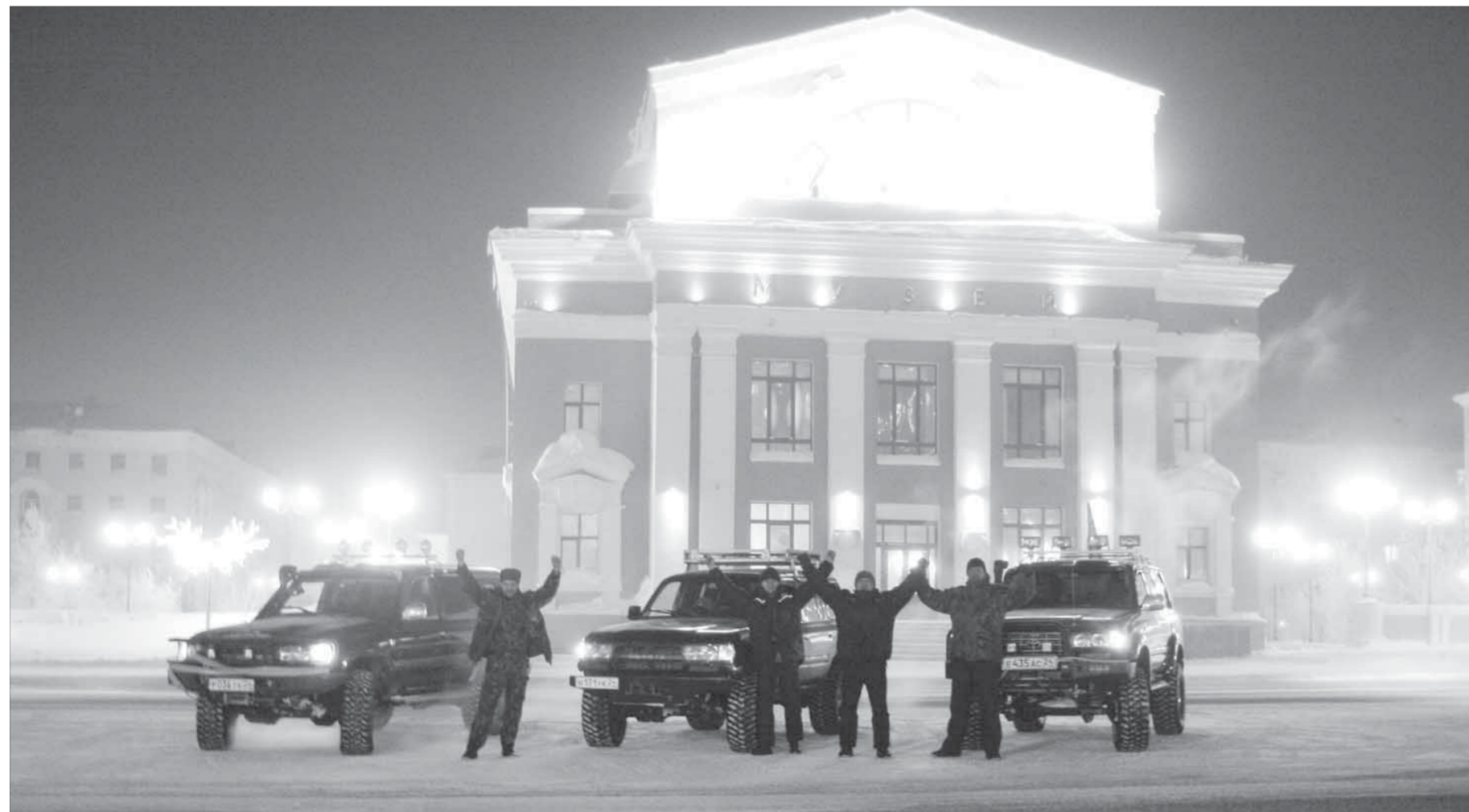
Победа! Это был не маршрут выходного дня

– Забота о пенсионерах – одно из приоритетных направлений государственной политики. Тем более сейчас, в не слишком простые для многих времена. Мы понимаем ответственность, которая лежит на работниках фонда, и прилагаем все усилия, чтобы поддерживать высокий уровень нашей работы. Пенсионный фонд обеспечивал и впредь будет обеспечивать стабильность на территории.