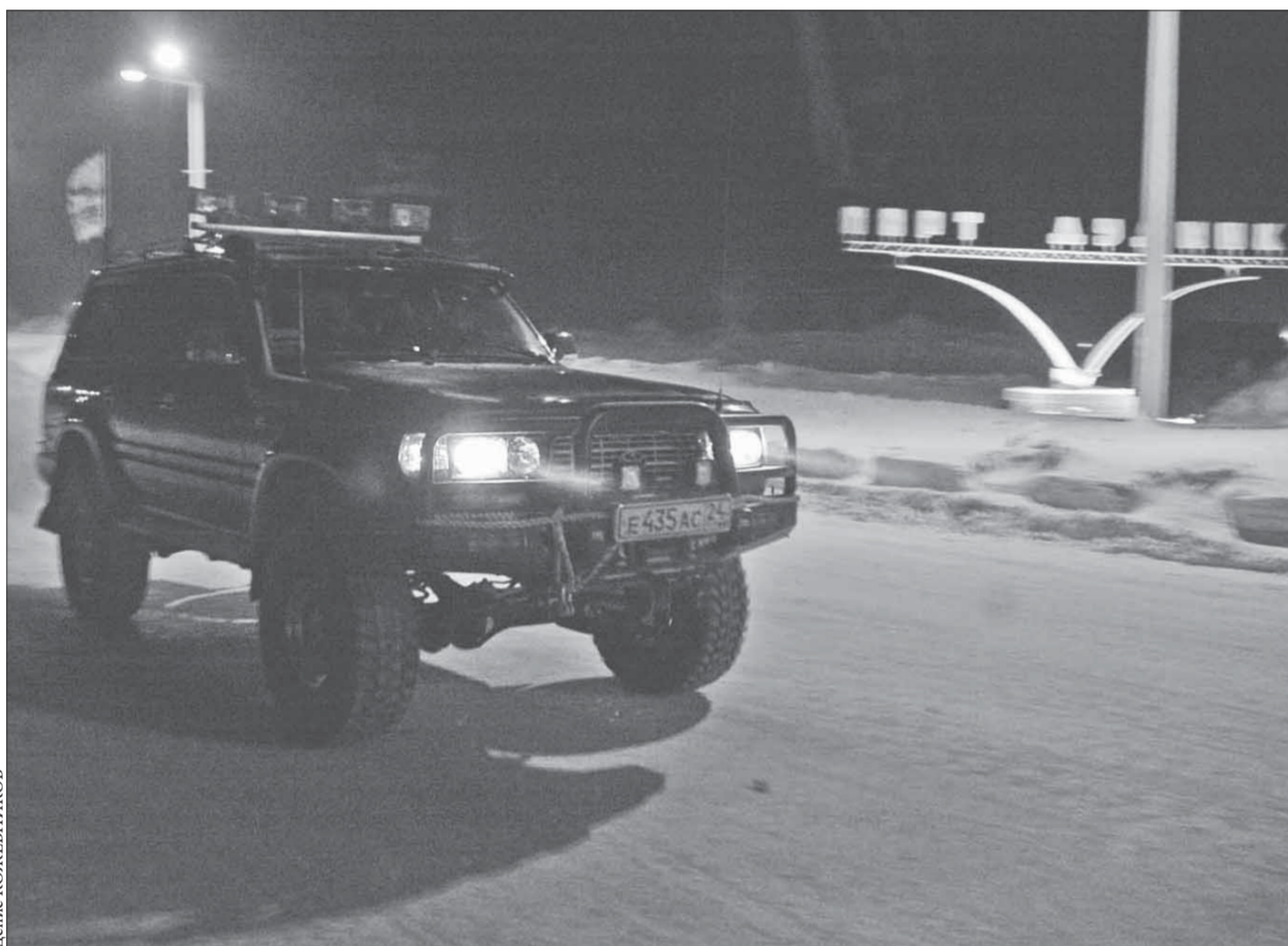
Освоение трассы Новый Уренгой – Дудинка закончено

Самая сложная часть пути для московских джиперов, посетивших Норильск, позади. Они прислали эсмэску с пропускного пункта ванкорского зимника: "Впереди асфальт. Доехали почти без потерь. Спасибо за теплый прием". Покорение Сибири столичными геокешерами не прошло бы столь успешно, если бы им не проторили тропу джиперы из норильского клуба "ВнедорожникOFF".