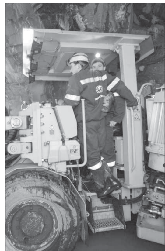
Обучение проходит на дорогостоящей технике

Для компании это весьма актуально. В конце следующего года рудник должен выйти на полную мощность. Парк техники увеличится, а следовательно, возрастает потребность в высококлассных специалистах возрастает.