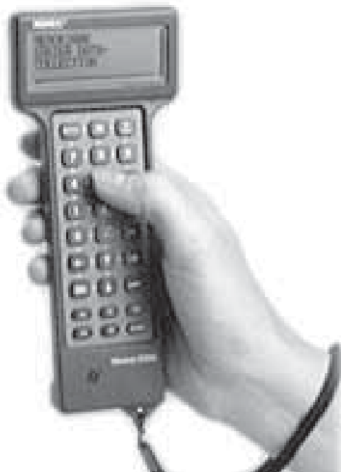
Считывать информацию будет такой прибор