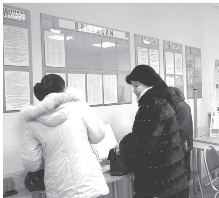
Вакансии разные есть

Стоит добавить, что всего в 2008 году за содействием в трудоустройстве в Агентство труда и занятости по Красноярскому краю обратилось свыше 136 тысяч человек, из которых было трудоустроено 68 тысяч. Остальные смогли найти работу самостоятельно, воспользовавшись банком вакансий службы занятости, который находится в открытом доступе.