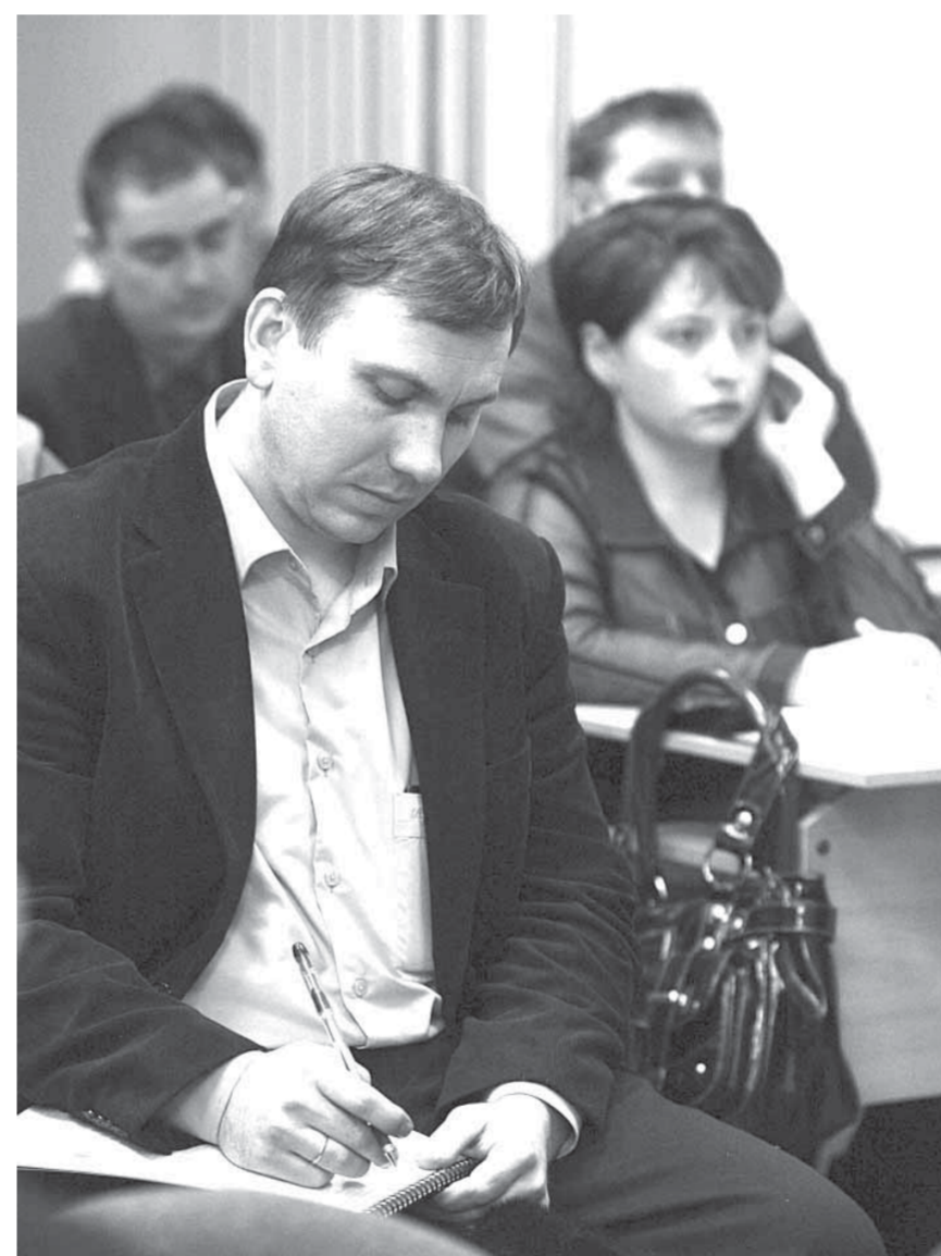
После работы – на курсы