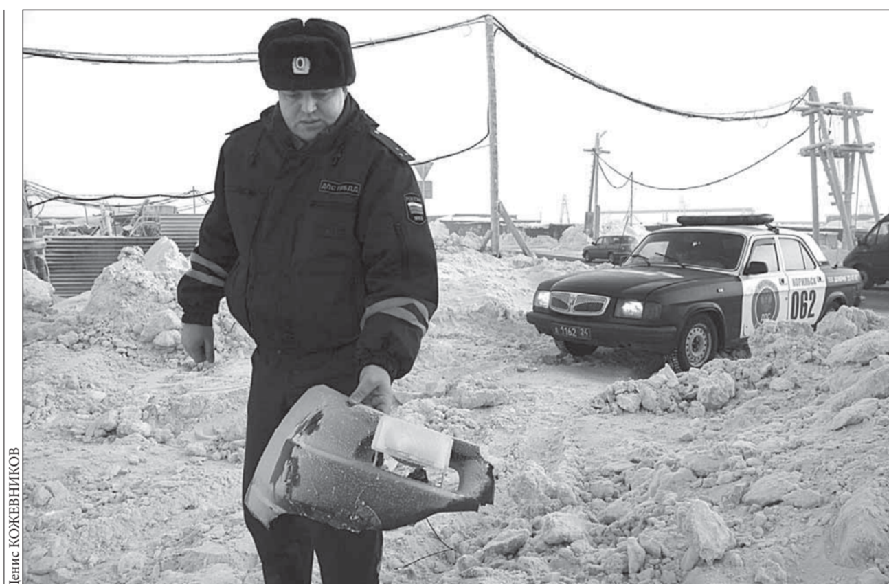
Части иномарки на месте ДТП