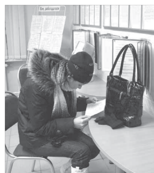
В норильском центре занятости ажиотажа нет

Согласно опросам, сейчас наиболее приемлемый вариант для россиян на случай потери работы — трудоустройство без официального