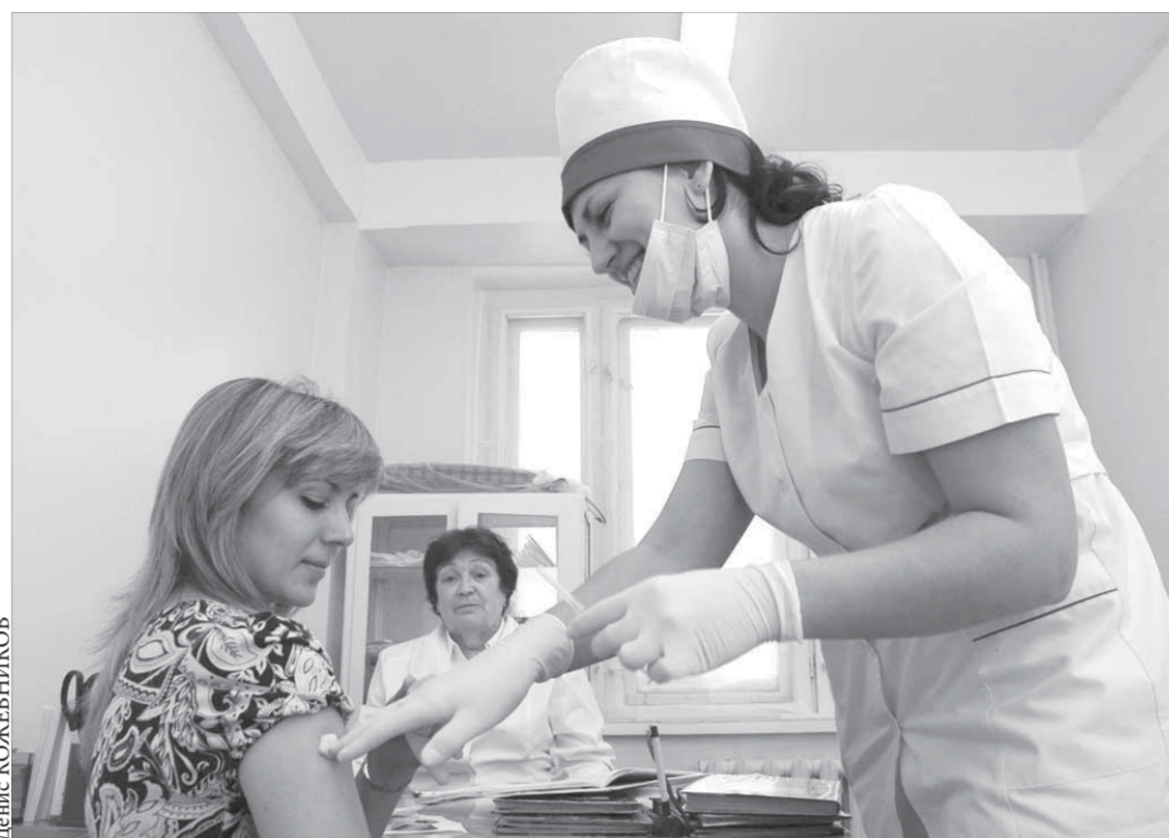
Вакцинопрофилактика проводится с улыбкой