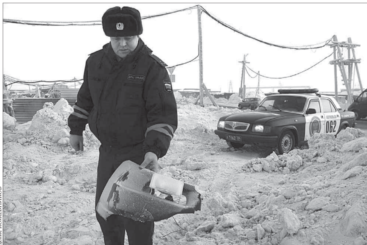
Части иномарки на месте ДТП