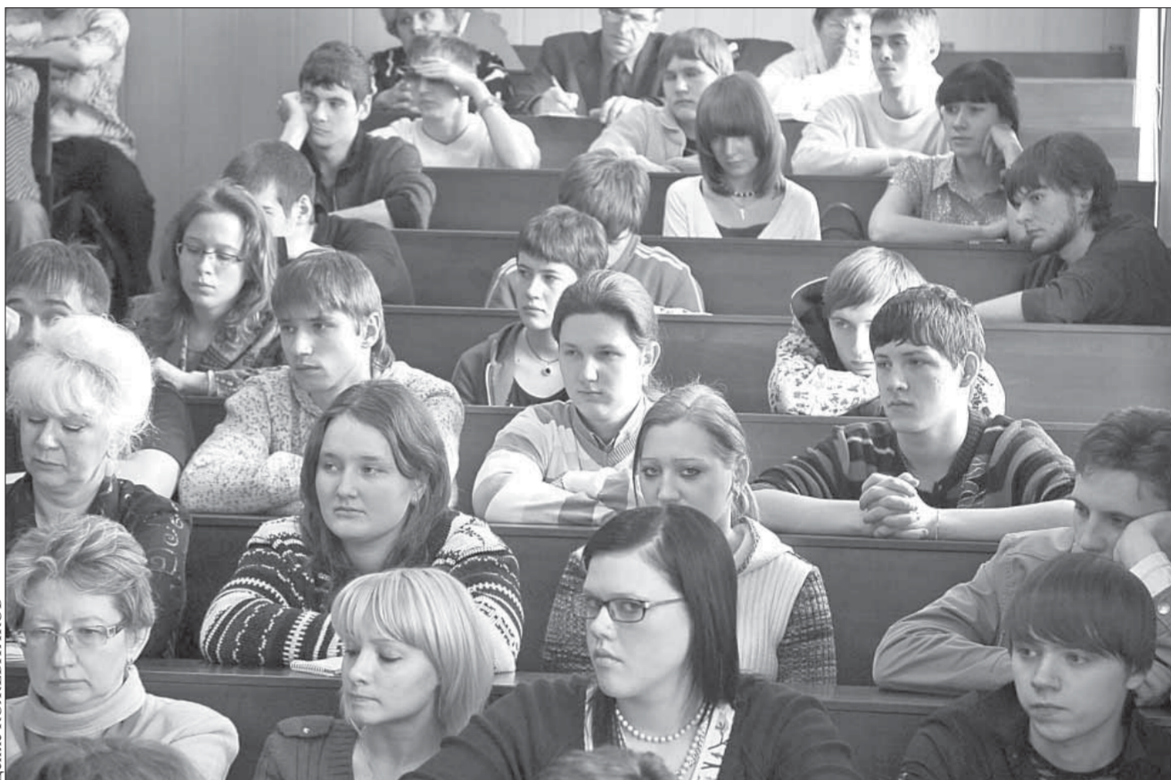
Учеба в период кризиса заставляет задуматься