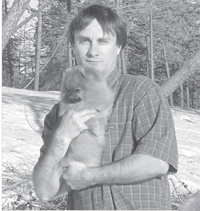
Мужчины тают, когда берут его в руки