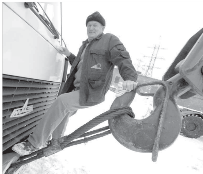
Здесь все водители – универсалы