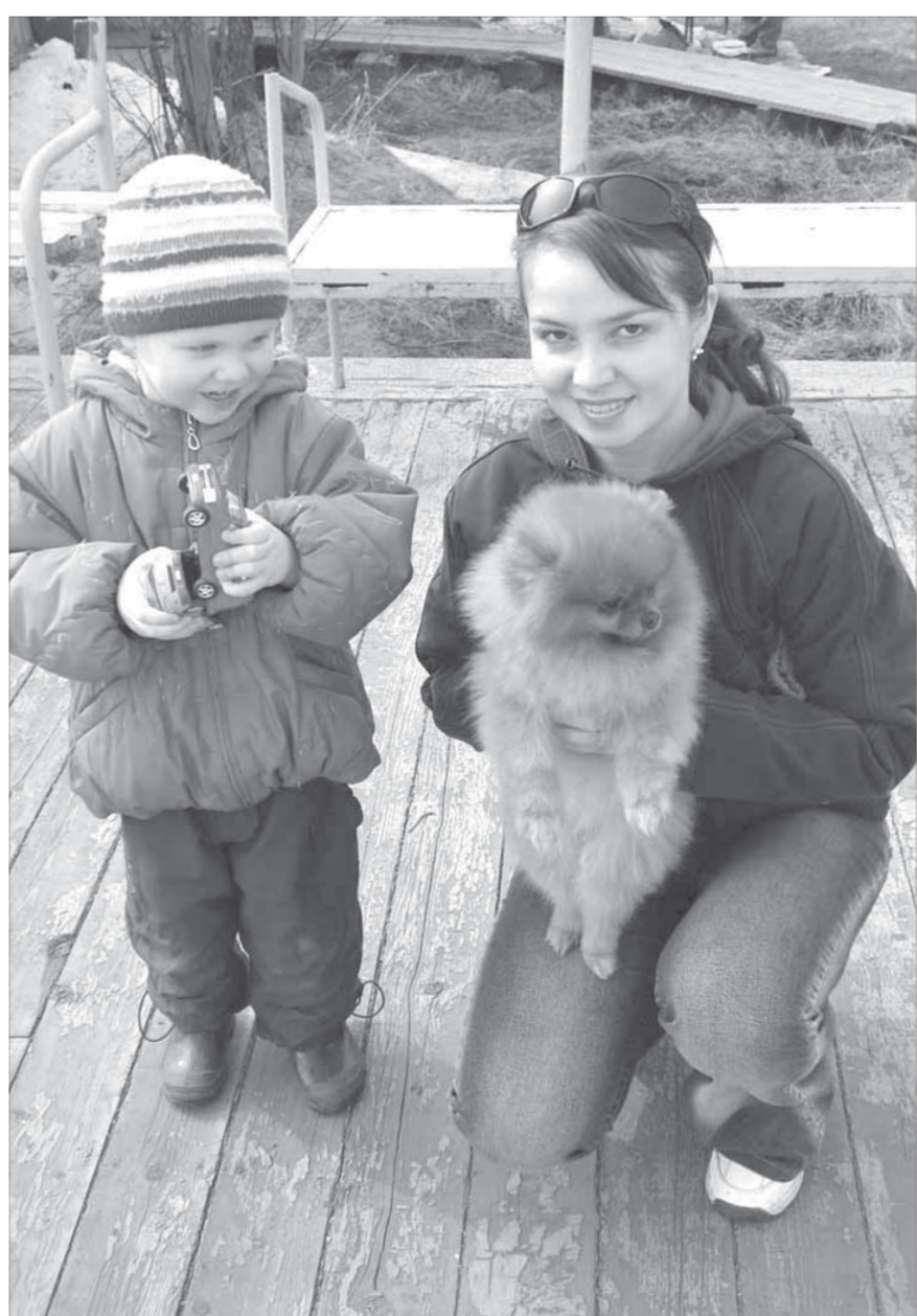
...и друг детей

Мужчины часто упираются, когда жены уговаривают их зайти и “только посмотреть” на чудо природы. С пустыми руками они уже не уходят. При виде “лисички-белки-хозячка” сердце мужчины просыпается и уже не засыпает нежность. Это они потом чаще всего гуляют с домашним любимцем (в сопровождении толпы зевак, разумеется), ухаживают за ним, как за маленьким ребенком, и гордо показывают фото всем знакомым. О, эта улыбка, она не отпускает.