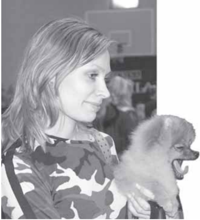
Он делает людей счастливей