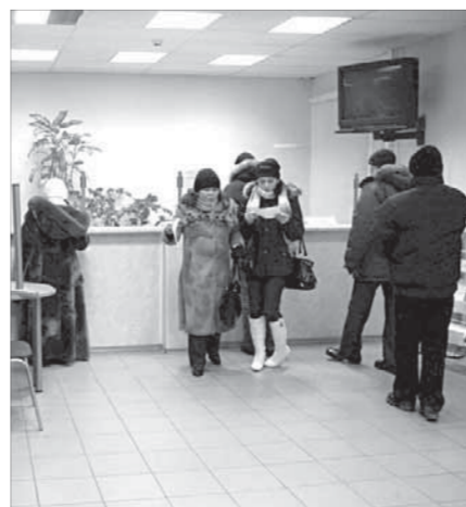
Ажнотажа в центре нет

— Конечно, есть вероятность того, что цифра в этом году окажется выше, — предположили специалисты службы занятости. — В нынешних экономичес-