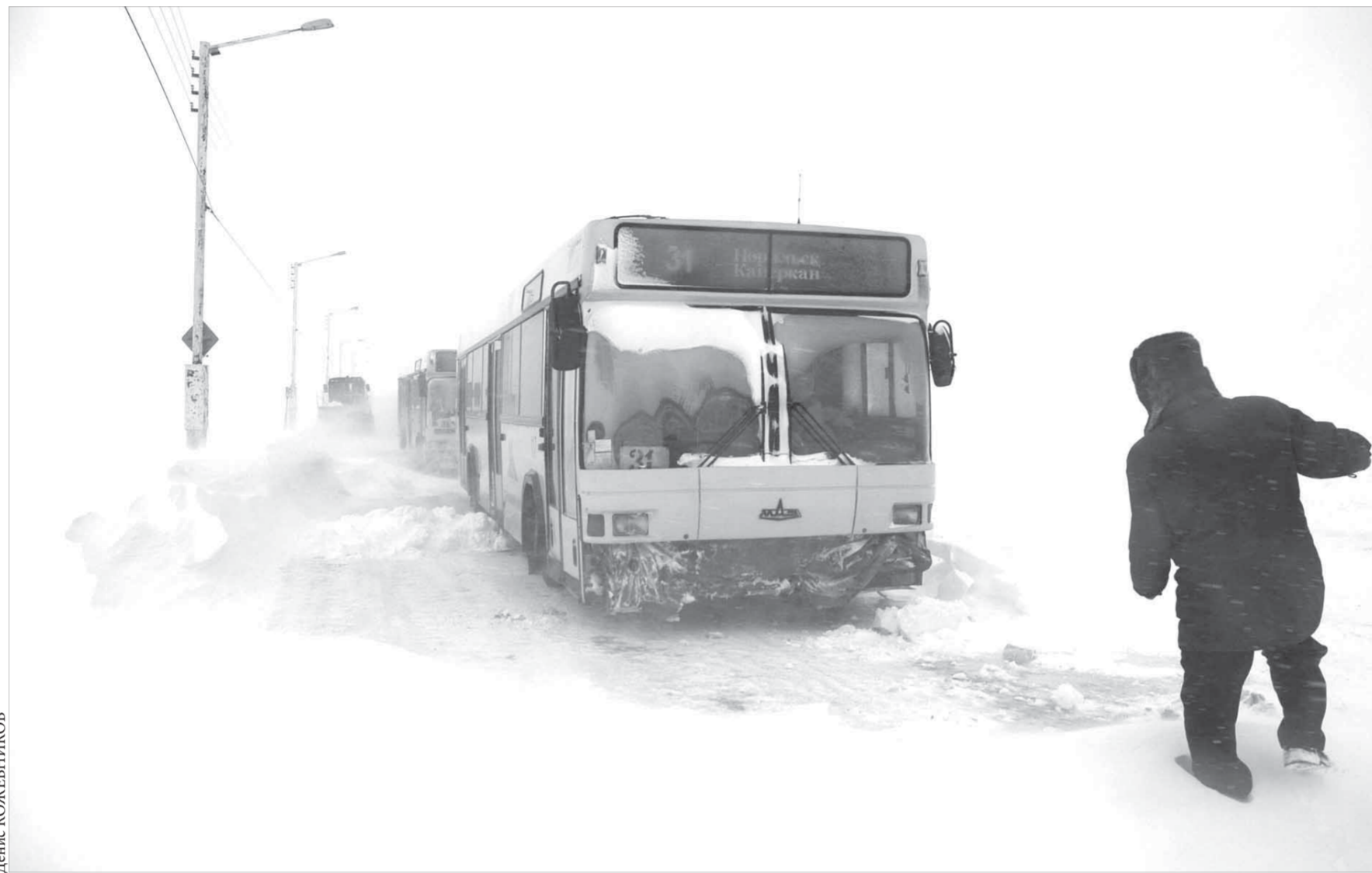
Такого больше не будет?

Завершился второй этап девятого детского конкурса “Дорога в завтра”. К 26 января в городах, где проходил конкурс, будут подведены итоги региональных туров. После этого работы победителей второго тура будут направлены в Москву, где специальное жюри определит победителей корпоративного конкурса (третий тур). Все участники “Дороги в завтра” получат памятные сувениры. Победители второго тура будут награждены медалями и ценными подарками, победители третьего – Гран-при и памятными подарками.