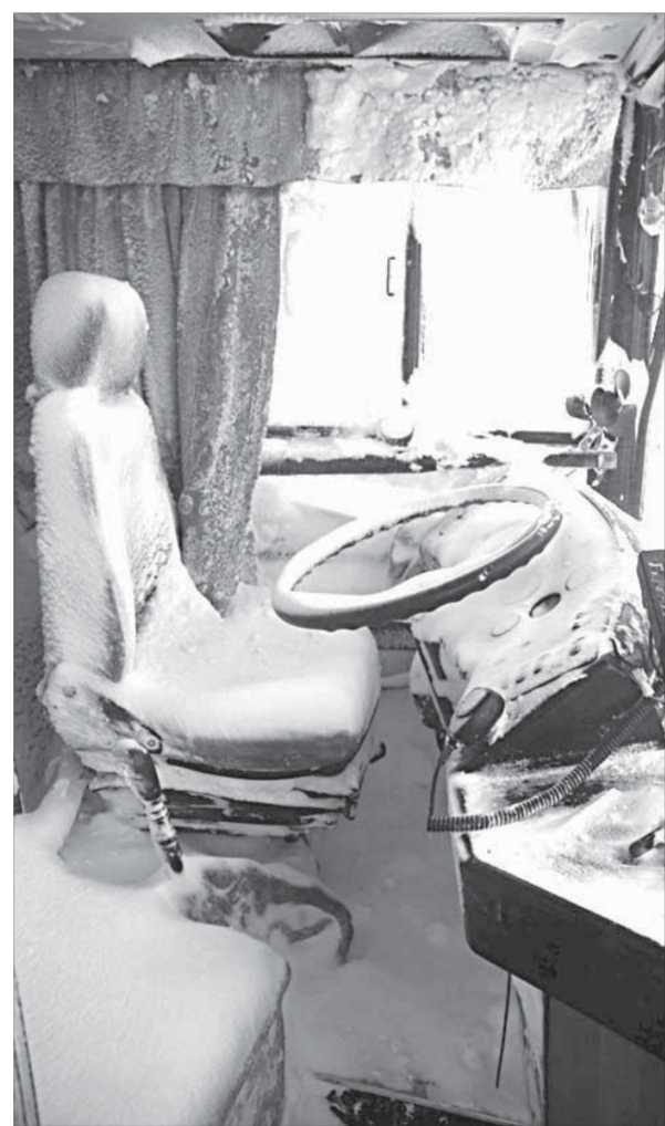
Печальный опыт февраля-2008