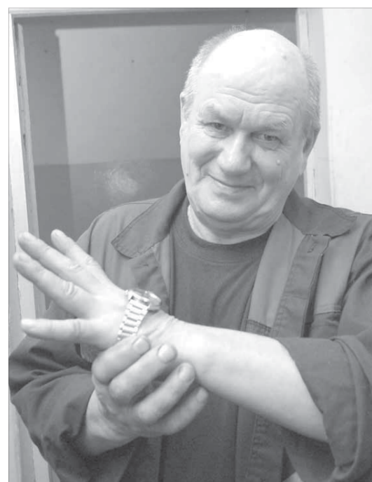
Вообще-то, часы он не носит, они останутся на память