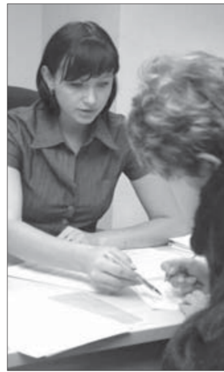
Количество участников программ растет

Всего в настоящее время Норильским филиалом фонда заключено более