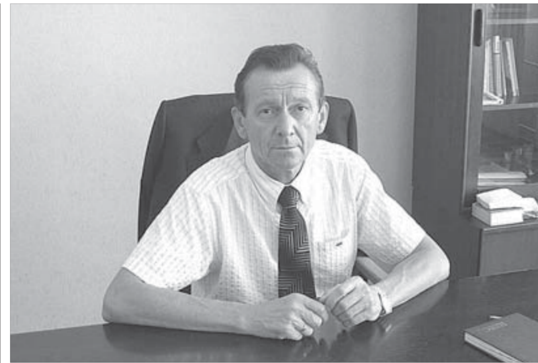
“Уверенности вам в собственных силах и завтрашнем дне”