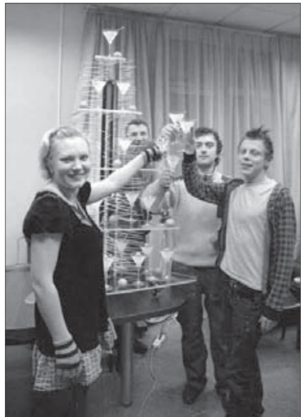
Мы сделали это!