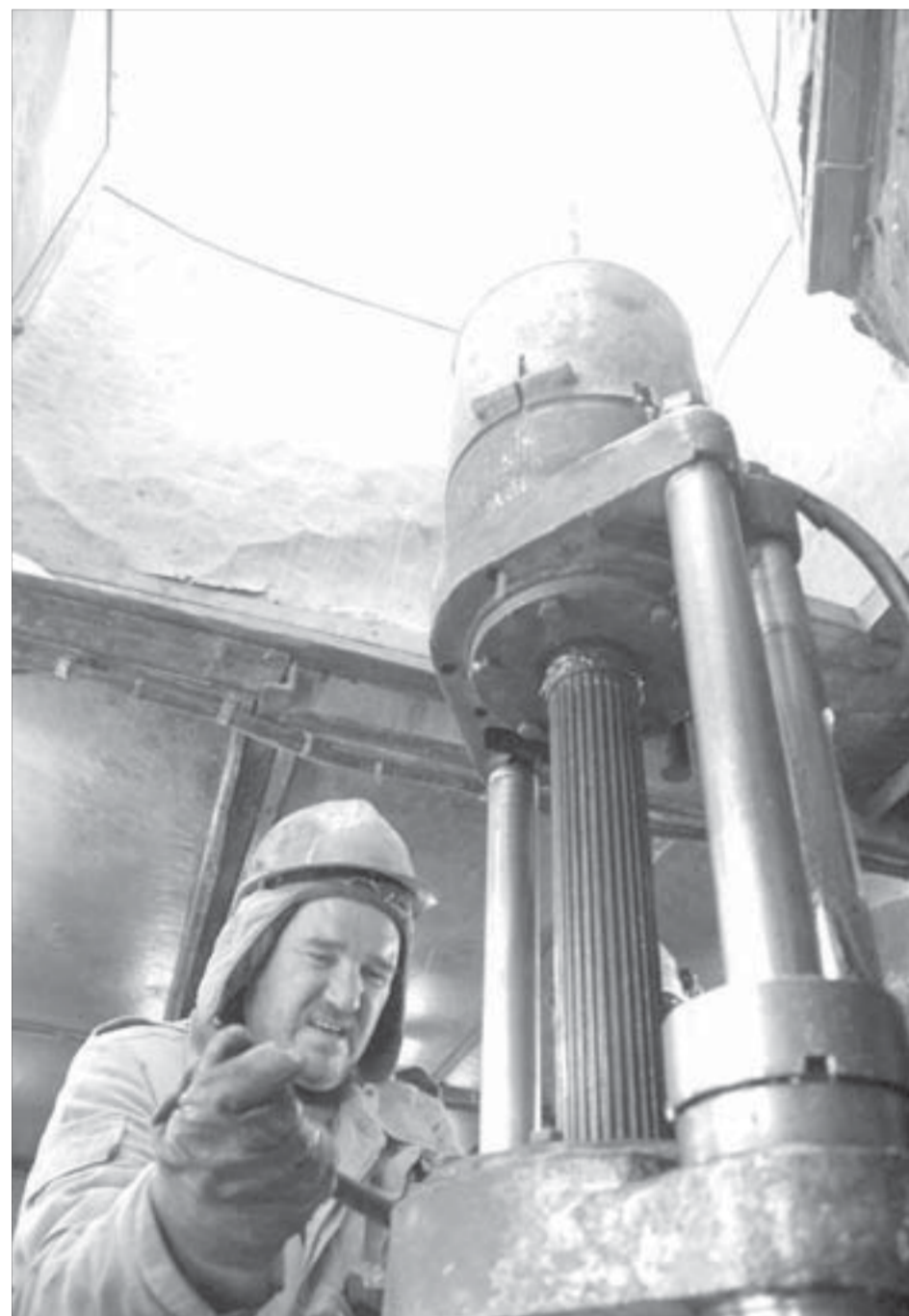
Самоходная буровая установка работает в любую погоду