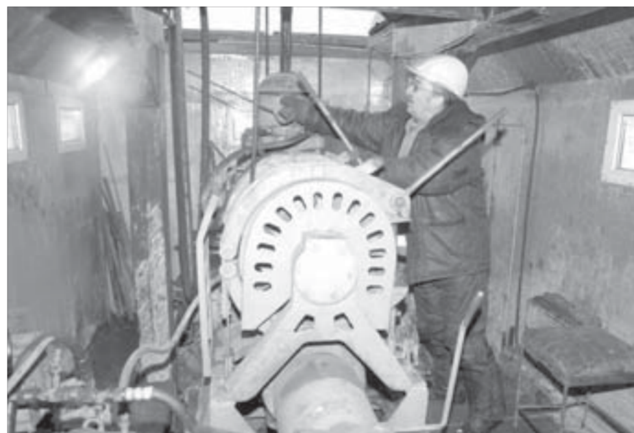
Будут у нас наши килограммы золота

Будут у нас и наши килограммы золота, платины, кобальта, меди и никеля. Буровики рассказывают, что сны им почему-то снятся прозаические: теплый балок или раствор какой-нибудь, но что профессия творческая – этого не отнимешь. Никогда не знаешь, что достанешь из скважины в очередной раз. Шанс сделать открытие есть всегда.