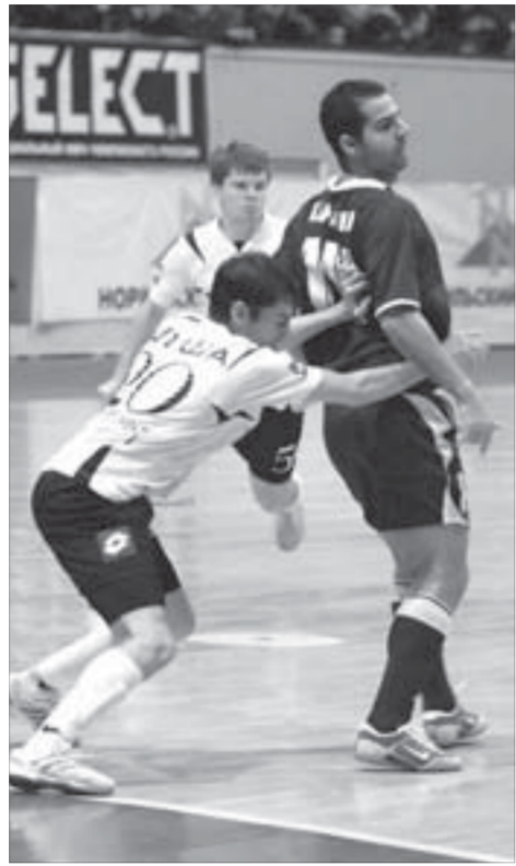
Карьера стоял стеной. Не помогало

Редкий норильчанин, набирая в воскресенье номер справки-автомата, надеясь вечером попасть на футбол. После полудня суток ожидания в Москве уже было потеряно надежды и сами футболисты. Однако чуда под Новый год случаются: ветер в Алькеде стих, и самолет со спортсменами благополучно приземлился в аэропорту Норильск в семь часов вечера.