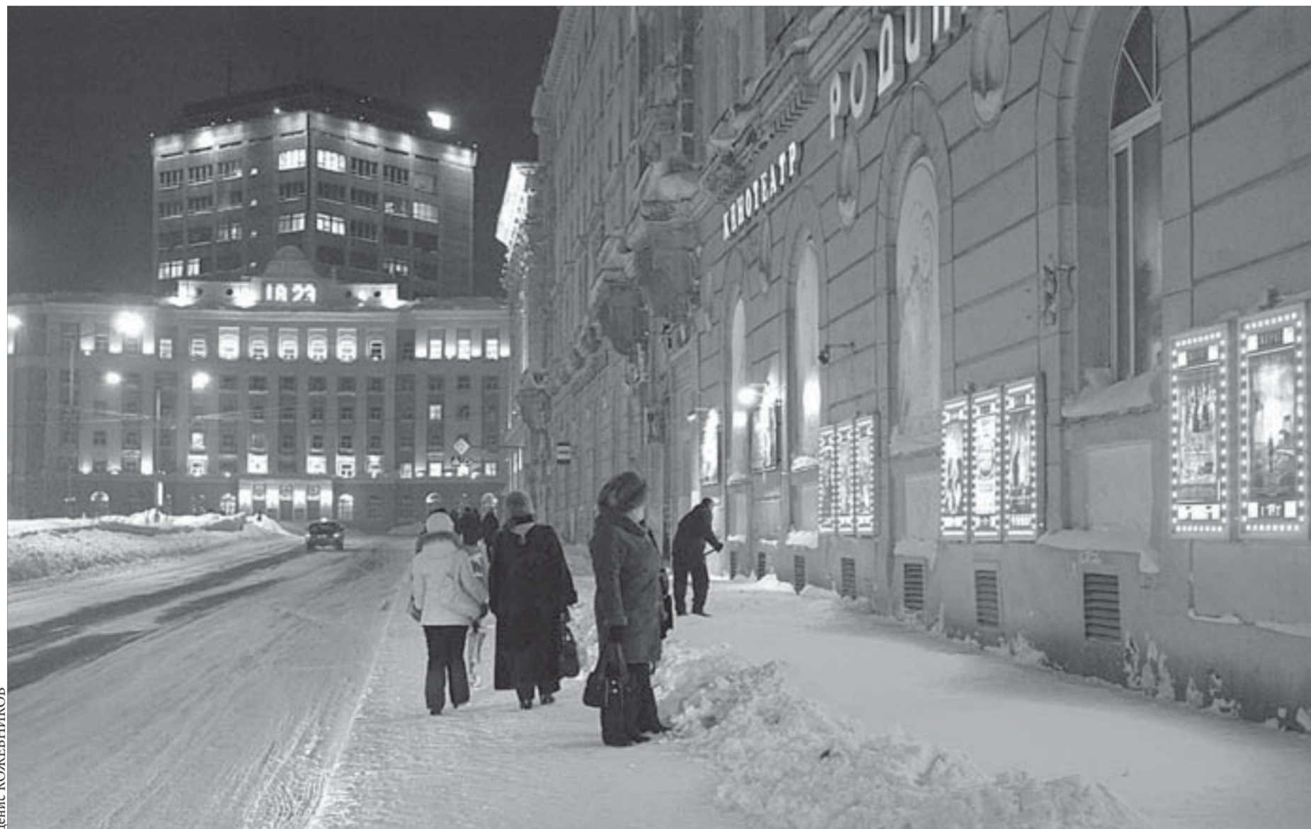
В холодном Норильске всегда светло

Учреждения дополнительного образования Норильска отметили свое 90-летие фестивалем "Созвездие успеха". Дополнительное образование в Норильске является бесплатным и включает шесть учреждений: станцию юных техников, Дворец творчества детей и юношества, станцию детского и юношеского туризма и экскурсий, центры внешкольной работы во всех районах города. Учреждения дополнительного образования Талнаха и Кайеркана многопрофильные, норильские – ориентированы на отдельные направления. Кружки и секции в данных учреждениях посещают свыше девяти тысяч школьников. На празднике в ЦК педагогов и воспитателей учреждений дополнительного образования приветствовали первые лица города и представители Заполярного филиала. Виновики торжества подготовили выставку достижений и презентацию своей деятельности.