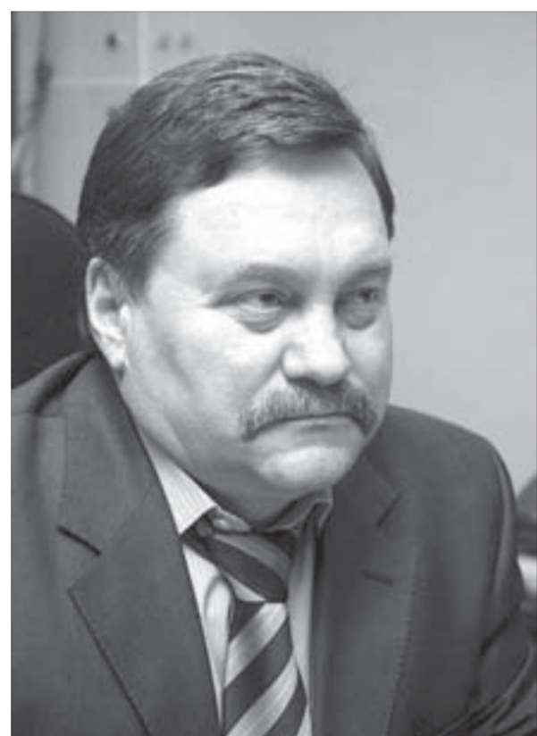
"Энергетики каждый день совершают маленький подвиг"