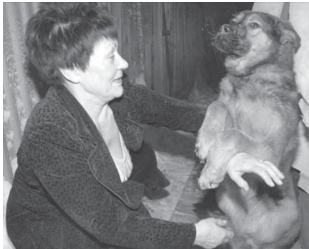
Пират нрава доброго