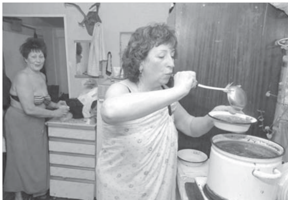
Борщ на даче фантастический!