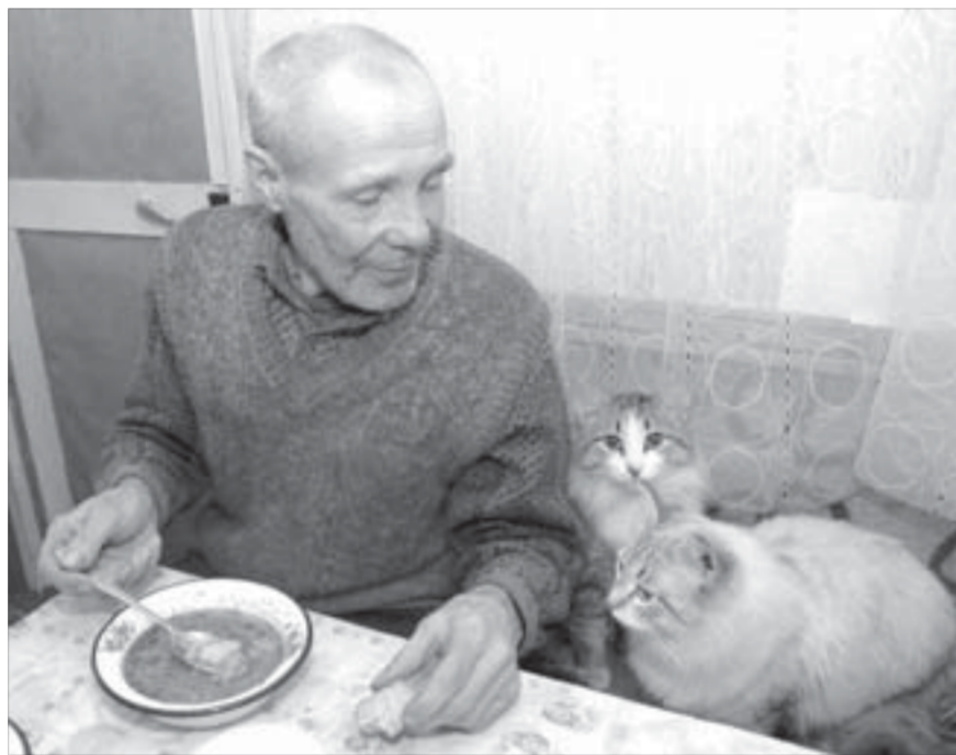
Егорыч, Кузя и Леопольд