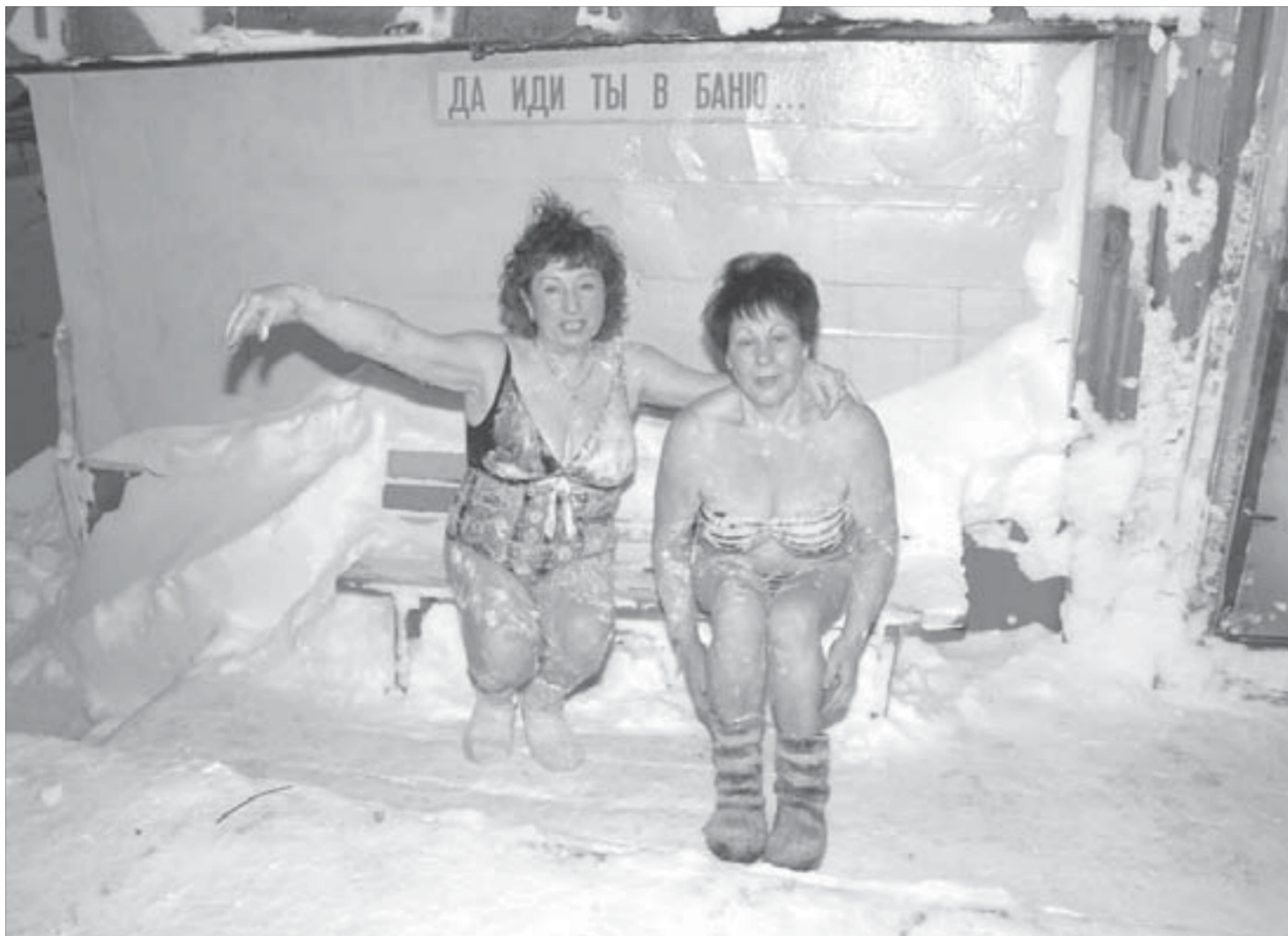
Так бы и полетела!