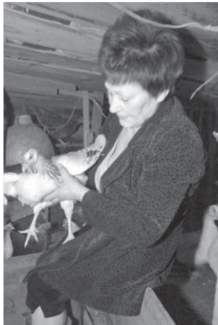
Несушки с работой справляются