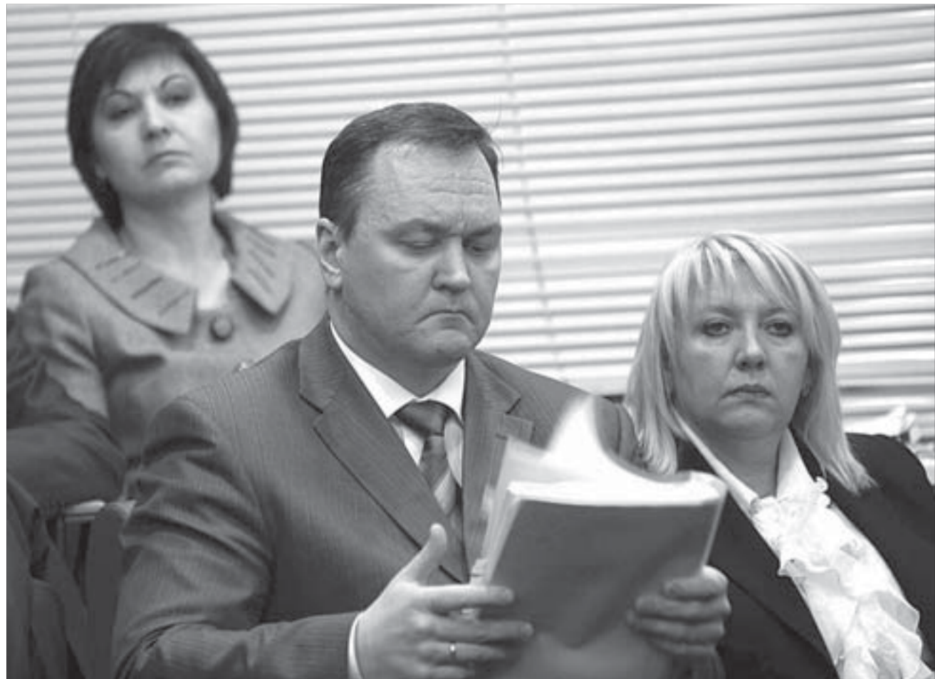
Сплотный пакет получился