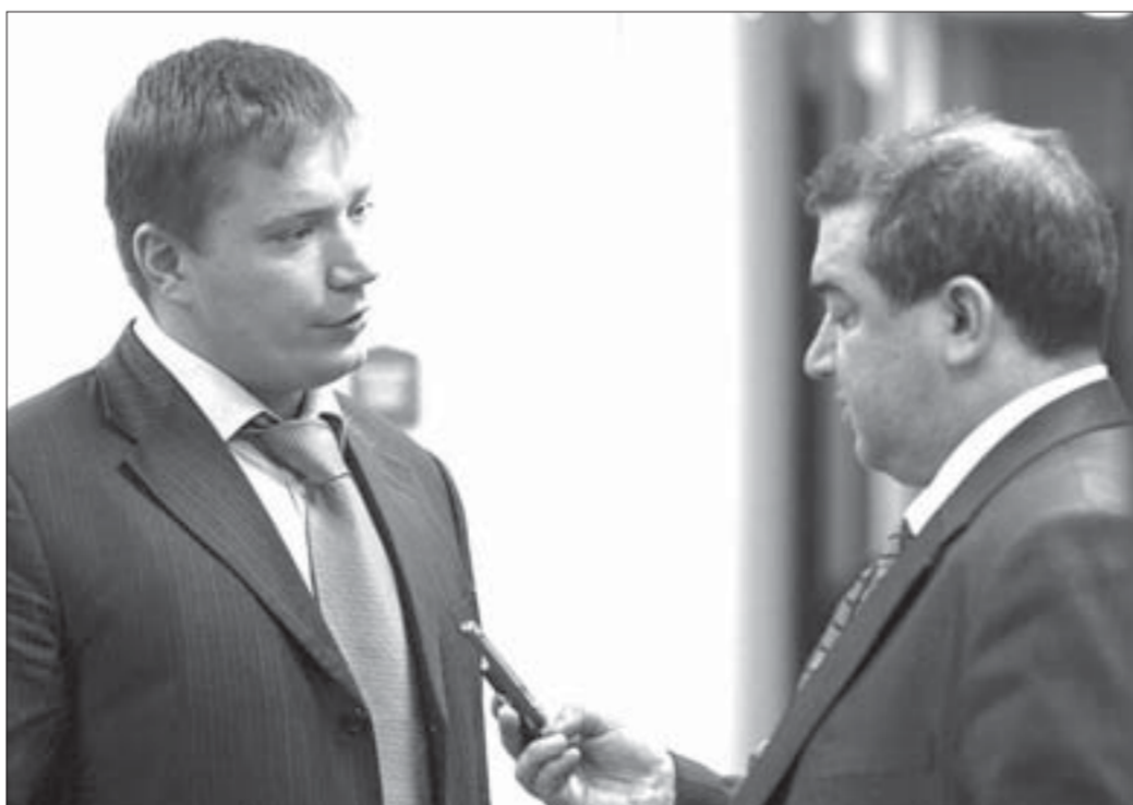
Денег у банкиров столько, сколько нужно