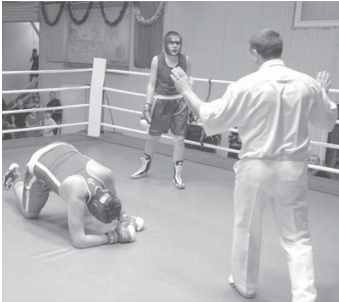
Сипен кто падает, но встает