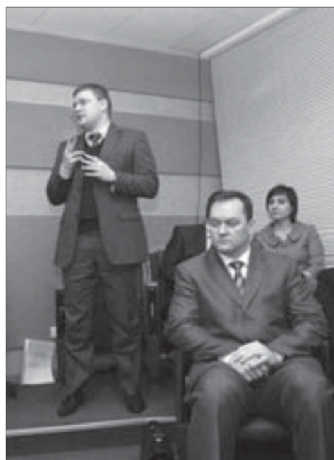
Нужно дождаться стабилизации

Вчера сессия городского совета утвердила сразу в трех чтениях проект бюджета на 2009 год. Основные параметры финансового документа известны: доходная часть казны 11 миллиардов 862 миллиона 163,5 тысячи рублей. Расходы планируются в размере 12 миллиардов 739 миллионов 443,8 тысячи рублей. Дефицит – 877,3 миллиона рублей.