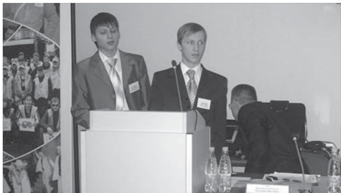
На презентации делились опытом