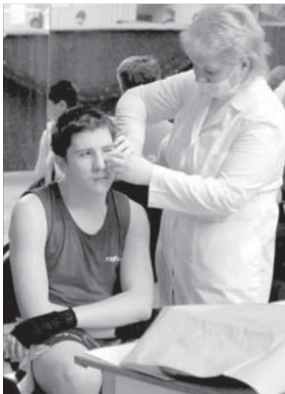
Раны заживают, "золото" не потускнеет

С редким аншлагом прошел в спортивном комплексе "Геркулес" городской турнир по боксу.