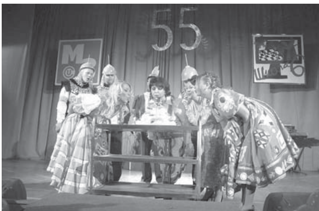
Какой день рождения без торта и свечей?