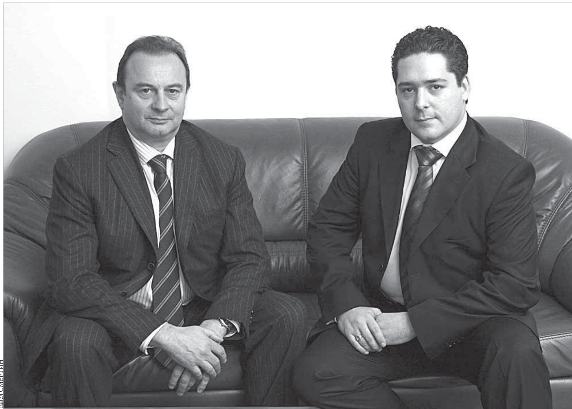
У генерального и его советника общие интересы – процветание компании

Целями деятельности Молодежного парламента являются содействие в реализации прав и законных интересов молодежи при выработке и принятии решений органами государственной власти и местного самоуправления края, а также выявление и поддержка молодежных лидеров, молодых политиков, содействие их профессиональной подготовке, востребованности творческого потенциала при разработке общественно значимых нормативных правовых актов. В состав Молодежного парламента входит 36 человек в возрасте от 17 до 30 лет включительно.