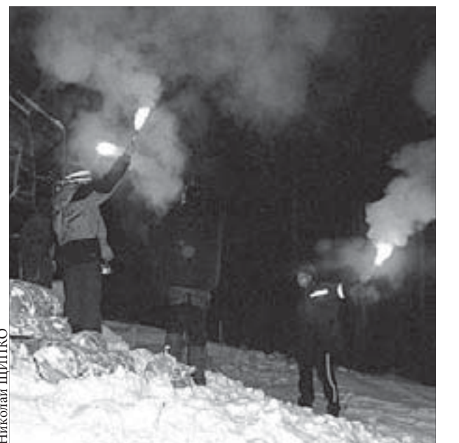
Зажигай, но правила соблюдай

Текст инструкции должен быть пропечатан четким шрифтом обязательно на русском языке и доводить до покупателя полную информацию о том, что выбранная пиротехника соответствует требованиям. Перед тем как отпустить товар покупателю, продавец обязан его проинструктировать и показать один из перечисленных документов или их заверенную копию с печатью, адресом и телефоном изготовителя.