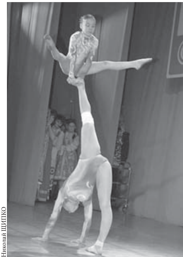
Зрители увидели удивительные номера

Курс акций ОАО "ГМК "Норильский никель" – 1918,9 рубль. ОАО "Полюс Золото" – 671 рубль.