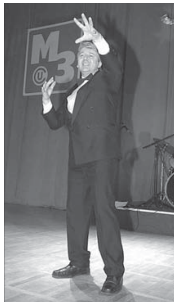
"Наша дружба не прервется никогда!"