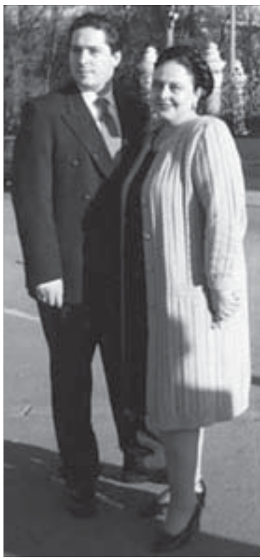
С августейшей матерью

После окончания Оксфордского университета, где изучал юриспруденцию и экономику, Георгий Романов начал работать в Европарламенте, потом перешел на должность помощника вице-президента Еврокомиссии и комиссара по транспорту и энергетике в Брюсселе. Продолжил службу в Европейской комиссии, но уже в Люксембурге, где занимался проблемами атомной энергетики и безопасности ядерного производства.