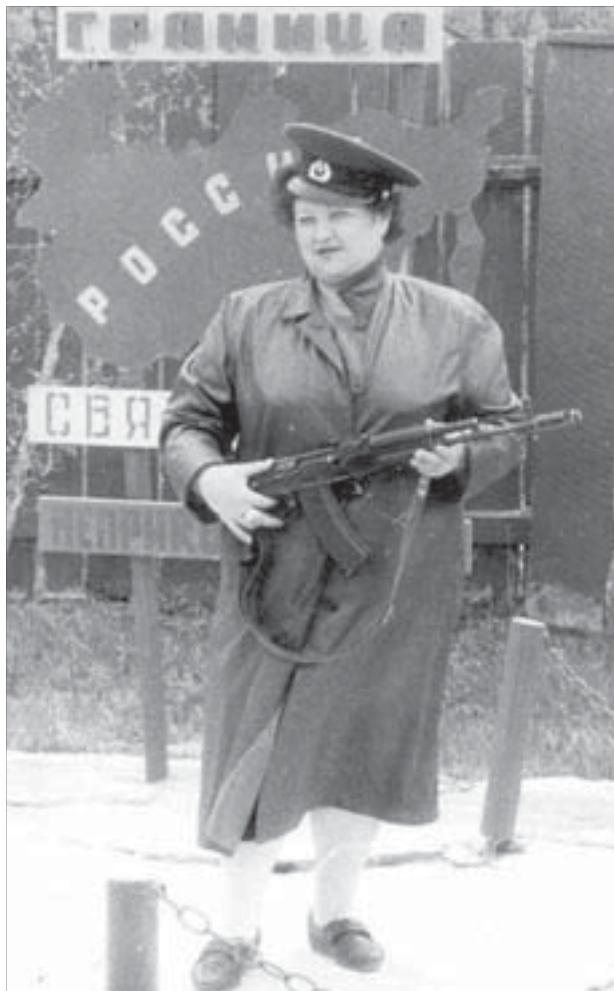
Любовь на границе. Телеэкспедиция на Дальний Восток, где служили норильчане