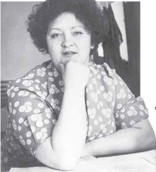
На заре телекарьеры. Начало семидесятых