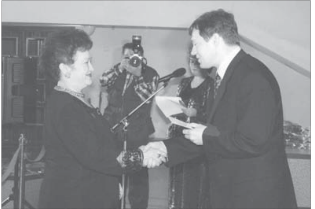
За заслуги перед прессой