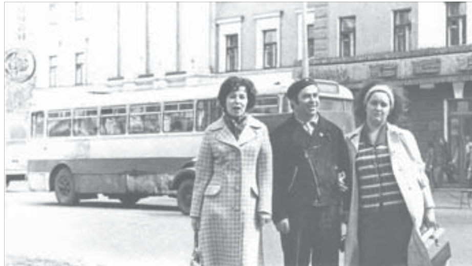
Телекласс в Красноярске. Режиссер Надежда Геталло, оператор Юрий Ковтун, ассистент режиссера Любовь Почекутова