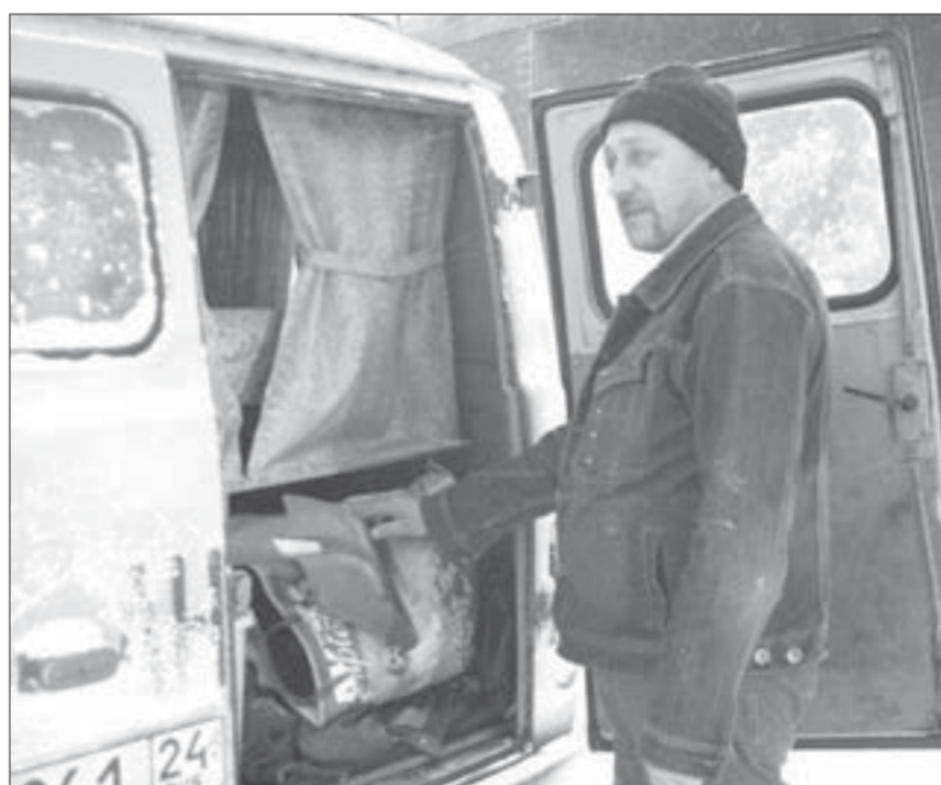
Не покажешь лопату – не проедешь