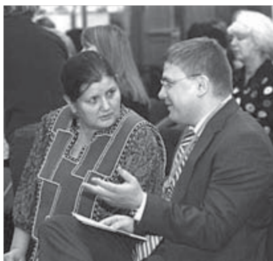
Можно пообщаться запросто