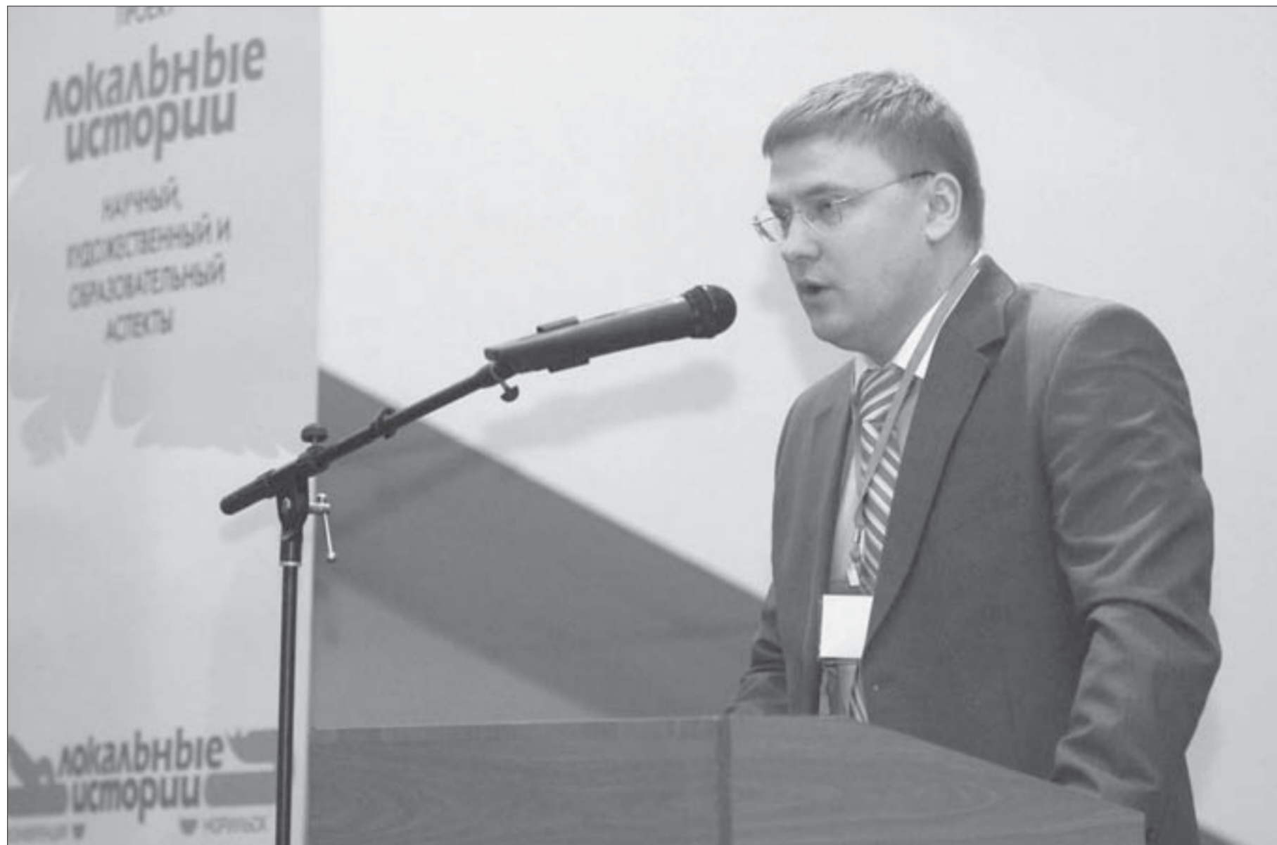
Сити-менеджер готов найти место в Арктической зоне

Дегустация пройдет в норильской школе №29 (Павлова, 21а) и тагнахской гимназии №48 (Бауманская, 15). Ознакомиться со школьным меню смогут не только представители администрации Норильска, управления общего и дошкольного образования, управления Роспотребнадзора, медики, но и родители школьников.