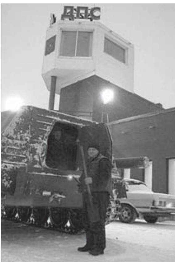
Вездеходчики обеспечены всем